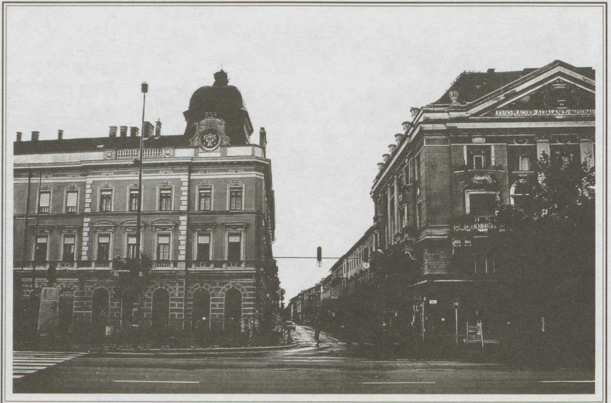
A Esztergyi út bejárata