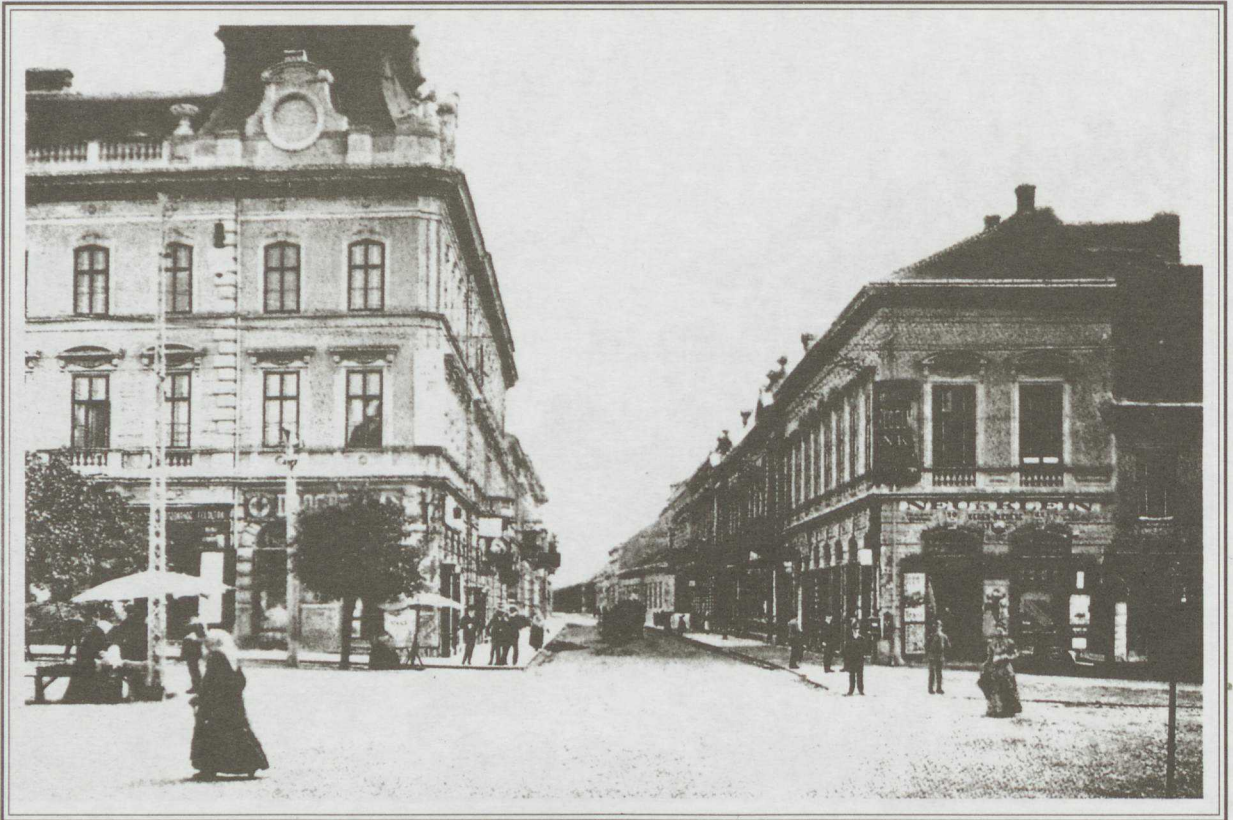
A Esztergyi út bejárata a Szokolánui-bolttal