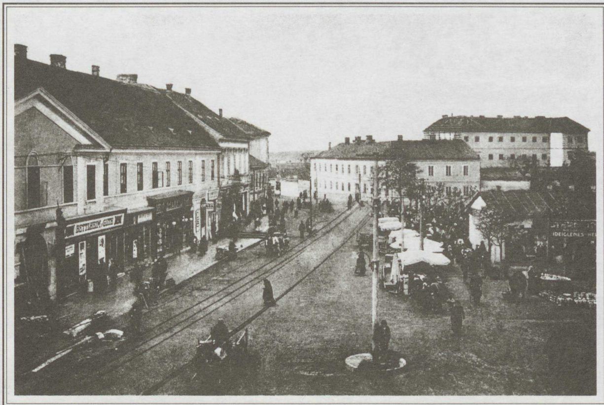
Erzsébet királyné tér