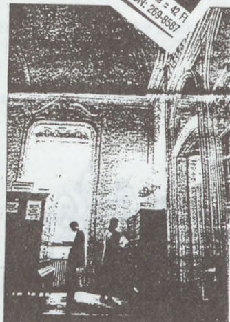
A Szabó Ervin könyvtárak egyre kevesebb új könyvre futja

A Szabó Ervin könyvtár felújítására a rászoruló, jelszórendszerrel ellátott rendszerezés beiktatásának nincs topajelző berendezésük, a vissza nem vett könyvek anyagi elengedhetetlen behajtása gyakorlatilag reménytelen. Bizonyos adatokat (például munkahely) beiratkozáskor nem kérhetnek a könyvtár olvasóitól, a lakcímváltozás sem képes nyomon követni. A felújításhoz szükséges munkaadókat és megacsoportjait az állomány. Nem kevésbé nagy jelentőségű probléma a dokumentumok, elsősorban újságok megrendelése, lapok kértése, aláhúzásiak stb. A Széchenyi könyvtár élethe léptetett egy vitatható intézkedést: csak a 18. évet befejezők vehetnek igénybe szolgáltatásait. Ez rendkívül hátrányosan énni az egyetemi, főiskolai felvételihez készülő diákokat, akik teljeséggel kizártnak az ország legnagyobb – több mint 7 millió könyvtári egyseget felölelő – könyvtáráról. A múlt század második felétől megjelent papíralapú dokumentumok időközben törtéknemű sava-sódok, szarvak. Ahhoz, hogy a könyvtárszaktatórúkat megfelelően dolgozni tudjanak, évi 50 millió forintra lenne szükség. Ez az ország nem áll rendelkezésre. Azaz Vörösmarty Mihály nevezetes költeményének szavai ma merőben más értelmet nyerne: ronggyá szakadozott az ország könyvtára.