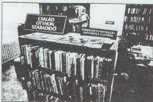
Ha már romlott egy dlopriprát a szemed: család, otthon, szabadidő

Manapság lépten-nyomon azt halljuk, hogy nem olvasunk elégét. Ennek igazsága ellentmond az, hogy a statisztikai adatok szerint a könyvtárba látogatók töbora évről évre bővül. Valóban így nagymértékben megnövekedett látogatóink a betűk után, vagy a jelenségnek egyéb, szomorú oka is lehet?