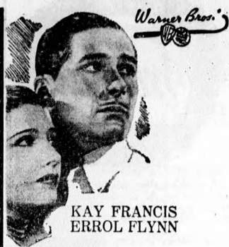
KAY FRANCIS ERROL FLYNN

A becsapott törpebohó annyira kétségbeesett. A becsapott törpe bohó annyira kétségbeesett, hogy a váláságot, Évizedes fáradság munkájának a gyümölcset, északupogatótt pénzt elvitte a szélhámos. Kétségbeesett a rendőrséghez fordult, ott azonban intézkedtek, detektívek járták sorra a pesti szállodákat, szórakozóhelyeket, mindenütt kutattak a veszedelmes kalandor után, de az a jó üzlet után