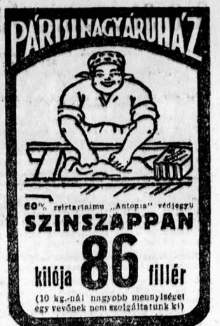
magyar motorsportnak Andrássy Mihály grófra vagy a GP elhalasztás lejtőigótó utáhang förtetőre van-e szűktege.

Megjüdünk végre „hivatalos” kijelentéssel, amit a Hétfői Napló hívatokkal első bejelentéssel már elmarad az autós Grand Prix. Mindaz, ami el bejelentés kizárte, magyarázta és mentegette — szabályos vadháshod volt azok ellen, akik miatt az idén már nincsen GP. Megtüdünk, hogy tavaly Gömbös Gyula személyes közbejézésére küldötték el az osztás és német „autós főtállókát” az első magyar GPré, amely fölöt elmarad. Azért nem érhető okokból — nem kapott megfelelő méltalató győzelmű Gyula Andrássy Mihály gróf lemetel felhívására és személyes parancsávaladására exponálta magát a GP érdekében. Minthogy Andrássy Mihály gróf éppen a GP-ből kifolyóan veszlette el a kedvét a mai motoros rezsim néhány vezéralakjának tényekéssé miatt a további irányítástól, a minden tekintetben a nagyverseny elmarad. A beszámoló nyitva hagyja a kérdést annak eldöntésére, hogy a veszedő szenderjében élő