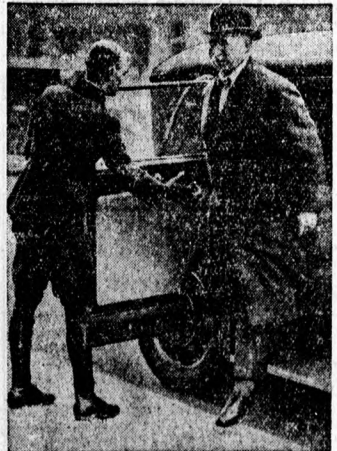
Az utolsó felvétel Albert királyról

Talán valami baleset történhetett, küldjenek azonnal segítséget.