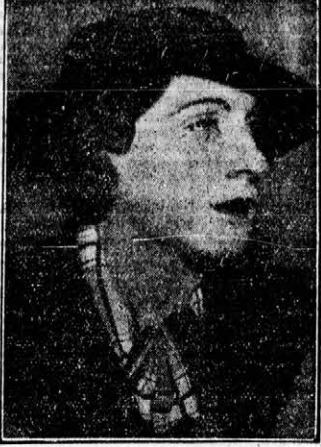
Gombaszögi Frida, mint dr. Mihályk Kata