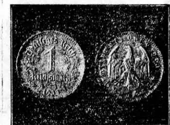
November első felében bocsátja ki Németország az új pénztárcát. Az új egymarkásokat tízszázezerből verik.

A bécsi rendőrség nyomozása nagy lendülettel folyik tovább a hatalmas bünyüggyben.