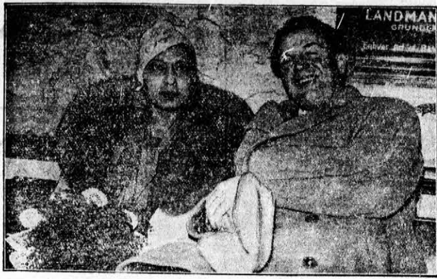
Josephine Baker és Richard Tauber a kopenhágai repülőtéren. ahová véletlenül ugyanazzal a géppel érkeztek vendégszerzésre.