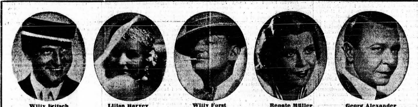
Willy Fritsch Lillian Harvey Willy Forst Renate Müller Georg Alexander