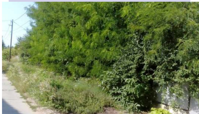
Valahol a „zöldség” alatt lapul egy járda...

Közterületen lévő árkok, nyitott csatornák, folyókák, átereszek tisztán tartása, a csapadékvíz akadálytalan