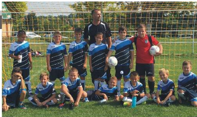
Bozsik torna 2016.09.11. U-11