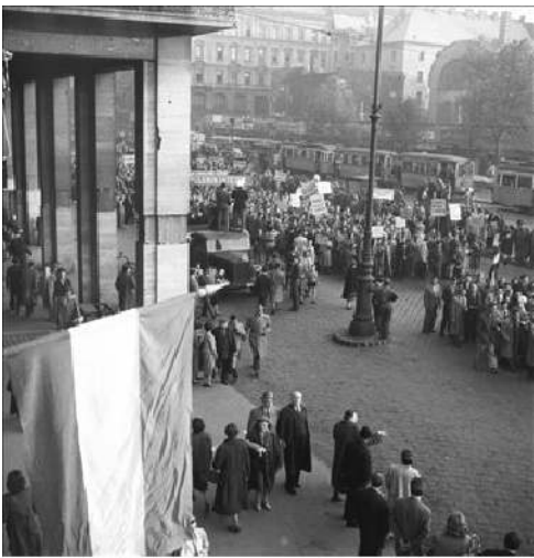
1956. október 23. - Tömegmegmozdulás Budapesten. Felvonuló tömeg a Károly körúton. A felvétel az MTI Fotó épületének ablakából készült.