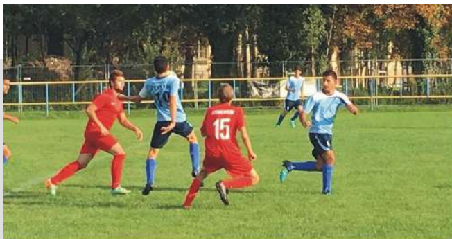
U19 Tura VSK - Kisnémedi MSE