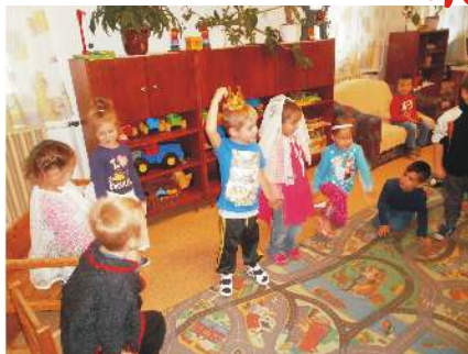
Szóló szőlő, mosolygó alma, csengő barack

2016. szeptember 30-án „Népmese Nap” volt óvodánkban. Programok: mesevár építés, óvó nénik meséje, rajzkiállítás „Kedvenc mesehősöm”. A mellékelt képek a középső csoportban és a két nagycsoportban készültek.