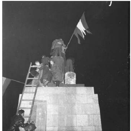
1956. október 23. - Tömegmegmozdulás Budapesten a Felvonulási téren álló Sztálin-szobornál.