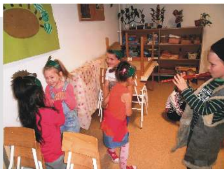
A csillagszemű juhász