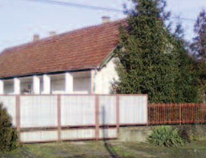
A régi szódagyár épülete a Trincsen