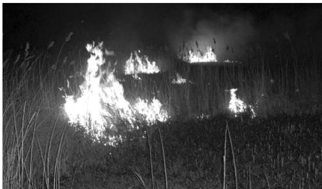
Ég a nádas

Tudjuk, hogy a szennyeződések felhígulását a kedvezőtlen időjárás nagymértékben akadályozhatja. A nagyvárosokban tartóhatatlan helyzetet próbálják ugyan közigazgatási eszközökkel enyhíteni, de a szmog-riadók elrendelése, csak eredmény nélküli látszatintézkedéseknek tűnnek. Budapesten a lagymatag körgyűrű és metróépítések mellett, más intézkedésekre is égető szükség lenne, miközben a Budai-hegység városra lenyúló erdejét lassan felfalják a lakótömbök. A „könnyen szerzett” pénzekből, az erdőbe benyúló „nevesincs” utcákban kacsalábon forgó paloták állnak. Ráadásul túlnyomórészt üresen, ezzel „munkalehetőséget” biztosítva a gombamód szaporodó, nyereszkedő örző-védő vállalkozásoknak. A belső kerületekben is minden beépül, miközben az új bevásárló központok és plázák is értékes zöldterületeket vesznek el a várostól.