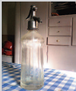
A régi fél literes szódásüveg