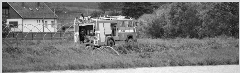
Összefogással álltak a víz útjába, mely nem kímélte sem a termőföldeket, sem a lakóházakat, sem a pincéket