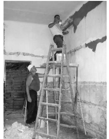
A polgármesteri hivatal egy elhatárolt részében folyik a felújítási munka, de az ügyfélfogadás kis átszervezéssel zavartalanul működik.