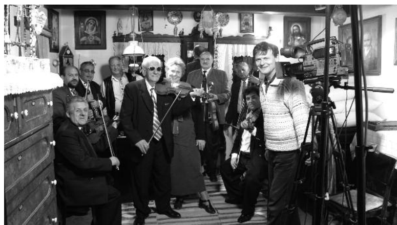
A forgatás egyik pillanata

(Szemelvények Gólya József Loby dvd-borítón olvasható gondolati bevezetőjéből)