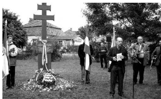
A posta melletti kettőskeresztnél emlékeztek Trianonra