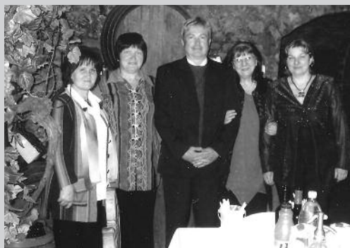
A Cserhát Művészklub turai csoportja első gyűjteményes kiállításán Budapesten

amit szeretett volna. Ezt követte az a gondolat, hogy saját tervezésű és készítésű ruhákban járhatja lányát. Fantáziájának kibontakozása mellé a képzések sorozata következett, ami nem volt eredménytelen. Ruháin látszik az a gondos munka, mellyel készítők alkotta.