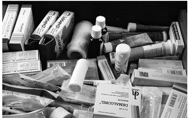
Gyógyszer, vagy mérge?

Az emberi idegrendszer, a környezetszennyezés egyik legjobban kiszolgáltatott célpontja. A központi idegrendszer sejtjei ugyanis – más sejtekkel ellentétben – ha egyszer elpusztultak, nem tudnak újratermelődni! Számos szennyezés akár mindenütt (szabad környezetben, otthon vagy munkahelyünkön) károsíthatja idegrendszerünket. Az ólom és más nehézfémek mellett, ilyenek az oldószerek és a növényvédő