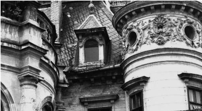
Az eklektikus stílusú épület részlete