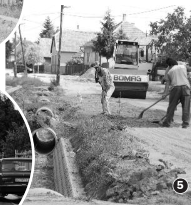
1) Hevesy, 2) Ady, 3) Toldi, 4) Bartók, 5) Magdolna utak készültége