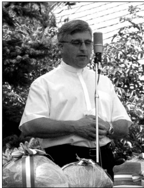
Első, templomon kívüli turai beszéde közben, az augusztus 20-i kenyérszentelésen...

ten, a Piarista Gimnáziumban végeztem, ahová akkor négyen jártunk a Galgamentérről. Azokat, akik abban az időben a papi hivatást választották, két évre beszippantotta a néphadsereg, nehogy megússzák az ottani átnevelőmunkát. Egy-