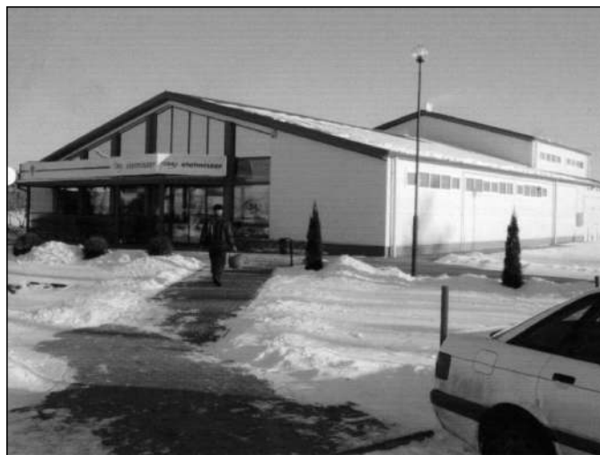
Az áruház típussterv alapján – várhatóan Turán is hasonló homlokzattal – épül fel; mellette hatvan parkolóhelyet alakítanak ki