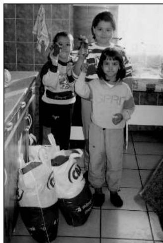
Három elégedett arc – ezért a látványért érdemes segítséget nyújtani

- Ötven csomagot készítettünk el abból a gyermek- és felnőttruha-készletből és játékmányból, amit a Magyar Vöröskereszt Aszódi és Gödöllői