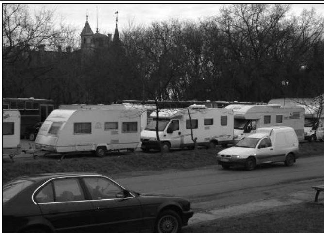
A Régi Vásártéren kialakított lakókocsiparkban az öltöző- és pihenőhelyiségek mellett iroda- és WC-busz, valamint egy konyhasátor kapott helyet

díjban, majd megkezdődtek az előkészületek. A díszletépítők hetekkel a forgatás előtt megjelentek a helyszínen, hogy „elvarázsolják” az előteret, a pálmaházat és az azokat összekötő folyosót. A külső szemlélődő számára „csupán” a Régi Vásártéren felállított lakókocsi- és buszpark, valamint a kastélyparkban álló daruskocsikra rögzített reflektorok fénye árulkodott a produkció munkálatairól – egyébként a teljes titokzatosság jellemezte azt. Az egyik bulvár lap arról írt (és az interneten is olvasható), hogy az M0-s környék mentén felépítettek egy amerikai benzin-