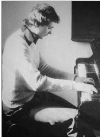
Egy kép a 70-es évekből

- 1995-ben hívtak át az akkori Állami Hangversenyzenekarhoz. Ez a valaha szebb napokat látott együttes, mely évtizedeken át a magyar zenei élet