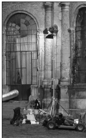
Csendélet a forgatás szünetében

kút-díszletet, ahol rögzítettek néhány jelenetet, de ennél több nemigen jutott ki a köztudatba.