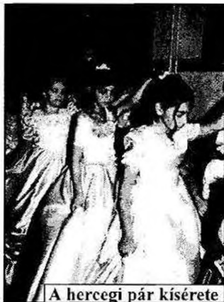
A hercegi pár kísérete