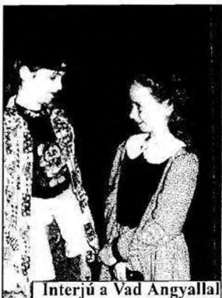
Interjú a Vad Angyallal