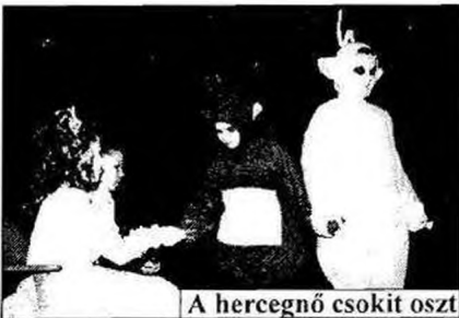
A hercegnő csokit oszt