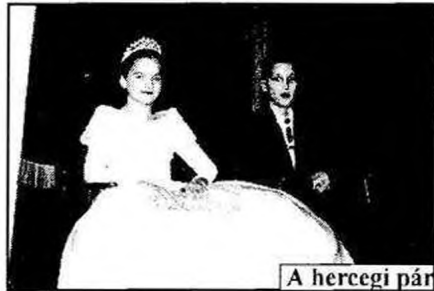
A hercegi pár