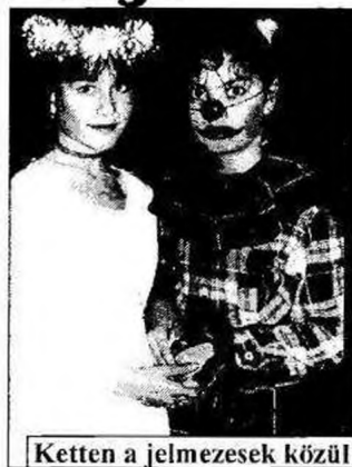
Ketten a jelmezesek közül