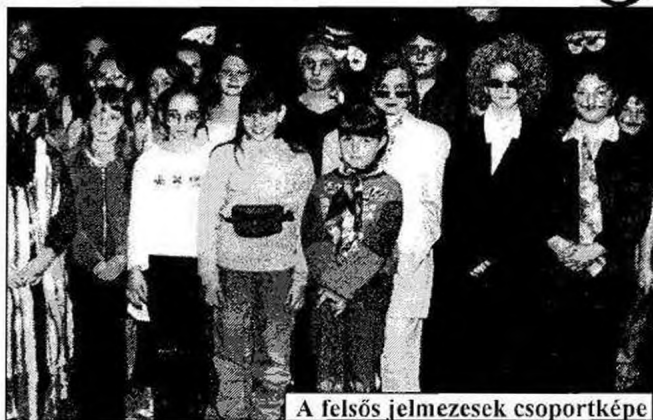
A felsős jelmezesek csoportképe