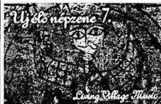
A kazetta borítója