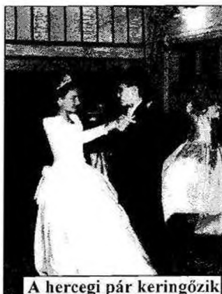
A hercegi pár keringőzik