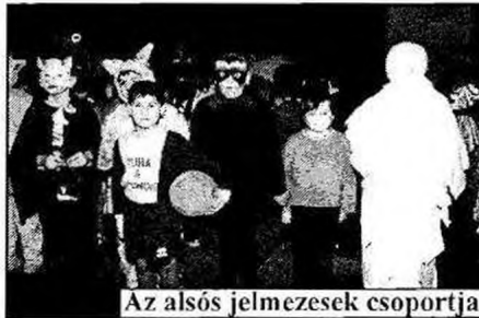
Az alsós jelmezesek csoportja