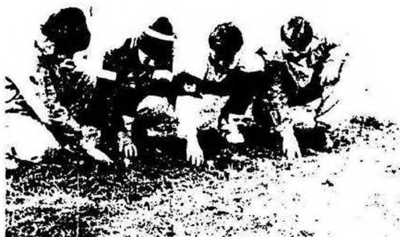
Turai fiúk az egyhajúvirág számlálása közben

Tura mellett fekszik egy 14 ha-os védett terület, ahol egy fokozottan védett növény: az egyhajúvirág található. És ez a növény egyúttal a helyi zöldszívesek védence is. „Kora tavasszal virágzik. Az idén február 11-én észleltük az első virágcsodákat (4 db). A virágzás már akkor megindul, ha a talaj hőmérséklete a hagymák mélységében eléri a 7 Celsius fokot. A virágok lilás rózsaszínűek, hat lepel alkotja két körben, töállóak.” A terület gondozásában nem csak ők, hanem barátaink is segítenek: takarítják a területet és óvják a betolakodóktól.