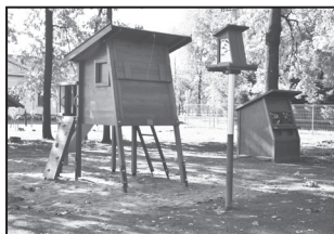
A Pihenőparkban új játszóeszközöket állítottak fel

A közterületekre szeptember végén elültették a közfoglalkoztatott munkatársaink az őszi árvácská palántákat. Most még pályázati támogatással virágozhatunk, ám azt nem tudom, hogy jövőre tudjuk-e majd finanszírozni. Tisztelettel kérem