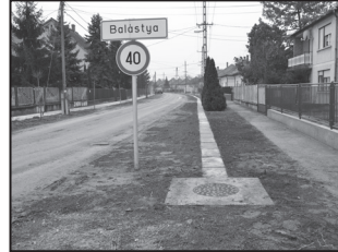
A Dózsa utcában betonelemekkel fedték le a belvíz elvezető csatornát

tulajdonos keresett meg azzal a kérésükkel, hogy szeretnék a csatorna földfalú részsűjét megváltoztatni, betonelemekkel burkolni, és azt saját beruházásban elkészíteni, amihez sem önkormányzati, sem pályázati összeget