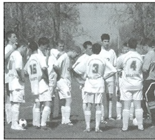
A 2013-as tavaszi szezon előtt változás várható a Sportkör életében

Elképzelésünk szerint a két csapatból egyet alakítunk ki, de ebben konkrét döntések még nem születtek, viszont közösen gondolkodunk a további működés kereteinek meghatározásában, amihez a Csongrád Megyei Labdarúgó Szövetség megyei igazgatóját is felkértük.