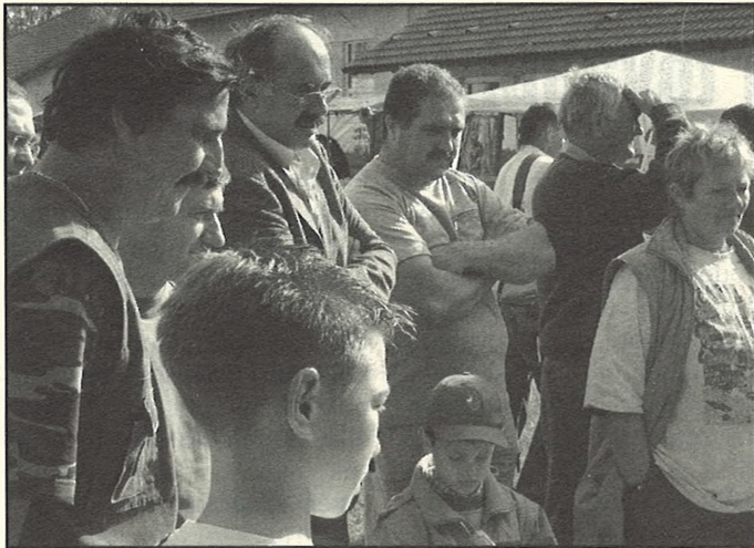
Sokan voltak kíváncsiak a zöldségfesztiválra