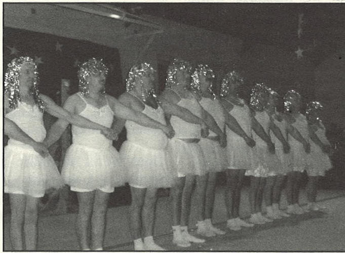
Dalás „nők” az ÁMK-bálon

– Kedvezően bírálta el Balástya pályázatát, így megvalósulhat a tervezett településközpont, amelynek ékköve