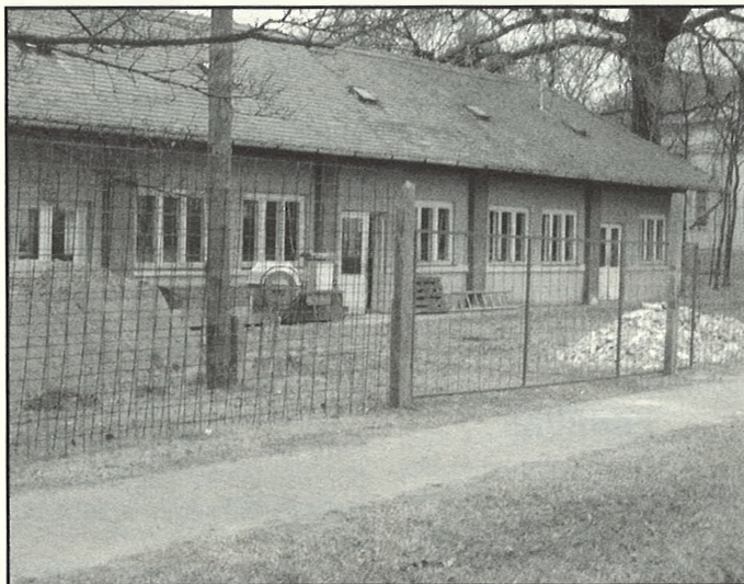
Alakul a Balástyai Tanoda

Késő ősszel megkezdődött a Rákóczi utca szélesítése. Amint a jobb idő beköszönt, ez rögtön folytatódik, és a másik oldalon is ugyanolyan terelő- és növényzsigetekkel ellátott, felújított járda és parkoló jön létre. Fontos-