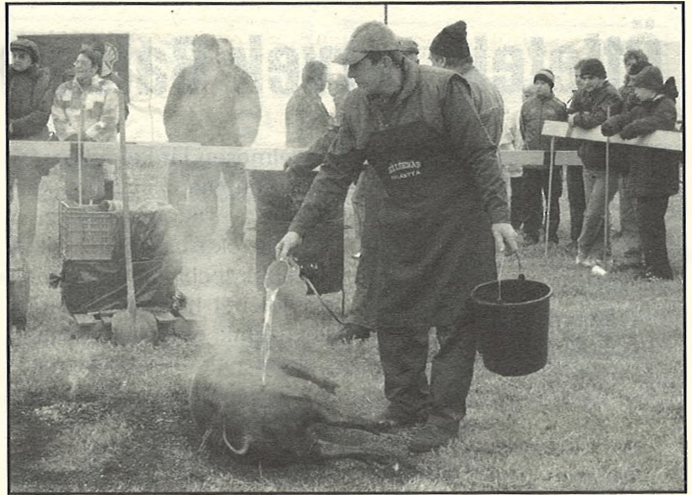
Minden disznó így végezte a böllérnapon