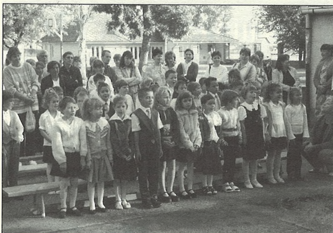
Megilletődötten az évnnyitón