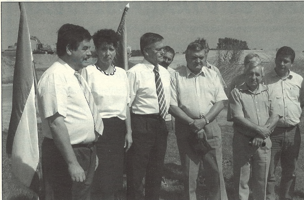
Teljes egység a demonstratív sajtótájékoztatón

Hatékonyak bizonyult a polgármesteri és képviselői lobbizás, az országgyűlés szeptember közepén úgy döntött: a gazdasági tárca pénzügyi érveivel szemben fontosabb 45 ezer ember esélye, hogy bekapcsolódhasson az ország és Európa vérkeringésébe, azaz: a Szeged és Kiskunfélegyháza között épülő M5-ösön Balástyánál is lesz le- és felhajtó. Összefoglalónkban a pozitív döntésig vezető hosszú küzdelem kulisszatitkaiba adunk bepillantást.