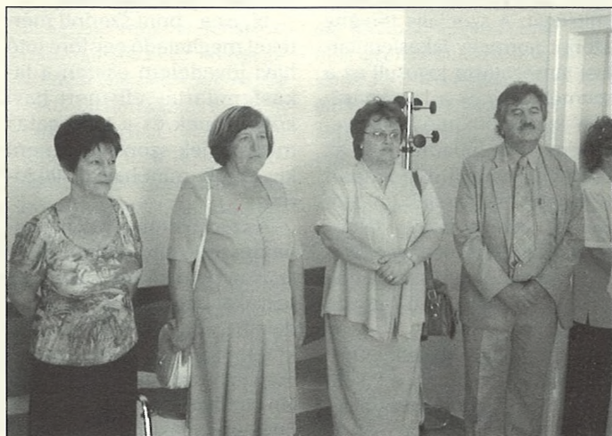
Szűz Mária születésnapján adták át a rendelőt