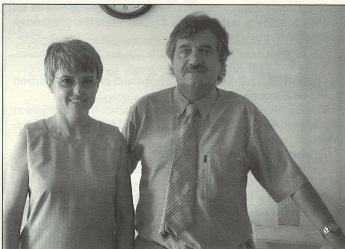
Az orvosok is örülnek a változásnak