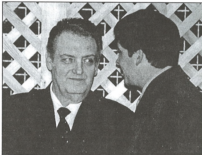
Húsz éves a barátság a világhírű operaénekes, Gregor József és Kiss József hentes között. Nagy megtiszteltetés volt, hogy a Böllérnap főszervezőjének kérésére a bál műsorban szeretetből vállalta a fellépést.