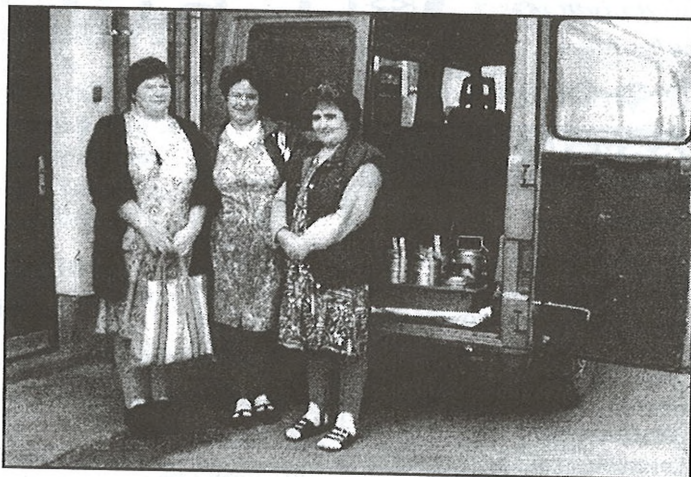
A gondozónők útrakészen

zésből áll. Attól függ az ellátás, hogy ki milyen segítséget kér, milyen ellátást igényel. Az ebédért 180 forint a maximális térítési összeg, a gondozásért 180 forintos óradíjat számol el az önkormányzat, attól függően, hogy mennyi időt töltenek el a gondozónők az adott helyen. Az önkormányzat százalékos arányban a nyugdíj nagyságától függően állapíthatja meg a térítési díjakat, melyet 15.000 forintnál 100%-os, 15.000 forint alatt 25-40-60-80%-os kedvezménnyel kell fizetni.