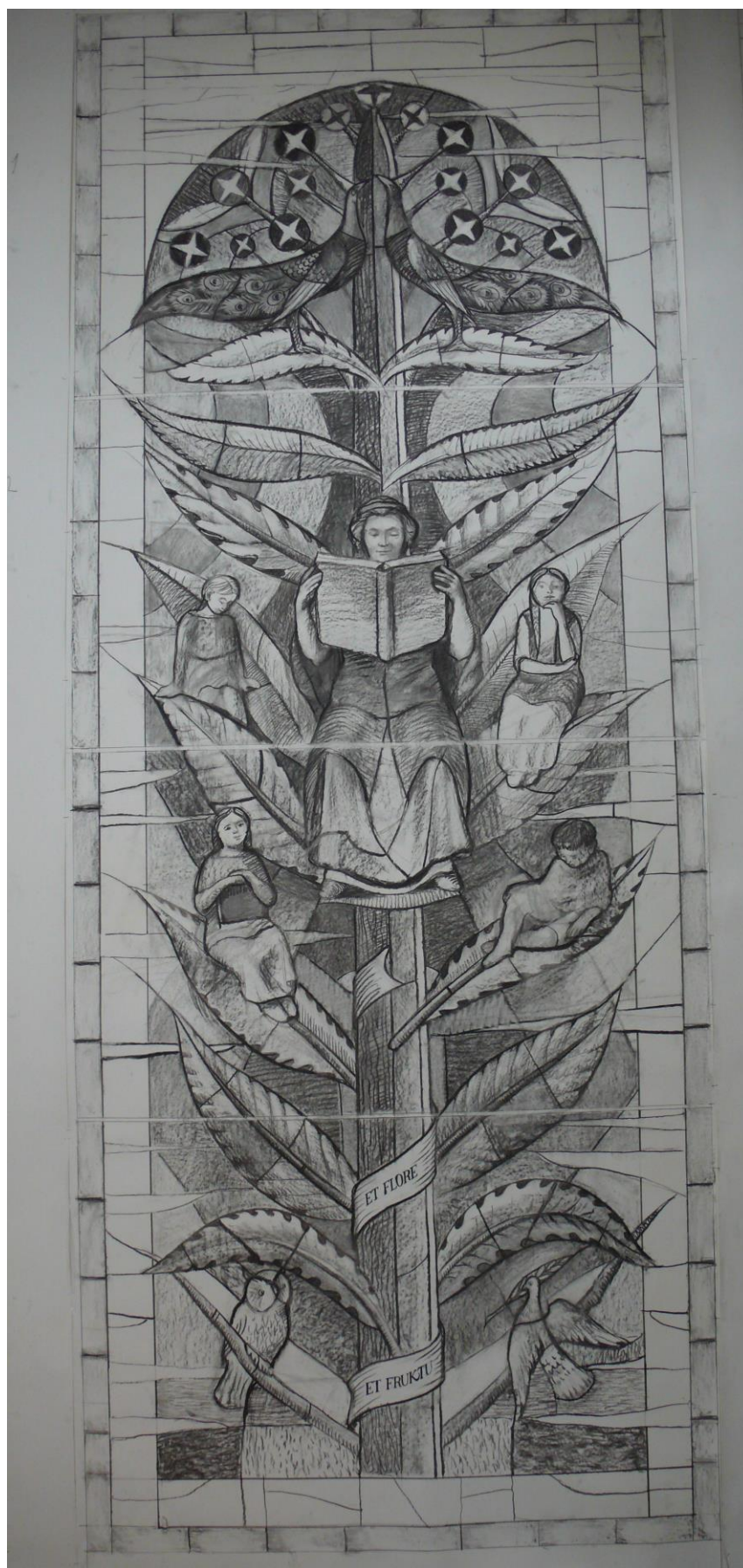
Bráda Tibor: A Tudás fája (Kartonrajz Győr, Széchenyi István Egyetem Apáczai Csere János Kar üvegfestéséhez)