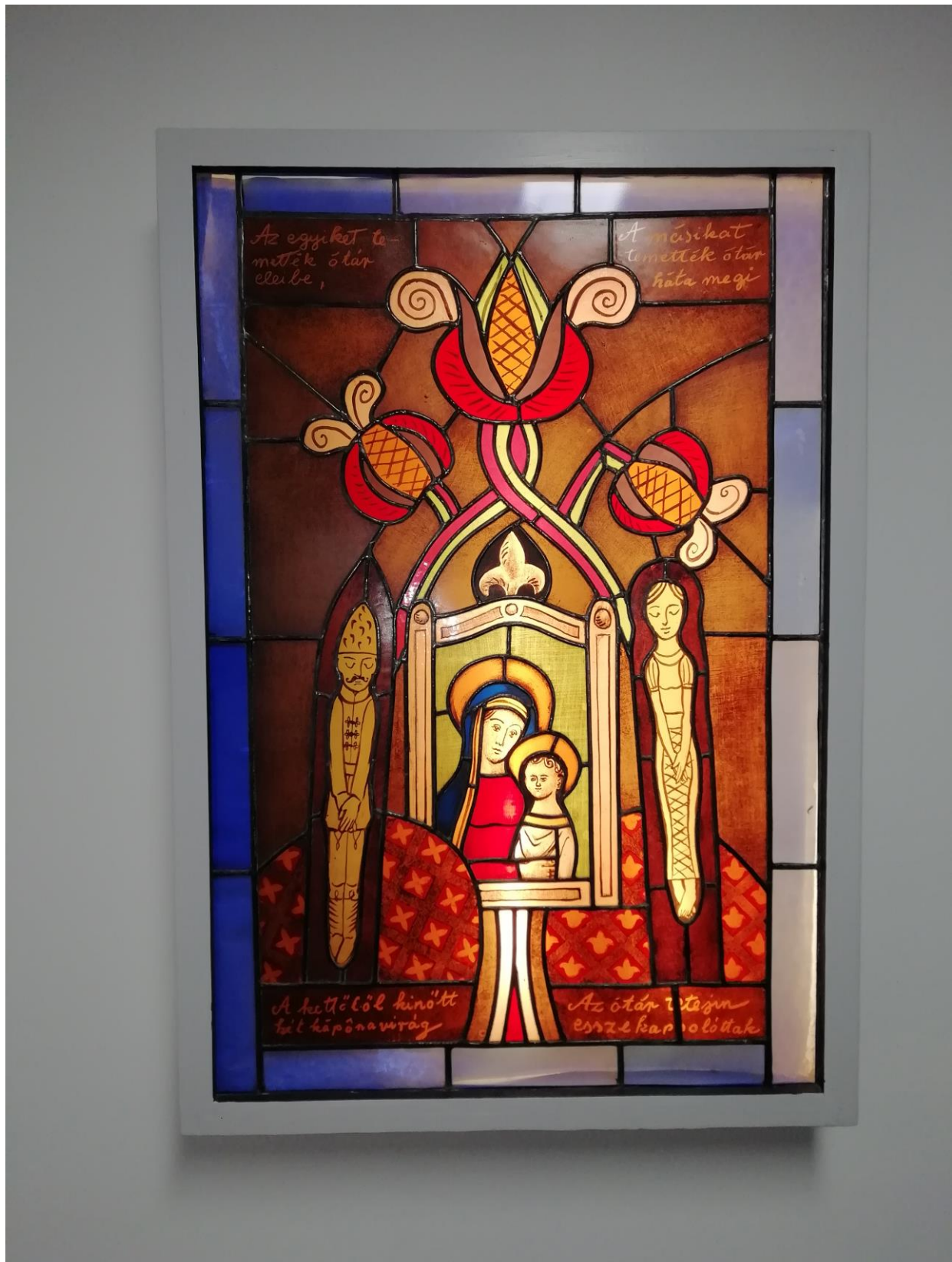
Bráda Tibor: Kádár Kata balladája

Ennek megfelelően a Kádár Kata-ballada emblemikus újratemtése az üvegfépen már túlhalad a népi költői műfaj földi keserűségén.