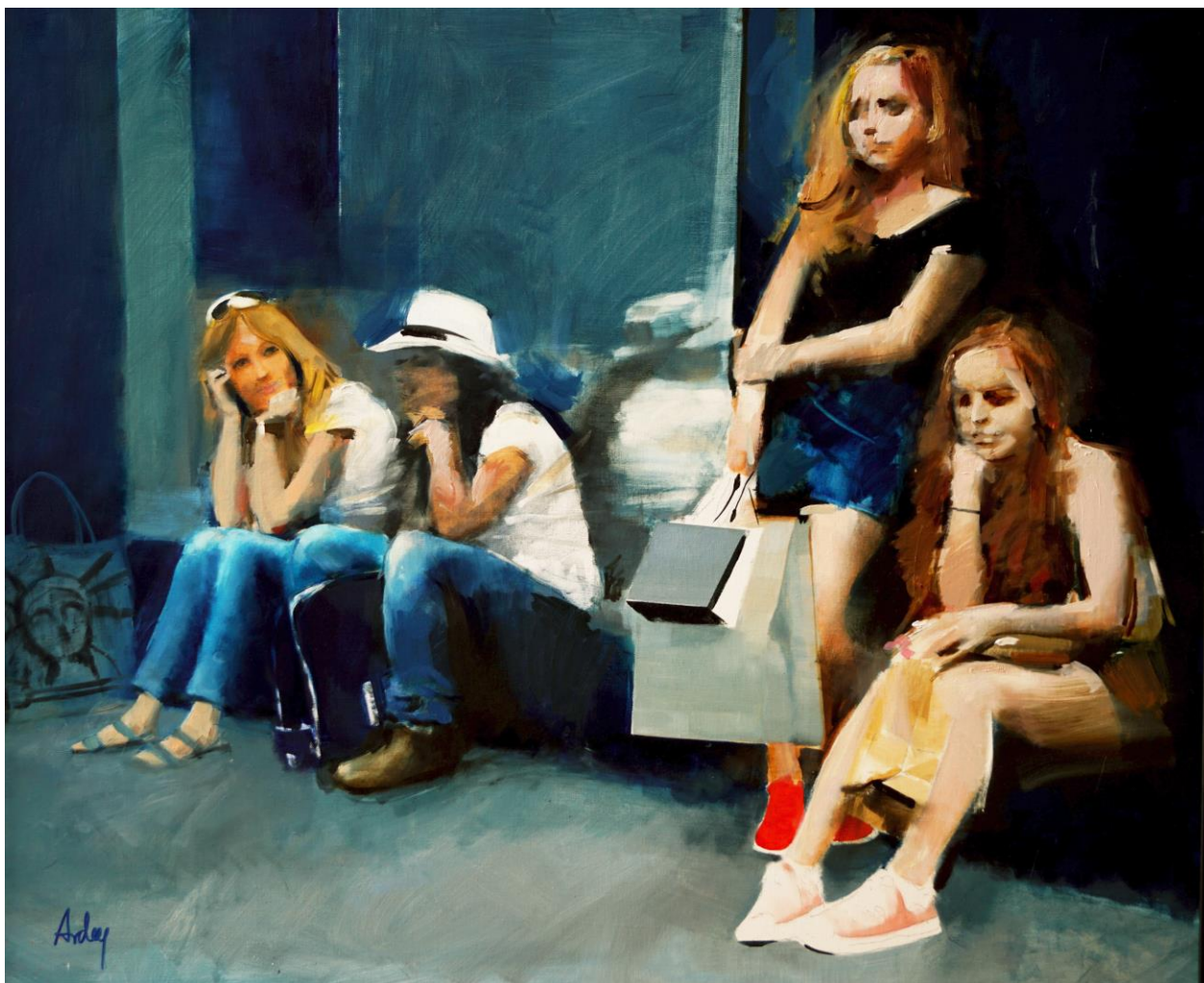
Unatkozó lányok New Yorkban

A művészi oeuvre összetettségének érzékeltetésére ide emelünk még egy képet egy New York-i sorozatból.