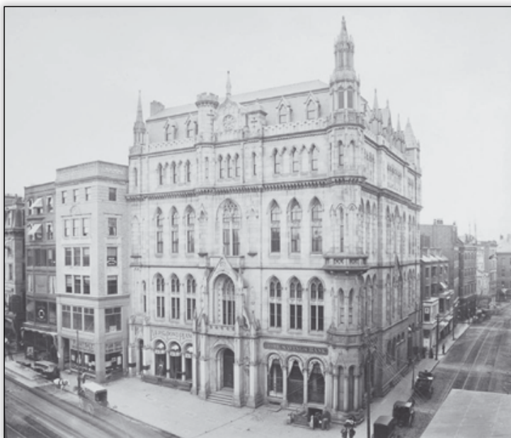
A Masonic Temple a 19. századi történelmi Bostonban

Ha valaki végigsétál Boston (az Amerikai Egyesült Államok egyik tagállama, Massachusetts fővárosa) óvárosi macskaköves utcáin, és szemügyre veszi a patinás épületeket, könnyen azt képzelheti, hogy a tizenkilencedik századba csöppent vissza. Sajnos, a történelmi Masonic Temple-épület a Tremont Street-en már nem látható, és a környék is jelentősen modernizálódott, de a történelmi dokumentumok ma is bizonyítják az épület jelentőségét. Többek között itt működött Bronson Alcott 1 híres kísérleti iskolája, amely a Transzcendentalizmus nevű, 1830 és 1880 között virágzó filozófiai és irodalmi irányzat elveit alkalmazta az oktatásban.