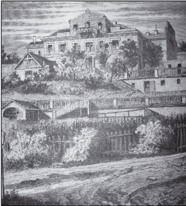
A Spolarich-ház és a gyakorlókert

A Paedagogium főiskolai jellegének általános elismertsége ellenére, mindvégig elemi iskolai tanítóképezdeként lett finanszírozva, és csak az igazgatói leleményeségen múltott, hogy nem csak fennmaradni tudott, hanem folyamatosan fejlődött is.