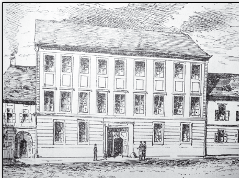
Az Országház utcai épület főhomlokzata