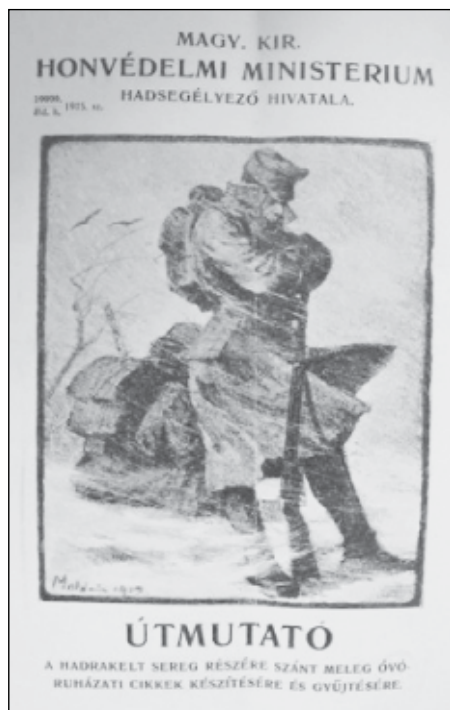
A meleg, óvó rubázati cikkek készítéséhez küldött központi útmutató címlapja

szükségünk van [...] a bósapkák, érmelegítők, térdvédők készítéséhez pamutra. [...] Szívesen vesszük az ingekhez, baskötőkhez, lábravalókhoz és téli kapcákhoz szükséges flanellt és barchetet is. Hasonló kérelmet intéztek városunk jótékony egyesületeinek igen tisztelt vezetőihez is. [...] Nemkülönben szól kérelmem egyes jótévőkhez is, kik katonáink részére a harctérre meleg rubát adományozni szándékoznak [...]. 20