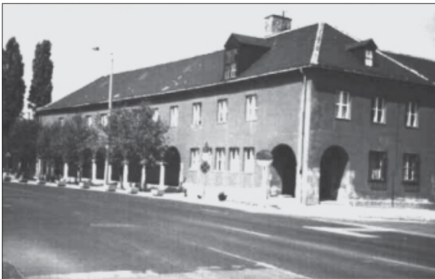
Az állami polgári fiú- és leányiskola 1943-ban létesített új épülete

Székesfehérvár közgyűlése 1938. augusztus 1-jén tartott ülésén hozott határozatot az új polgári iskola megépítéséről. A testület határozatában kimondta, hogy „biztosítja az épület kivitelezésének államsegély feletti költségeit, és vállalja az építkezés lebonyolítását” .