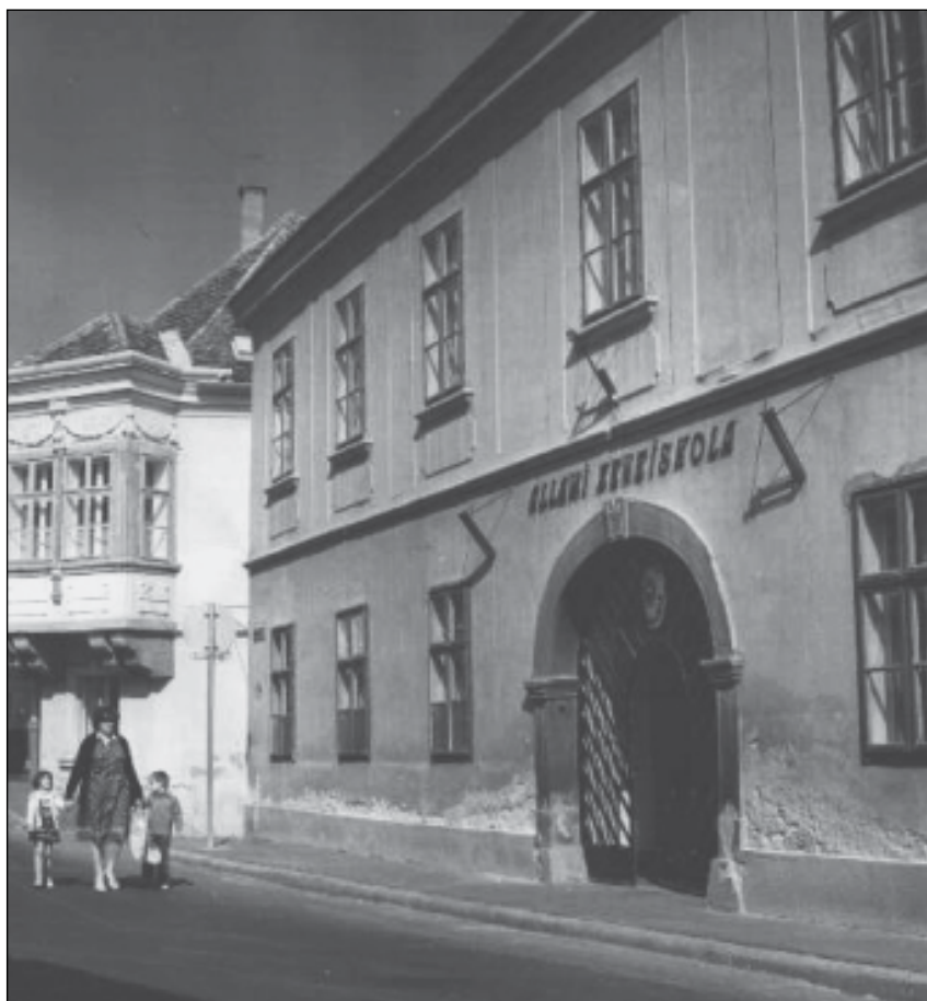
A községi leány polgári iskola, majd Szent Margit gimnázium épülete 1932-ig, ezt követően városi zeneiskola

A 90-es évek közepére létrejött az iskola önálló tantestülete, és ezzel megvalósult a szakrendszerű oktatás. Az intézetben folyó oktatás színvonala a tárgyi és személyi feltételek javulásával fokozatosan növekedett. A korabeli leírások szerint a községi leány polgári iskola a város közönsége által egyre elismertebb lett. Ezt igazolják a következő statisztikai adatok is: az 1876/77-es tanév és az 1900/01-es tanév között a polgári iskola I. osztályába 1199, a II. osztályába 917, a III. osztályába 761, a IV. osztályába 519, összesen 3396 tanuló iratkozott be. 3