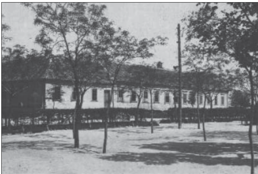
Az Állami Polgári Főiskola első épülete (A Mirth-féle csendőrlaktanya)

A új épület átadó és névadó ünnepélyét (az ugyanekkor emelt leánygimnázium épületével közösen) 1932. november 19-én 11 órakor a Szent István-teremben tartották. Az ünnepségen a megye és város vezetőinek, a helyi iskolák, a szülők és tanulók küldöttei kíséretében részt vett és beszédet mondott Hóman Bálint kultuszminiszter is. 13