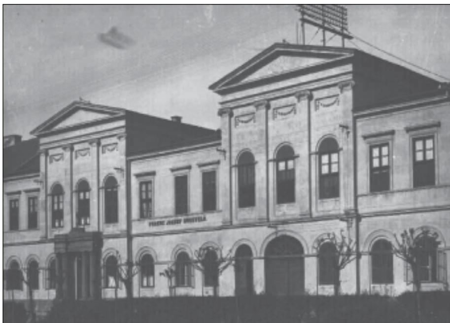
Az iskola régi épülete