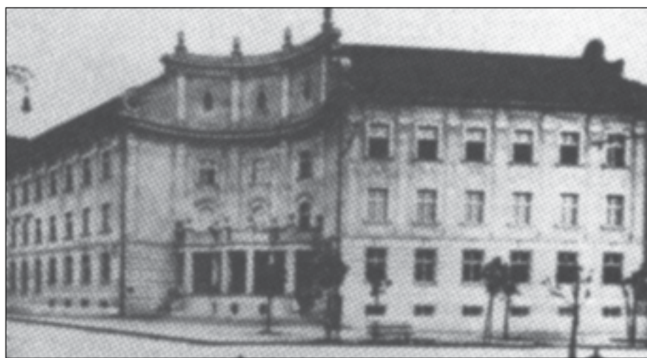
A Ferenc József Nőnevelő Intézet új épülete az 1930-as évek elején

Ugyanebben a tanévben a polgári leányiskola és a női ipariskola közös tantesztületének tagjai voltak: