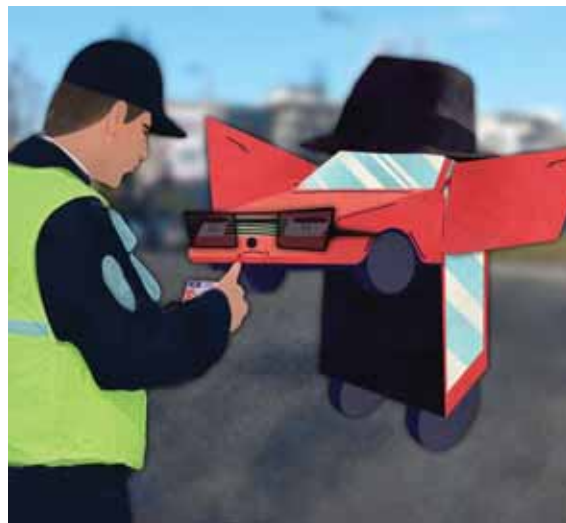
GRAFIKA: VARGA TIMEA LAURA

A körzeti megbízottak egy gyanús autóra lettek figyelmesek a Szentmihályi úton. A járműnek elől hiányzott a rendszámablaka, a hátsó tábla azonosításakor kiderült, hogy az autónak sem felelősségbiztosítása, sem műszaki engedélye nincsen, sőt még a forgalomból is kivonták. A rendőrök megállították az autót, melynek sofőrje nem rendelkezett vezetői engedéllyel, illetve az is kiderült, hogy a hátsó rendszám egy másik autóról való. Emiatt a jármű vezetőjét előállították a kerületi kapitányságra, ahol már gyanúsítottként hallgatták ki. ♦