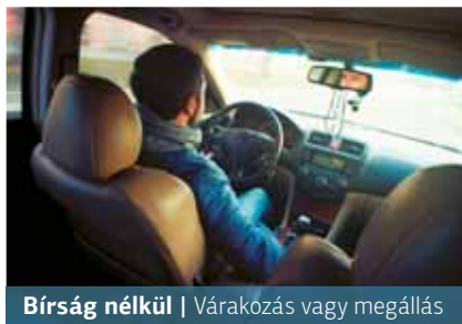
Bírság nélkül | Várakozás vagy megállás

A szabály szerint, ha valaki fizetős helyen áll, 5 percig számít az autó megálló járműnek, utána már várakozónak, fizetési kötelezettséggel. Azonban – hívja fel a figyelmet a Kreszprofesszor – ha az 5 perc letelte után a kocsival előremegyünk fél métert vagy ki- és visszaszállunk, újra kezdődik az 5 perc. A valóságban senki sem foglalkozik azzal, hogy ha ott van az