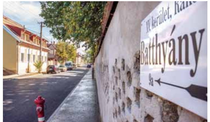
Szorgoskodik a Répszolig | A munkálatok nettó 80 millió forintba kerülnek

A Fővárosi Csatornázási Művek nyár végére befejezte a gerinc-csatorna cseréjét a rákospalotai Batthyány utcában. A munka azonban ezzel nem ért véget, jelenleg az út felújításán szorgoskodik a Répszolig.