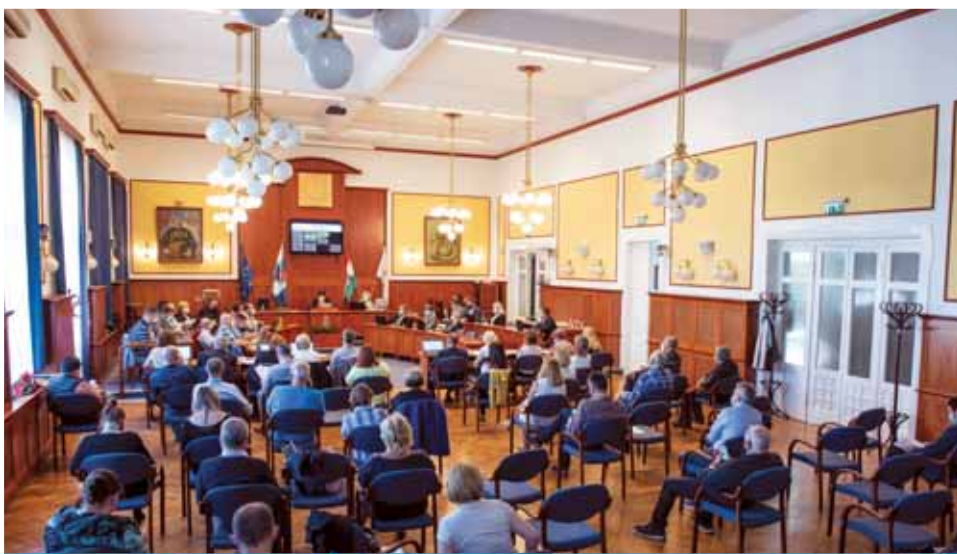
Az ülésen kötelező a maszk és a távolságtartás | Épülhet Lelki Egészség Központ