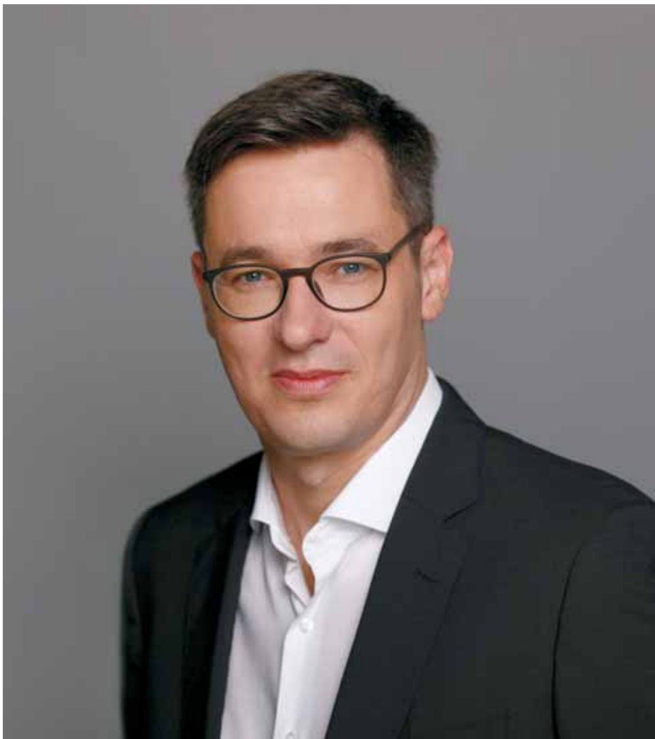
Karácsony Gergely | Fontosnak tartom a Szilas-patak partján a kerékpáros-infrastruktúrát

– Ez egy hosszú folyamat, ami évekig tart, míg megvalósul, azonban soha nem leszünk közelebb a célokhoz, ha nem teszünk érte valamit. A főváros új vezetése lecserélte a korábbi autóközpontú