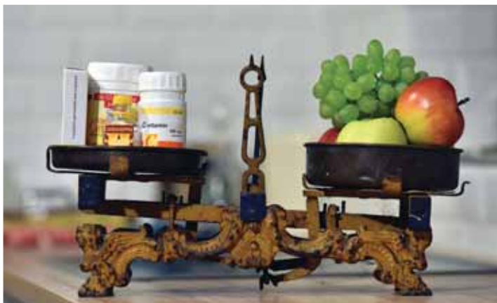
Az ellenálló képesség javítható | Fogyasszunk több friss gyümölcsöt!

Az immunrendszer megfelelő működésének fenntartása fontos a meghűléses betegségek megelőzésében, és az esetlegesen már kialakult tüneteknek az enyhítésében, az időtartam lerövidítésében, valamint az állapot súlyosságának mérséklésében. A szervezet természetes ellenálló képessége javítható, ha étrendünk megfelelő mennyiségben tartalmazza az immunrendszer felépítéséhez, aktivitásához szükséges teljes értékű fehérjéket, az ásványi