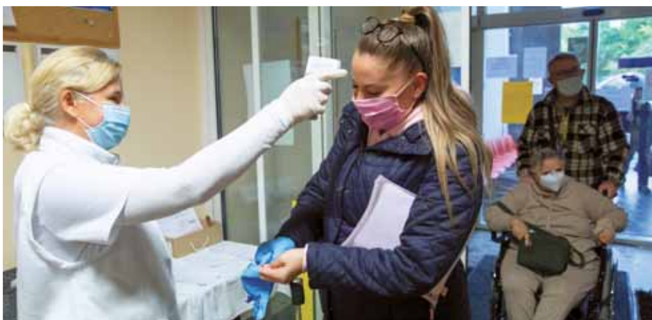
Szigorú óvintézkedések | A rendelő területeire csak maszkban és kesztyűben lehet belépni

rusra utaló tüneteket észlelnek magukon, maradjanak otthon és a háziorvost telefonon értesítsék. Kéri, tartsák be az egészségügyi lépéseket, hogy minél hamarabb legyőzzük ezt a kórt. „Legyenek kitartóak, mert még további nehéz hónapok várnak ránk,