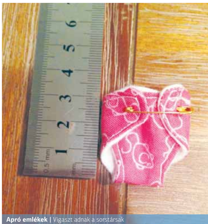
Apró emlékek | Vigaszt adnak a sorstársak

A kórházi gyakorlat intézményenként változó, az viszont egységes, hogy minden esetben lehetőséget kellene biztosítani pszichológussal való konzultációra, ezzel is elősegítve, hogy a család pont a legnehezebb időszakban, a veszteség pillanatában támaszkod-