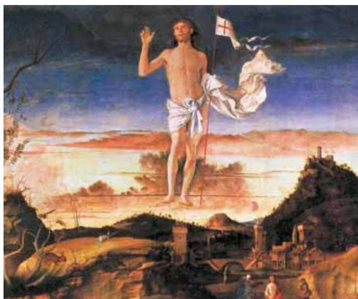
GIOVANNI BELLINI KRISZTUS FELTÁMADÁSA

– A közösségi oldalunkon mindennap többször küldök igei gondolatokat és imádságokat a gyülekezet tagjainak, hogy erősítsem a lelkiüket,