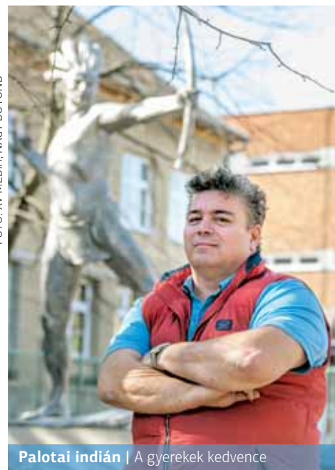
Palotai indián | A gyerekek kedvence

A Mézeskalács tér és a szomszédos Széchenyi-télpel azzal is büszkélkedhet, hogy az ötvenes években több kultikus szobor is helyet kapott itt. A házak között találni pancsoló gyereket, ugró szarvast, nőt