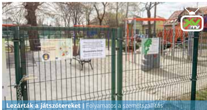
Lezárták a játszótereket | Folyamatos a szemétszállítás

Veszélyhelyzeti üzemmódra állt át a Répszolg. A köztisztaság fenntartása érdekében továbbra is folyamatos a hulladék elszállítása a kerületi közterekről, ezért ha szükséges, akár több embert is munkába állít a társaság.