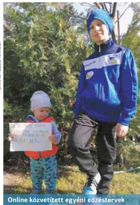
Online közvetített egyéni edzéstervek

– A mostani helyzetben az atlétáknak és a kézilabdázóknak szoktam feladatokat küldeni. A