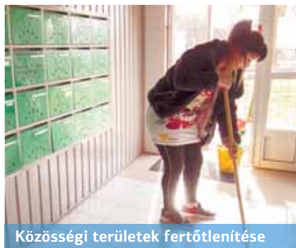
Közösségi területek fertőtlenítése

közösségi tereket, a személedobók bejáratát, a liftajtókat és gombokat, illetve a lépcsőkorlátokat (a tízemeletes épületekben a harmadik, a négyemeletesekben pedig a második szintig).