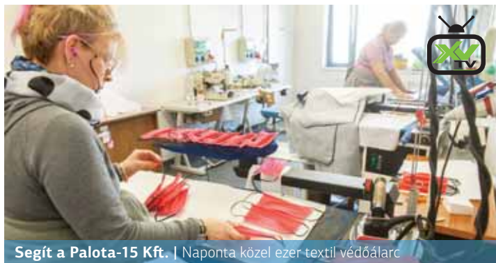
Segít a Palota-15 Kft. | Naponta közel ezer textil védőárlac

A koronavírus-járvány az önkormányzat gazdasági társaságainak működésére is hatással van. A legjobb példa erre, hogy a Palota-15 Rehabilitációs és Közfoglalkoztatási Közhasznú Nonprofit Kft. varrodája teljes kapacitással állt az egészségügyi védőmaszkok gyártására.