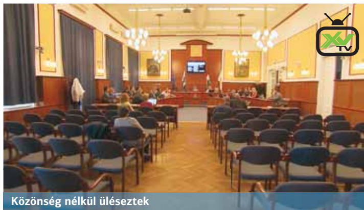
Közönség nélkül üléseztek

Az önkormányzat a jogszabály szerinti mentesül az ügyleti kamatfizetés