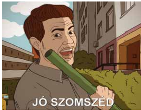
GRAFIKA: VARGA TÍMEA LAURA

Szomszédvitához riasztották a kerületi rendőröket. A két szomszéd úgy összeveszett egymással, hogy az egyikük – a sértett állítása szerint – megrugdosta a másik kapuját, illetve egy műanyag csővel az ablakát is betörte. A férfi ellen garázdaság miatt indult eljárás. ◆