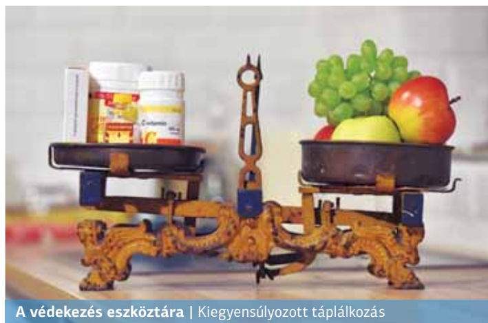
A védekezés eszköztára | Kiegyensúlyozott táplálkozás

– A C-vitamin mellett az A-, az E-, illetve a D-vitamin megfelelő beviteléről kell gondoskodnunk ebben az idő-