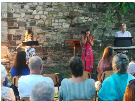
Kövesd a hangot – nyár esti koncert a romtemplomnál

„Arany sugarával elillan már a nyár, odébb áll csendesen, tűnik az illatár, hallgatom búcsúját, tücsökhangon szólal, lassan tovább oson minden múltó nappal. Átadja majd helyét a termékeny ősznek, s az érkező napok új álmokat szőnek.”