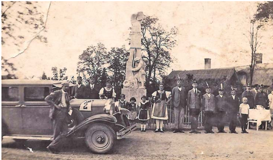
A kónyi emlékmű leleplezése

1924. szeptember 29-én, 95 évvel ezelőtt adták át a Dísztéren mind a mai napig megtalálható, és azóta is nagy becsben tartott első világháborús emlékműünket. Az esemény jelentőségét mutatja, hogy a Dunántúli Hírlap (Keresztény Politikai Napilap) szeptember 30-i számában címlapon számolt be az avatóünnepségről. A hosszú cikk másolata Nagy István helytörténeti kutatónk köszönhetően jutott birtokunkba, és úgy gondoltuk, ezt a fontos kordokumentumot betűhíven újra az olvasók elé bocsátjuk. Kérjük, mindenki úgy olvassa, hogy közben legyen tisztában vele: a cikk 6 évvel az első világháború lezárulta és 4 évvel a trianoni békediktátum után keletkezett, így az idézett beszédrészletek néhol mai fülnk már elég meredek kijelentéseket tartalmaznak. Ezek azonban a korra nagyon jellemzőek, így sem kihagyni, sem megváltoztatni nem szándékoztuk őket. (Cs. G.)