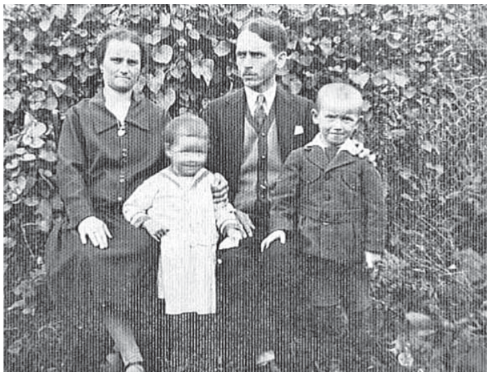
Szüleivel és testvérével, Lacival.

tudta felkarolni a munkát kereső kónyi születésű fiatalokat, akik a későbbiekben is mindig bizalommal kérhették segítségét, tanácsát. Ezt követően hosszú évtizedekre az Észak-Dunántúli Vízügyi Igazgatóság munkatársára lett, ahol az évek és a tapasztalat gyarapodásával a pénzügyi és számviteli osztályvezetői állást töltötte be. E hivatali tevékenysége során részt vett az árvízvédelmi feladatok ellátásában, ami a teljes Észak – Dunántúlra kiterjedt, e feladatok végrehajtása során a pénzügyi, logisztikai háttér biztosítása volt az ő feladata. Munkavégzése idején az árvízvédelmi köte-