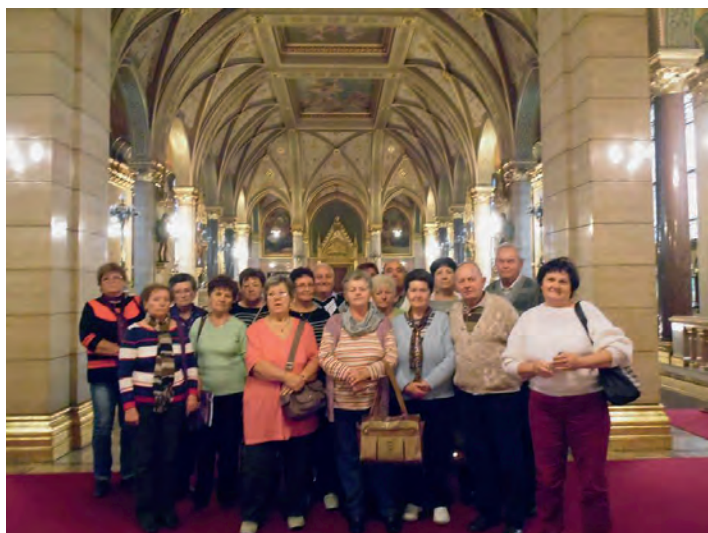
Látogatás a parlamentben.