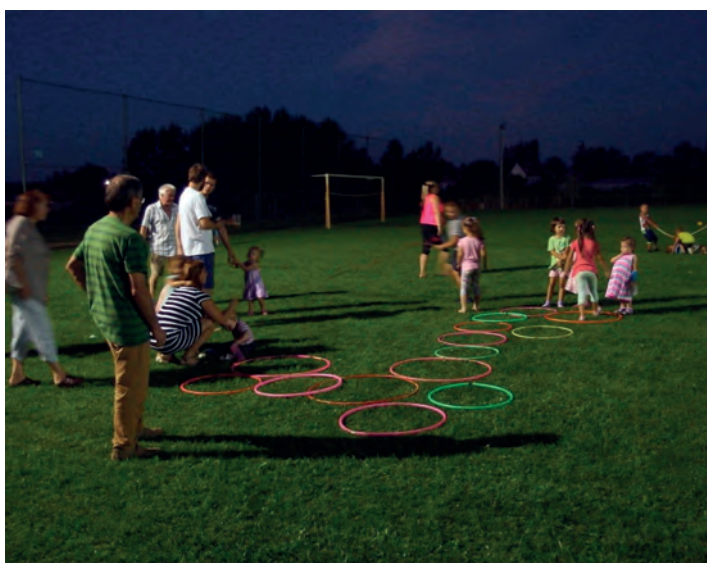
A gyerekek még a reflektor fényénél is kihasználták a nyári vakáció utolsó napjainak egyikét, és késő estig játszottak.