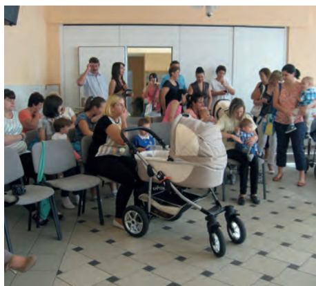
Az Anyatejes Világnapi ünnep résztvevői