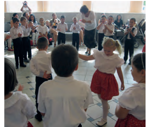
A műsort adó ovisok

Könyben hagyománya van az Anyatejes Világnap alkalmából szervezett ünnepségnek, amelyet az idei évben szeptember 18-án tartottunk. Meghívott vendégeink a településen élő várandósok, a 0-2 év közötti gyermekek és szüleik. Védőnők számára kiemelt feladat a természetes táplálás szorgalmazása. A rendezvény lehetőséget biztosít arra, hogy ünnepélyes keretek között is felhívjuk az édesanyák figyelmét az anyatejes táplálás hasznosságára.