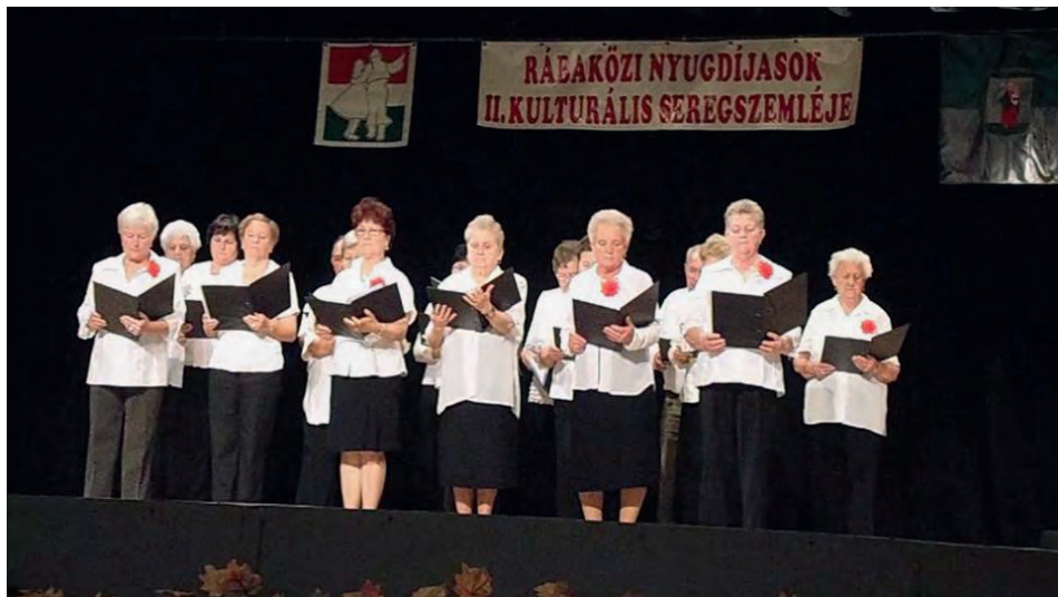
Fellépés a Rábaközi Nyugdíjasok II. Kulturális Seregszemlájén.