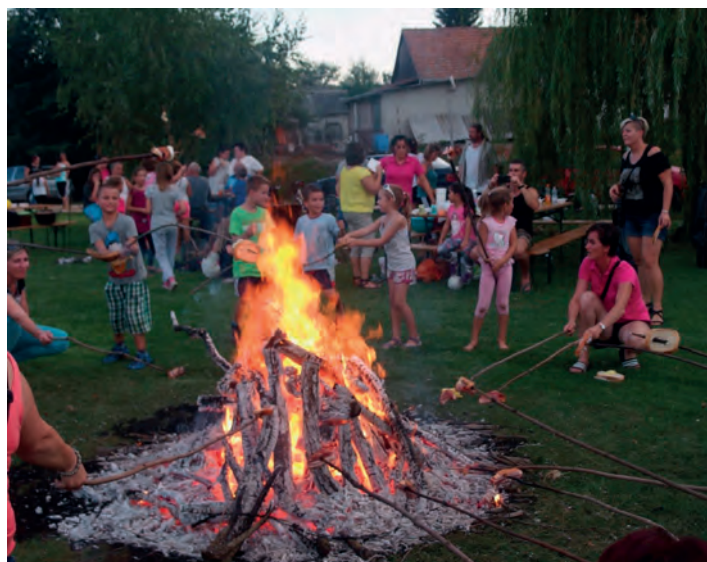
Természetesen nem maradhatott el a hagyományos tábortűzgyújtás, és a szalonnasütés sem.