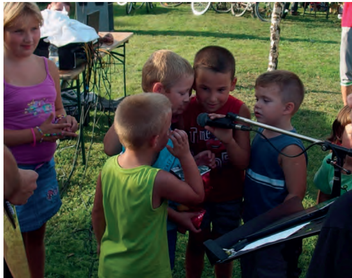
...akik maguk is kipróbálhatták előadói képességeiket.