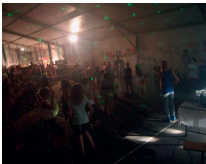
A rendezvényt és a nyarat tinidiszkó zárta. Jövőre találkozunk mindenkivel ugyanitt!