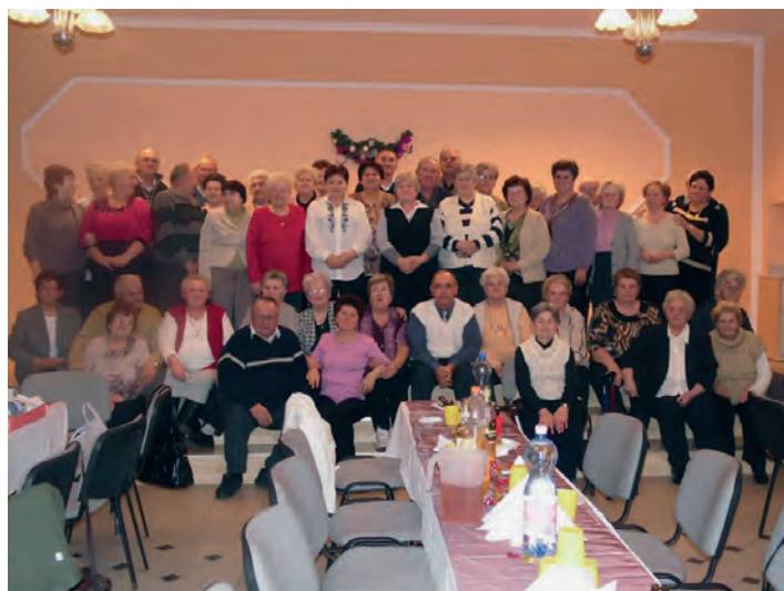
Piros Rózsa Nyugdíjas Klub.