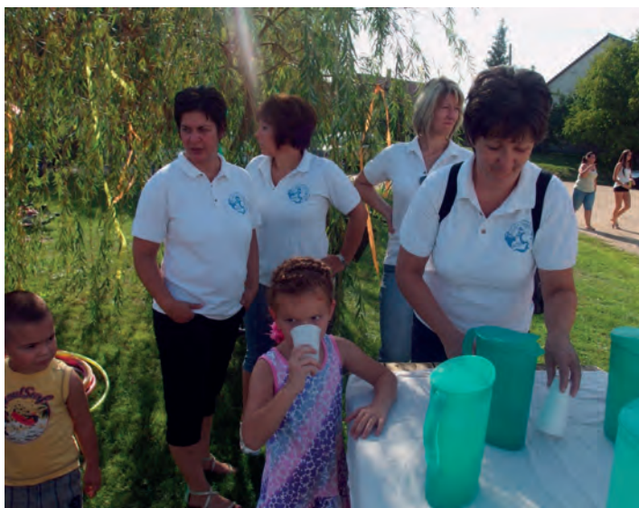
Az óvó nénik és a dadusok frissítővel, hűs limonádéval várták a nagy melegben a sok játéktól megszomjazót.