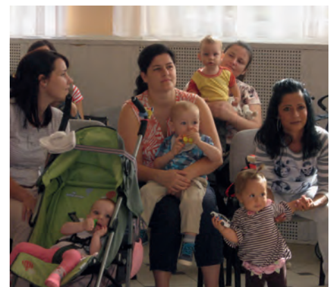
Édesanyák a gyermekeikkel