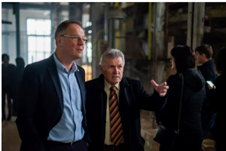
A félig kész projektet a polgármester mutatta be a területfejlesztési miniszternek

■ Ünnepélyes keretek között nyitotta meg kapuit a Krypton-ház április 15-én. A meghívott vendégek csaknem egy évszázadot mehetek vissza az időben. A díszlet, a zene, a hangulat az 1920-as, 1930-as éveket, a Kriptongyár elindításának időszakát hozta vissza. Az 1937-es átadás napját idézte meg a bejárat előtt álló old timer Fiat Bambino is. A jármű előtt sokan fényképezkedtek, voltak, akik be is szálltak, Navracsics Tibor miniszter pedig a sofőr szerepét is vállalta. A viselet kiállításán a Zalaegerszegi Hevesi Tamás Színház zenés darabjaihoz készült, a kort idéző ruhákat láthatták a vendégek.