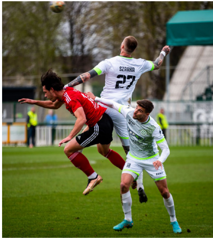
A meccs bővelkedett látványos jelenetekben

■ A Merkantil Bankliga 32. fordulójában az utóbbi időszakban gyengén teljesítő Pécsi MFC látogatott az FC Ajka otthonába vasárnap délután.