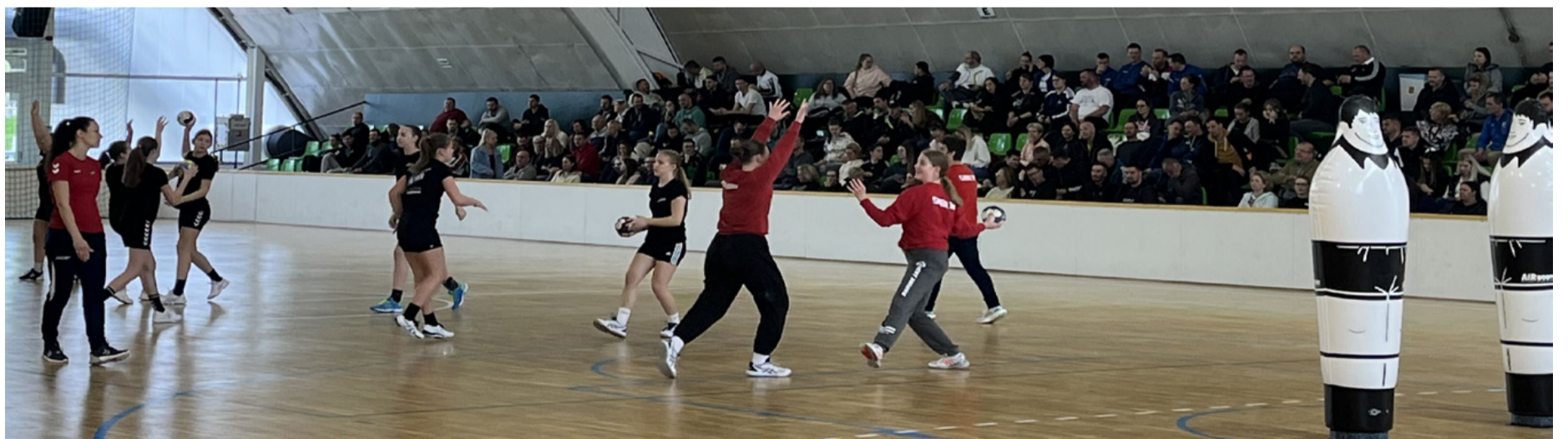
Csapatedzés bemutató a Sportcsarnokban

Reális lehetőségük van a jövőben arra is, hogy akár nemzetközi szintű kézilabda eseményeknek adhatnak otthont Ajkán. NéNo ■