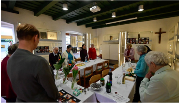
Megemlékeztek az eltávozottakról is