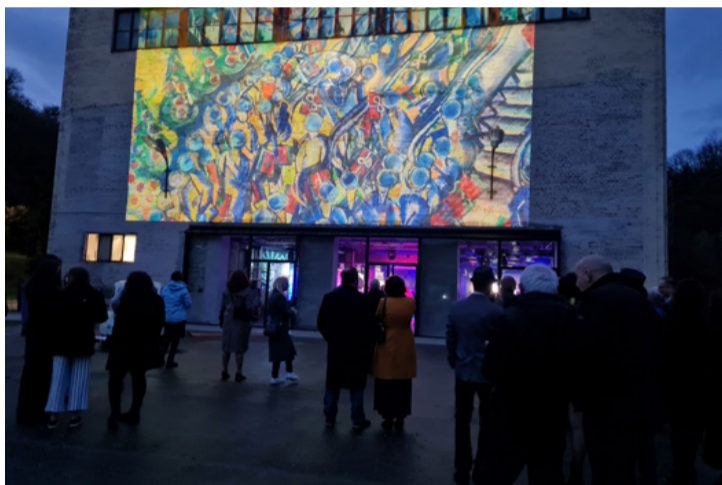
Az épület homlokzatán megjelentetett képzőművészeti alkotásokat sokan megcsodálták

Multikulturális élményközpontként működik