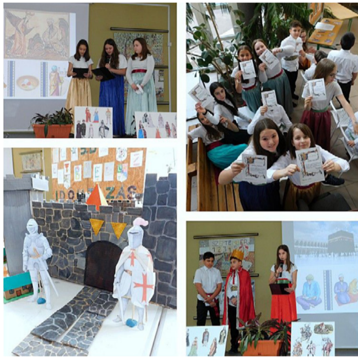
Fotómontázs a projekt prezentációjából

Rengeteg munkaóra és készülés rejtezik a projektbemutató mögött, melyet aztán az osztály nagy sikerrel adott elő. A munkafolyamat zárása után minden tanuló névre szóló oklevelet vehetett át az osztályfőnöktől, bizonyítékul arra, hogy kiérdemelték a „Középkor kis tudora” címet.