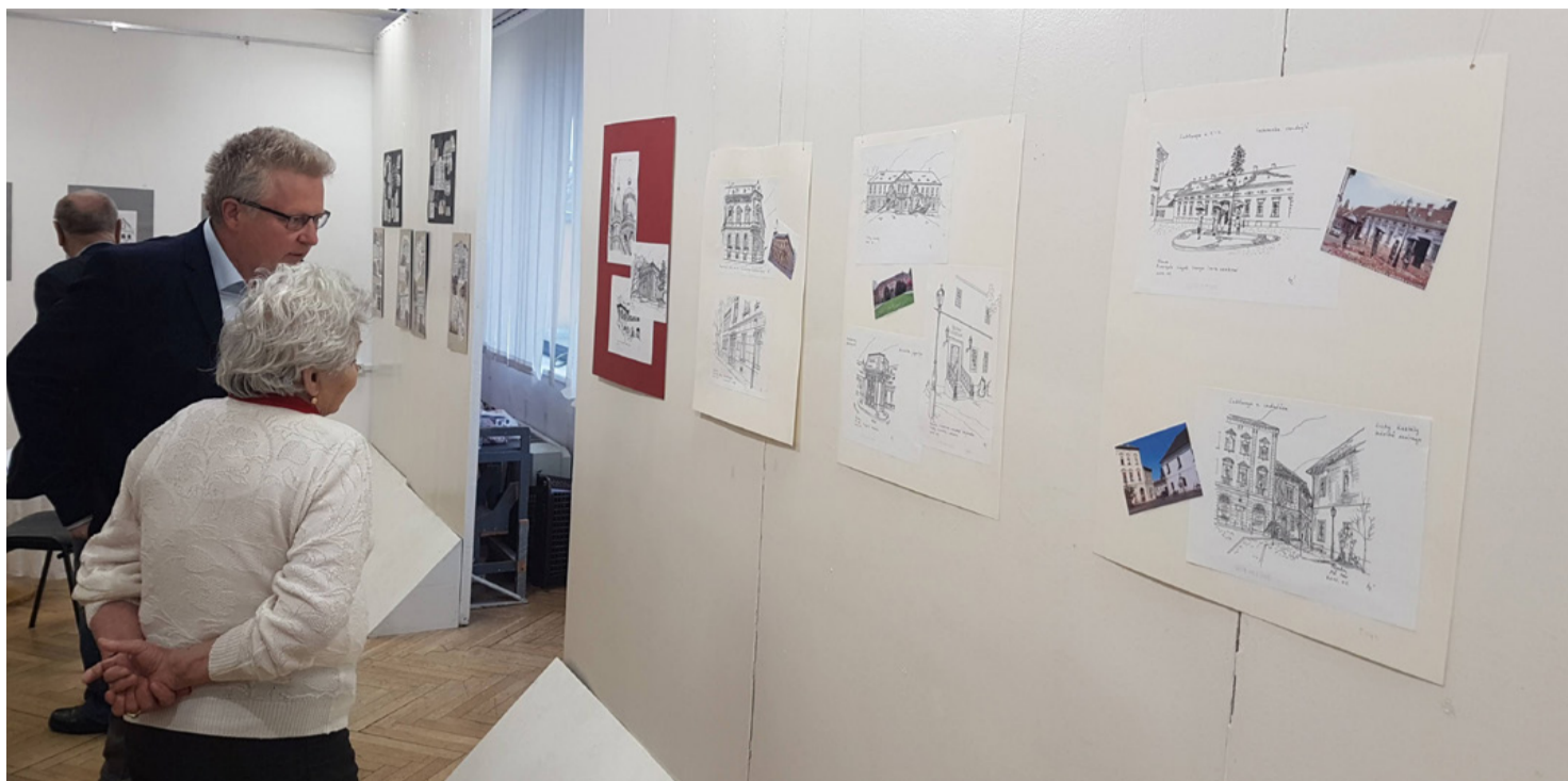
A „tömegvázlat” is lehet művészi kivitelű

Középiskolásként az Ybl Miklós Építőipari Technikumban járt, majd jeles érettségivel sikeresen felvételt nyert a Műszaki Egyetemre, ahol 1970-ben építész diplomát szerzett. Az egyetemi évek alatt már rajzolt és utcaképeket készített a Budai Vár járdáin ülve. Diplomája megszerzése után építészként dolgozott. Tervezett szállodát, egészségügyi létesítményeket, társasházakat, lakóépületeket, lovascentrumot, és termálfürdőt is. Izgalmas kihívásnak tart minden műemlékes átalakítási, helyreállítási feladatot. Mindig vonzották az építészet hagyományos értékei, így amikor a Fővárosi Ingatlankezelő Műszaki Vállalat műemlékvédelmi osztályán dolgozott sok, a XVIII-XIX. században emelt épület állapotát dokumentálta. Ekkor tussal, szabadkézzel