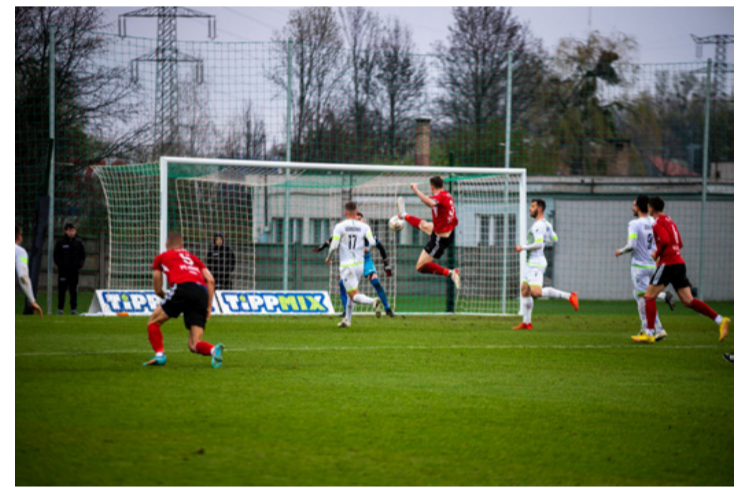
Ebből sem lett gól