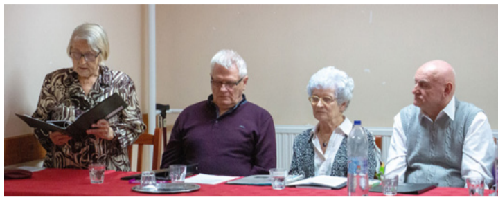
A szépírók saját verseiket adták elő

versbe gondolatait a befo-gadásról. A Hársfa Trió irodalmi zenés műsrot Papp Ferenc állította össze a Petőfi év alkalmából. Néhány vershez maga írta a zenei alapot. Az előadott Petőfi verseket szinte mindenki ismerte, így az első ismerős sorok felcsendülése után a közönség is bekapcsolódott az éneklésbe. A Szépírók