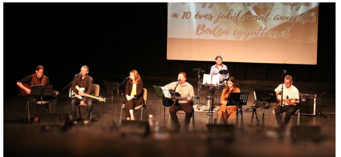
Az együttes a legújabb felállásban a színpadon