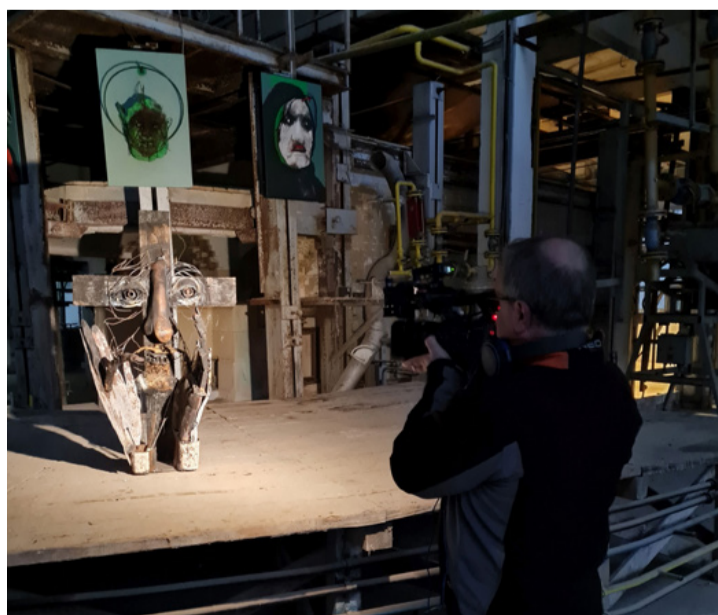
Az egyre sűrűsödő sötétségben a kiállított kisplasztikák új életre keltek