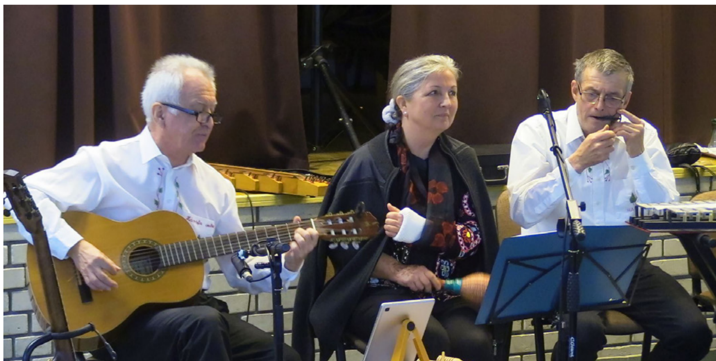
A Hársfa trió hazai pályán, a rendeki művelődési házban