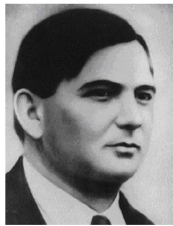
Az ajkai „Superman”

■ A sors furcsa fintora, hogy a Krypton-ház avatására éppen a Holocaust-émlénap előestéjén került sor. Nem is az volt a nap feladata, hogy az egykori Kriptongyár megalkotójáról megemlékezzünk, de talán úgy tisztességes, ha röviden is, de bemutassuk pályafutását az utókornak, a mai ajkaiaknak.