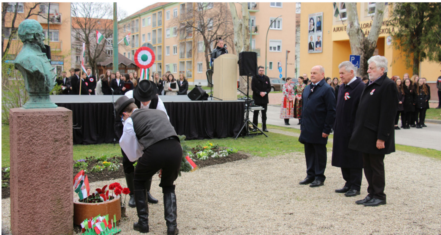
A város választott vezetői is elhelyezték a Kossuth-szobor talpzatánál koszorújukat