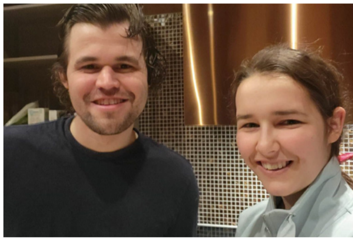
Magnus Carlsen és Gaál Zsóka