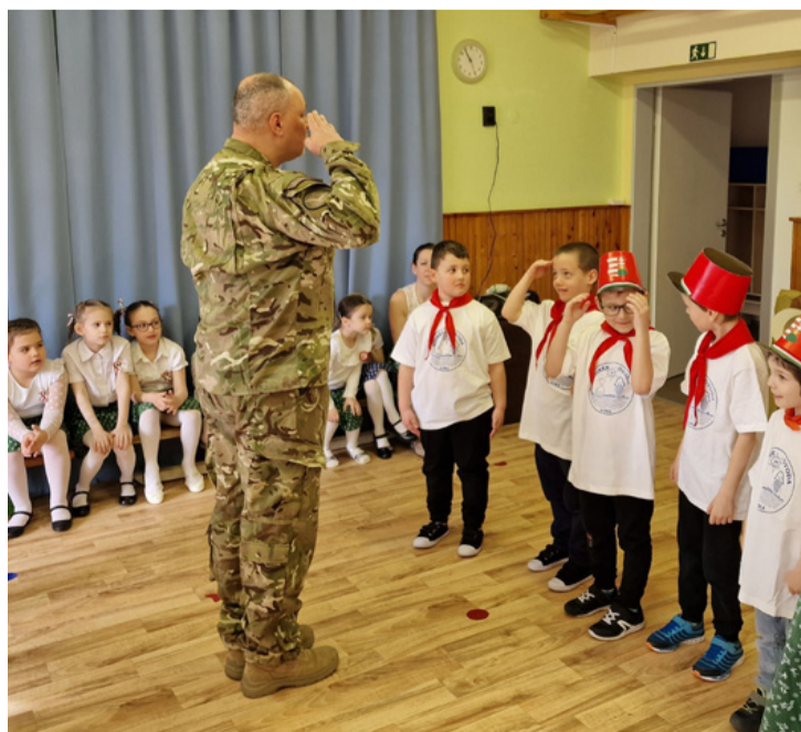
A fiúkat egy „igazi” katona avatta huszárrá

■ Az 1848-as forradalom és szabadságharcra a Huszárpróba elnevezésű gyakorlattal emlékeztek meg kedden az Ajka Városi Óvoda, Vízikék intézményegysége óvodásai és pedagógusai. A program délelőtt 10 órakor a toborzással kezdődött.