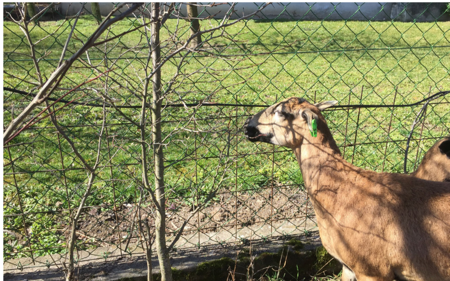
Néha a kecske is „besegíthet”, de vegyük figyelembe, hogy ő nem igazi szakértő, mert mindent megeszik, ami az újtába kerül...