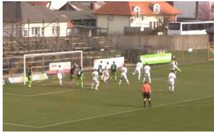
Az első gól előtti pillanat