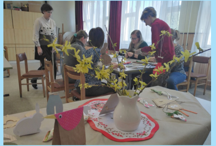
Az óvodapedagógusok sok új dolgot tanultak a művelődési ház munkatársaitól