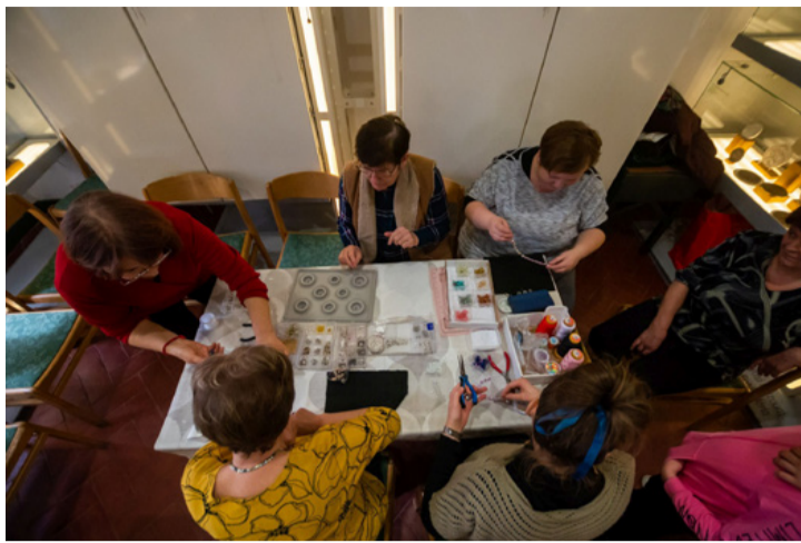
Az alkotó kör