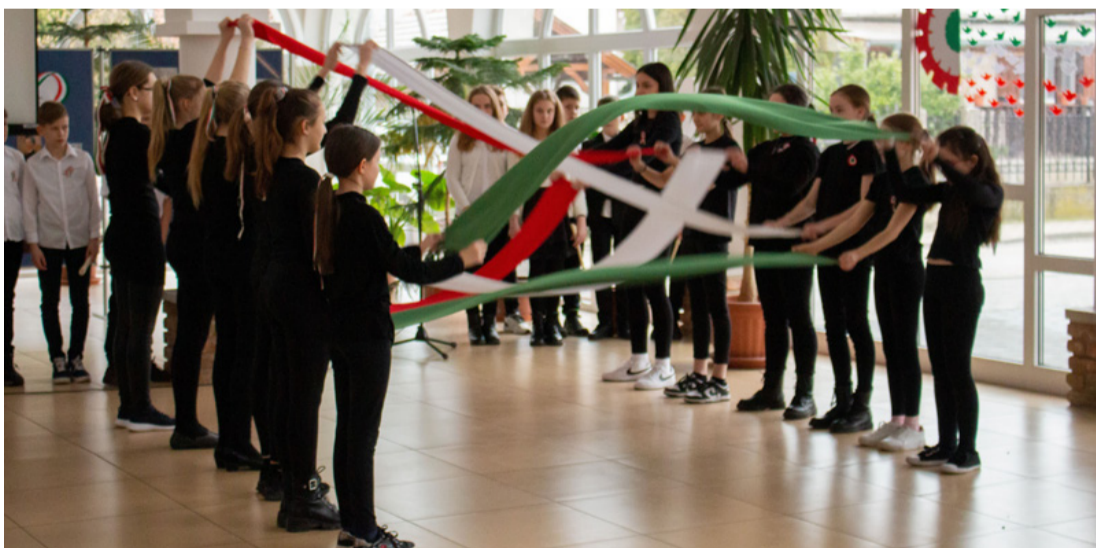
Szalagos tánc az iskola aulájában