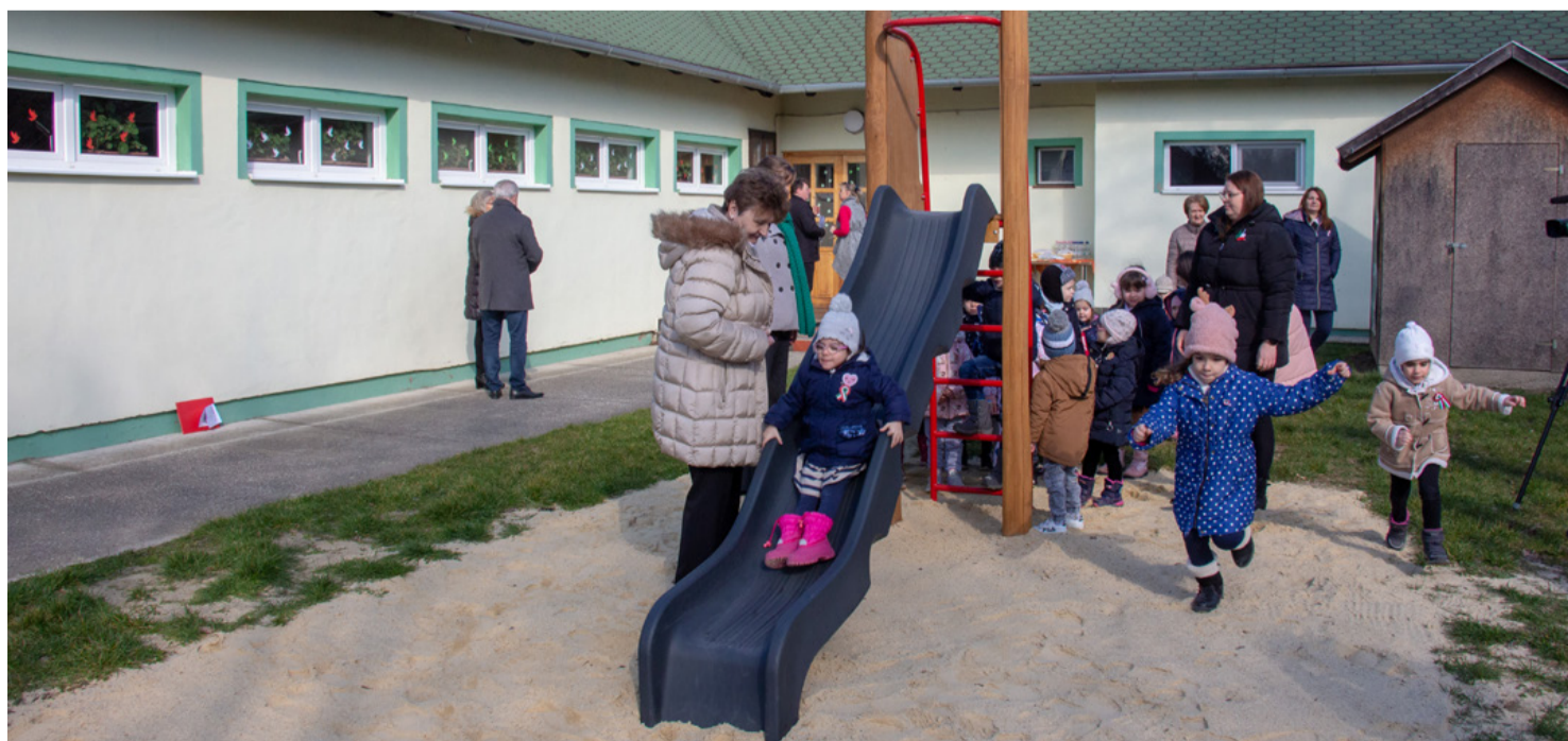
A kicsinyek azonnal használatba vették a játszóeszközt