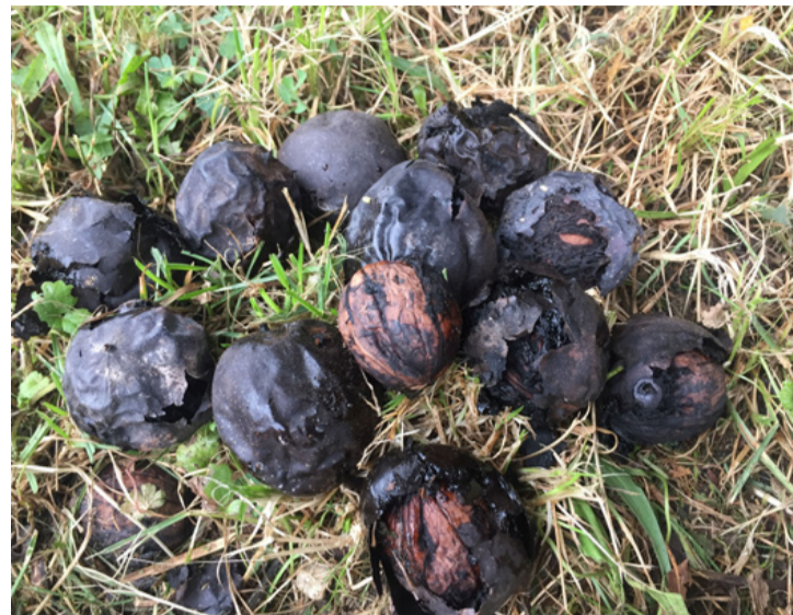
A dióburok-fúrólégy kártétele. Törhetjük a fejünket