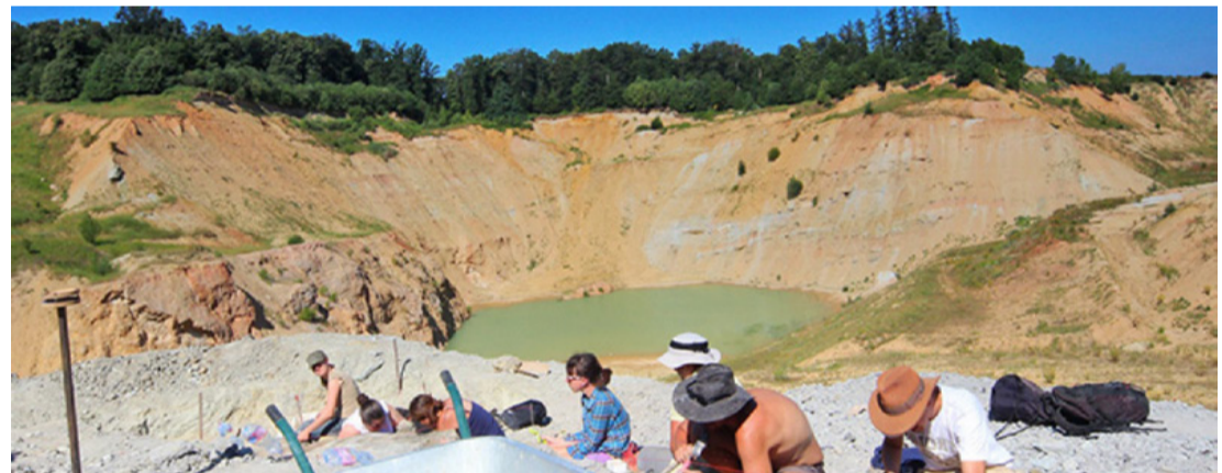
Dínókutatók a Bakonyban

Nyilván rendkívül összetett tervről van szó, de már napvilágot látott az a lehetséges