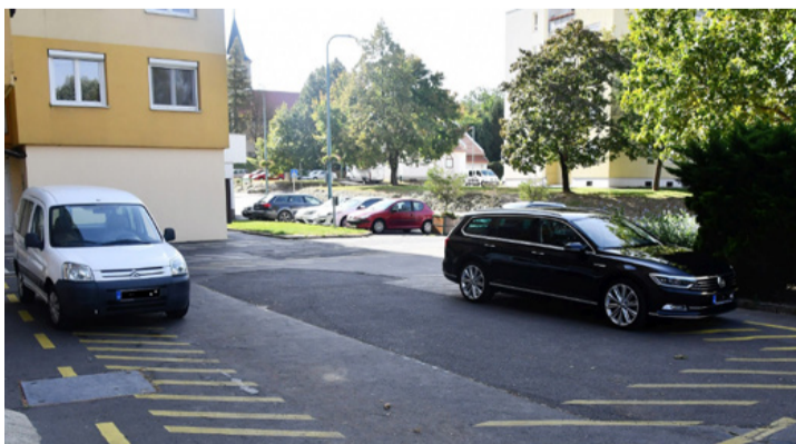
Ajkán könnyű szabálytalanul parkoló autókat találni. A szemléletváltáshoz kevés lesz az új rendelet, a lakosságnak is együtt kell működni

Ajka város Önkormányzatának Képviselő-testülete 2020. szeptember 17-én megtartott ülésén döntött arról, hogy az Aj-