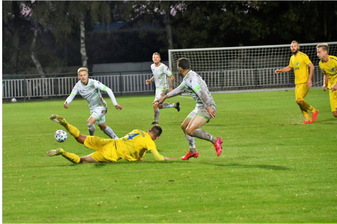
Ezúttal a Gyirmót került a padlóra