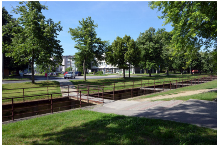
A Torna-patak rekonstrukciót is „jégen kell”