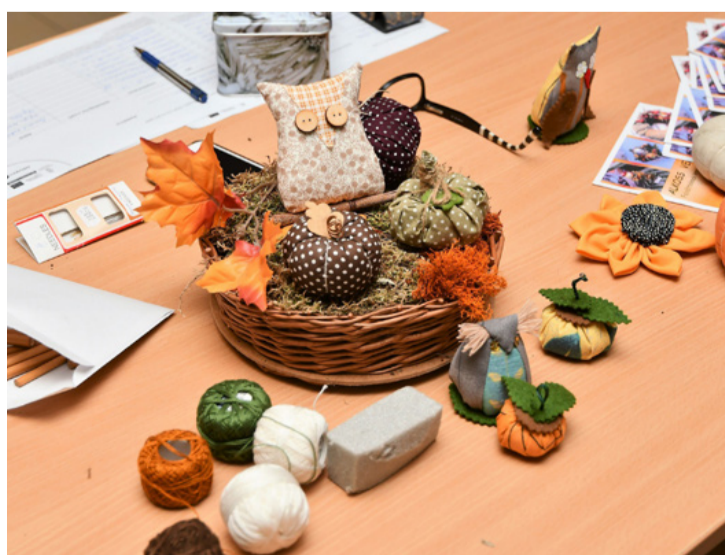
Őszi csendélet a kreatív asztalán. Megidéztek a hangulatot

aztán ezeket őszi levelek közé ültessék. Az anyagok színvilágát az őszi színesedő levelekhez igazították, hogy egységes legyen a kész alkotás. Aki megtanulta csürni-csavarni a tűt a tök készítéséhez, az vállalkozhatott a baglyok varrására is. Itt már nagyon pontosan kellett szabni, hogy kitömés után szép formája legyen az állatfigurának. Ahhoz, hogy ezek a kosárrák a lakás díszei lehessenek sokat kellett öltögetni ezen a délutánon, de a kézi varrásnak is megvan a maga varázsa. Minden darab egyedi lett, magán viselte készítője egyéniségét. (VHA) ■