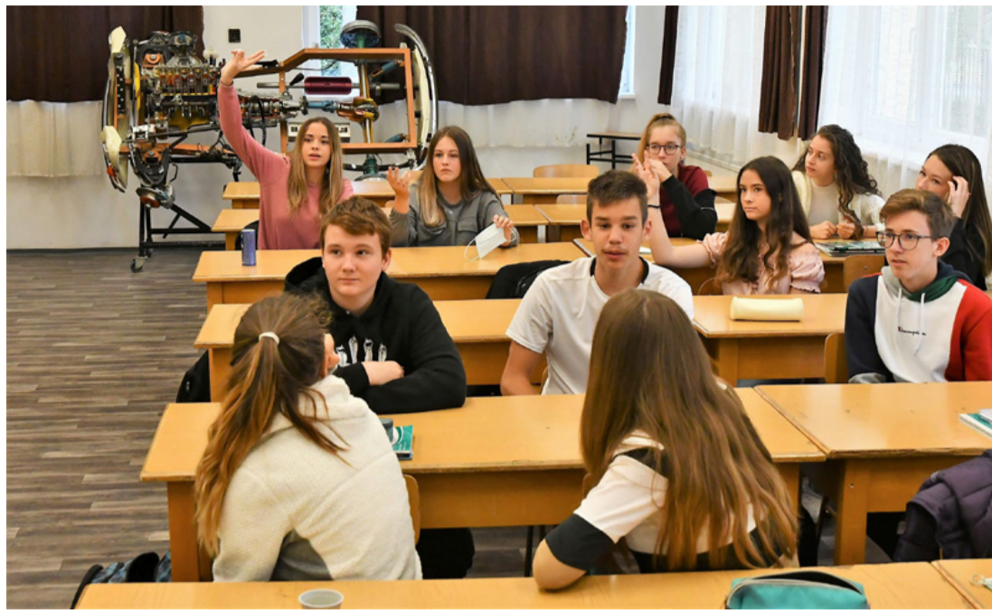
Életpé a Bánkiban. Fontos, hogy jól érezzék magukat