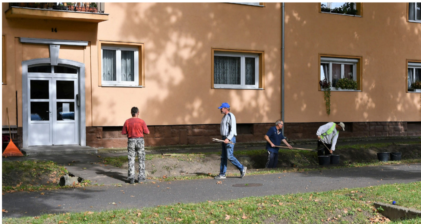
Ők tartják tisztán az utcát. Segítségre várnak

A közfoglalkoztatott nem lusta, nem lógós, hanem dolgozni szeretne, de az elsődleges munkaerőpiac nem lát bennük potenciális munkaadót. Ennek sokféle oka lehet, például az életkoruk. A nyugdíjhoz közeli korban nagyon nehéz a munkaerőpiacra visszatérés. Már egészségi állapota is akadályozhatja a munkába állást, de betegsége még nem jogosítja fel arra, rokkantnyugdíjas járadéka legyen. Gátja lehet a munkaerőpiaci részvételnek a ma piacképtelen szakma épp úgy, mint az alacsony iskolai végzettség. A közfoglalkoztatottak mindössze 30 százaléka rendelkezik középfokú iskolai bizonyítvánnyal. Közöttük mindenféle életkorú ember előfordul, a 19 évesről a 60 évesig. A munkaerőpiacra való visszatérésük ritkán sikerül.