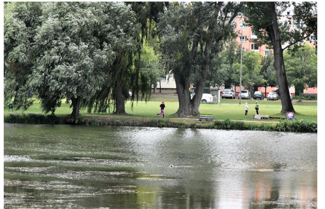
Nem csak futásra, úszásra is alkalmas. Duatlonból triatlon

A Csónakázó tó környékén futópálya kialakítása is sze-