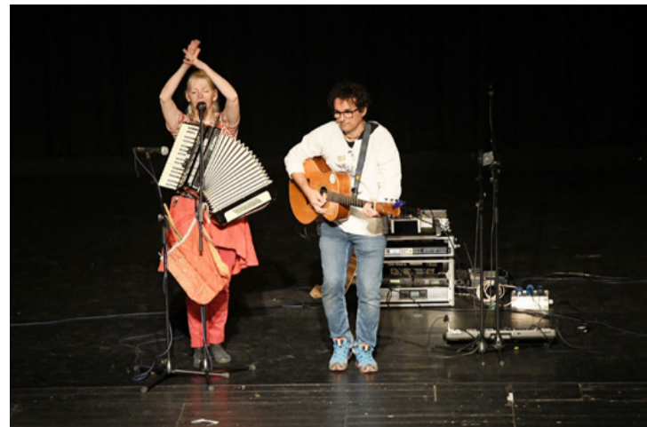
Mesevilágba utaztak a gyerekekkel