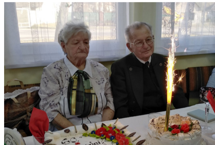
Az együtt töltött 60 év egyetlen percét sem bánták meg