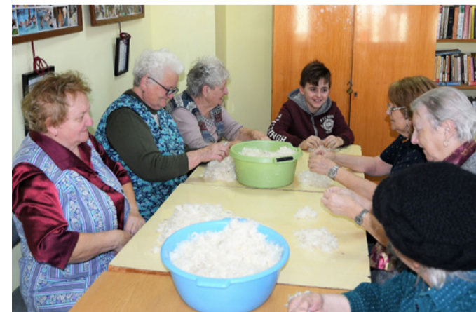
A tollfosztás alapja a jó hangulat