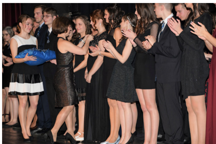
Fiatalok és tetteikészek