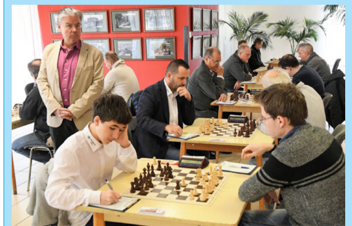
Bal oldalon az NBI/B Bányász SK Ajka csapata, szemben velük (félig háttal) a Sárvári Sakk Clug SE csapata

rivalis, a Zalaegerszegi csapatok. NB II: Bányász - Sárvár 7,5:4,5. Fontos győzelemmel sikerült elkerülni a kiesés helyről. Gy: Pásti, Ludvai, Soós és Halászi. D: Gaál Sándor, Mihályfi, Kaufmann, Lejer, Véber, Somogyi Barbara és Holczbauer. mg ■