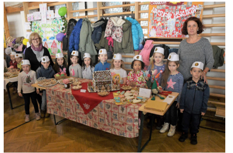
Az ajkai Napsugár kiskukták a műveikkel