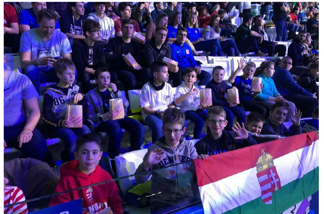
Az első két sorban a „kiscápák” integetnek