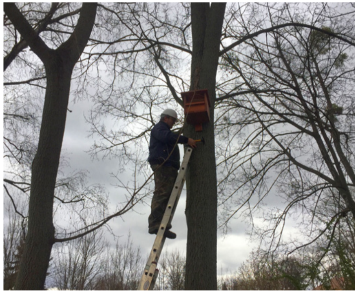
Az odúkihelyezés nem veszélytelen dolog