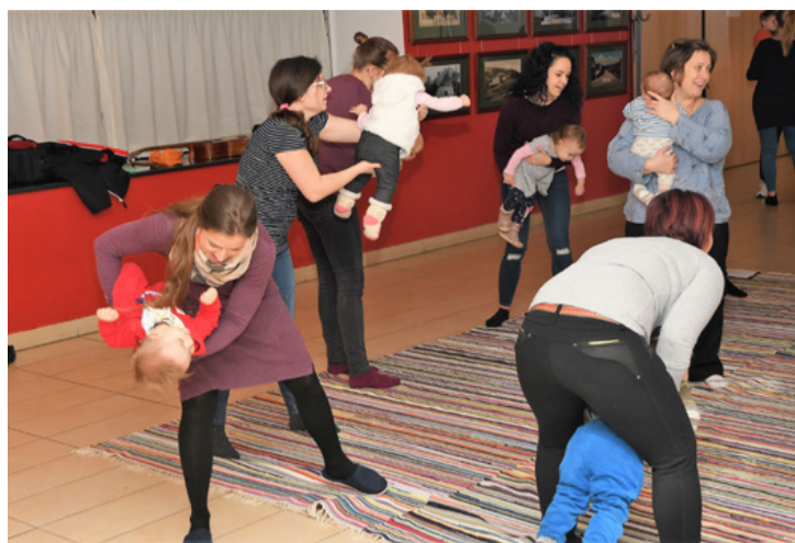
3-5-6, vagy éppen már 15 kiló? Fel sem tűnik!

Szóval baba, mint „sport”. A férfiaknak ez talán hihetetlennek tűnhet, hiszen, nem olyan nagy kunszt egy kisgyerekekkel ellenni, elvégre csak néhány kiló és hát többnyire (kivéve, amikor nem) a lakásban van vele az ember lánya, ahol nincsenek távolságok. Na igen, de mi a helyzet azzal, ha matricánapot tart a lurkó és minden csak úgy jó, ha ki sem bújik anya karjából? Semmi gond, anya egy hős (vagy idióta? – még nem jöttem rá, hogy rám melyik illik inkább), mert