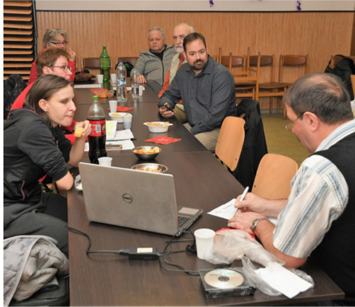
A természetjáróknál is fontos a jó tervezés

éven tömegeket vonz, de népszerű a „Kankalin” és a „Tavaszi hérics” nyílt túra is. Az egyik a Cuha- völgyébe, a másik a Csatár hegyre vezet. Természetesen idén is lesz horgász- és vízi tábor, illetve vízi vándortábor a Tiszán, a Rábán, a Szigetközben és a Dunán. Versenyek is lesznek, a Kamondi Máté Emlékversenyen mérhetik össze tudásukat az ifjú horgászok júni-