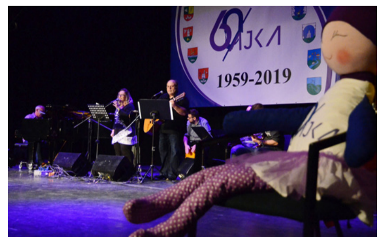
Az Ajka60 baba is „végignézte” a műsort