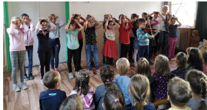
A harmadikosok zenés, énekes műsort adtak a Patakparti óvodában

Vidám énekes, zenés foglalkozást tartott az Ajkai Borsos Miklós Általános Iskola egyik harmadik osztálya a Patakparti óvodásoknak az őszi szünet előtti utolsó tanítási napon. A kisiskolások hangszereket is vittek, hogy kedvet csináljanak a jelenlegi óvodásoknak a majdani zenetanuláshoz. A kicsinyek megmutatták a vendégeknek, hogy ők is már sok mindent tudnak. Felismerték a hangszereket, amelyeket a nagyok megszólaltattak, a találos kérdésekben is megfejtették az „elrejtett” állapot nevét. Én elmentem a vásárra félépézzel... - kezdték a dalt az iskolások, az