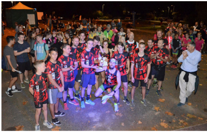
A jó hangulat fokozza a teljesítményt