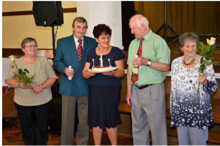
A születés- és névnaposokat is köszöntötték