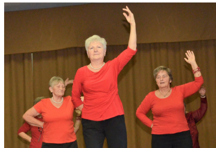
Nagy sikere volt a nemrég alakult senior táncsoportnak