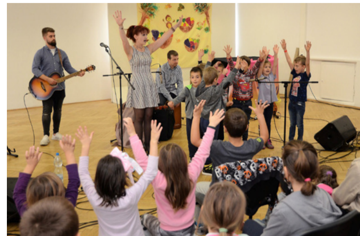
Az igazán aktív napot az interaktív koncert koronázta meg

A program a Palinta Társulat interaktív gyermekkoncertjével folytatódott a kiállítóteremben. Ezt akár úgy is értelmezhetjük, hogy gyermekek adtak koncertet, ugyanis a fővárosi zenekar három tagján kívül ők is „rivaldafenybe”