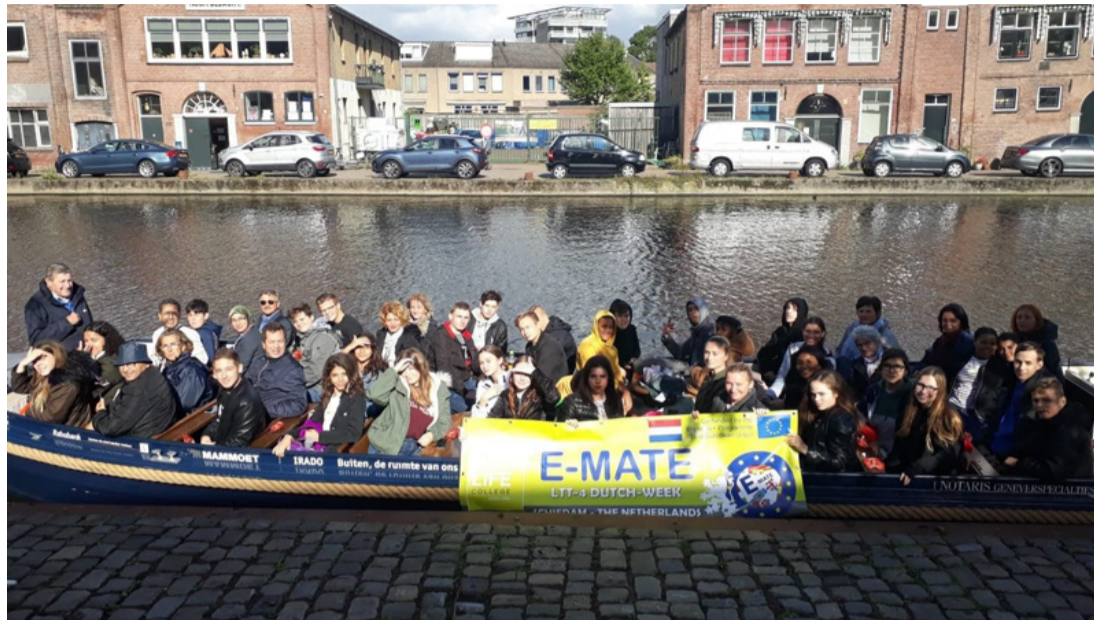
A hollandok jó vendéglátónak bizonyultak

■ 2019. szeptember 30. és október 4. között az Ajkai Gimnázium, Szakgimnázium, Szakközépiskola, Általános Iskola, Sportiskola és Kollégium Bánki Donát Intézményegységéből néhány diáknak és pedagógusnak lehetősége nyílt az Erasmus+ programnak köszönhetően kiutazni Hollandiába.