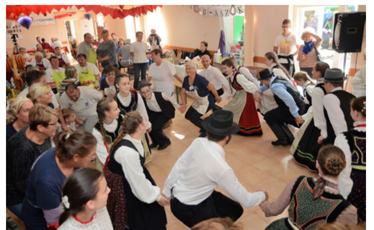
Az Ajka-Padragkút műsorának direkt jót tett a hosszú zsűrizési idő