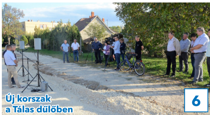
Új korszak a Tálás dűlőben