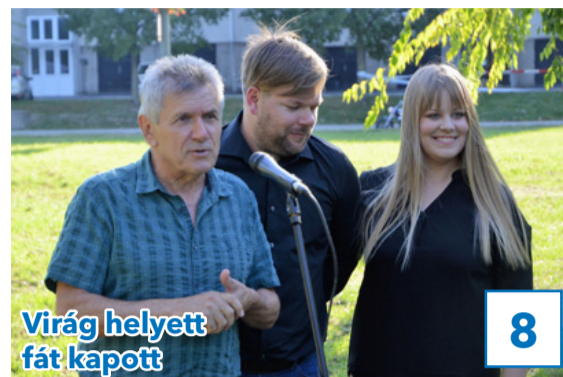
Virág helyett fát kapott