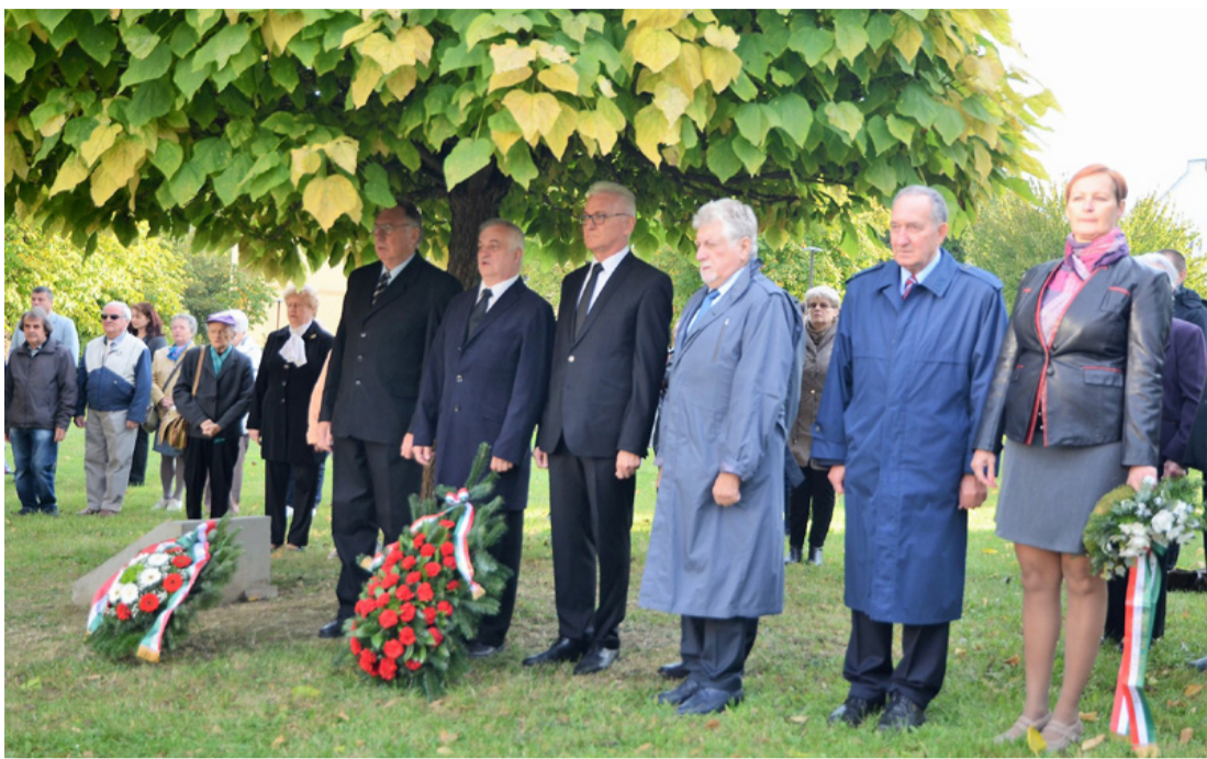
A megemlékezők egy csoportja