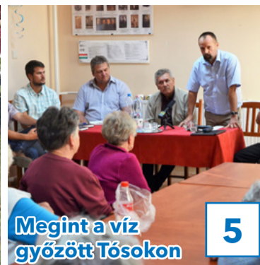
Megint a víz győzött Tószokon