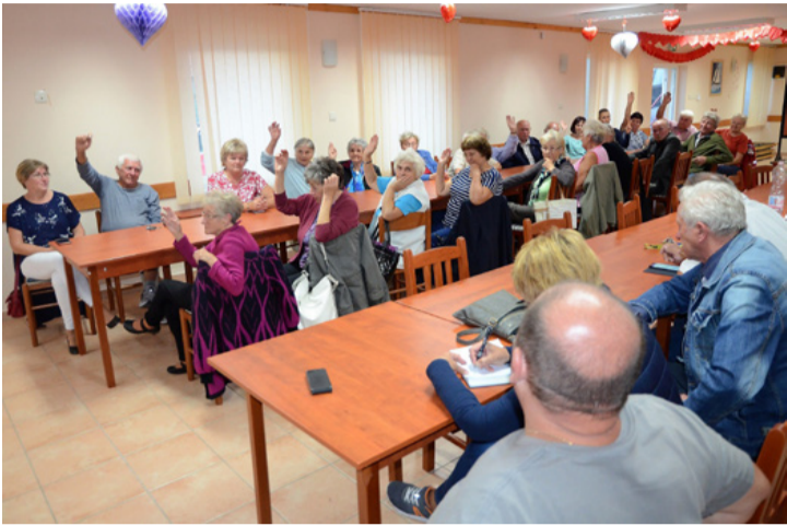
A többség ezúttal is a csapadékvíz elvezetés megoldására szavazott

■ Tósokberénd városrész nem követi a tendenciákat, hiszen a lakónépesség nem fogy, mint országosan, vagy a többi csatolt településrészen. Új lakóingatlanok, telekkialakítások és házvásárlások egyre több fiatal családot csábítanak a városrészbe. Felsőfokú végzettség tekintetében az itt lakók meghaladják a városi átlagot, akik közül többen a település vérkeringésében, irányításában is részt vesznek. Szociális segélyek és lakásfenntartási támogatások igénye igen alacsony. A megújuló iskola sok fiatalot idecsábít. Ugyanakkor az intézményi ellátottság gyenge, és a falut átszelő kerékpárút is hiányzik.