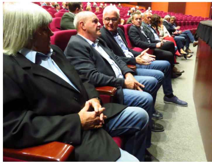
A városért fogtak össze