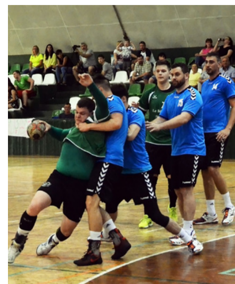
Küzdelmes mérkőzésen kapott ki a Le Bélier II.

bajnokságban. A kizárólag helyi játékosokból álló gárda jövőre még fényesebb medál megszerzésére is képes lehet.