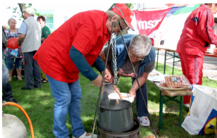
Az egyik kedvenc a bográcsban főtt virsli volt

Kérdés hangzott el a lakossági kedélyeket méltán borzoló, nagy csúszásokat