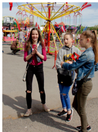
A fiatalok is ünnepeltek

Túl van az országgyűlési képviselő választáson az ország. Az eredménnyel azonban nem mindenki elégedett. Ismét tüntetések zajlanak. Szükség van az összefogásra. Arra törekszünk, hogy mind