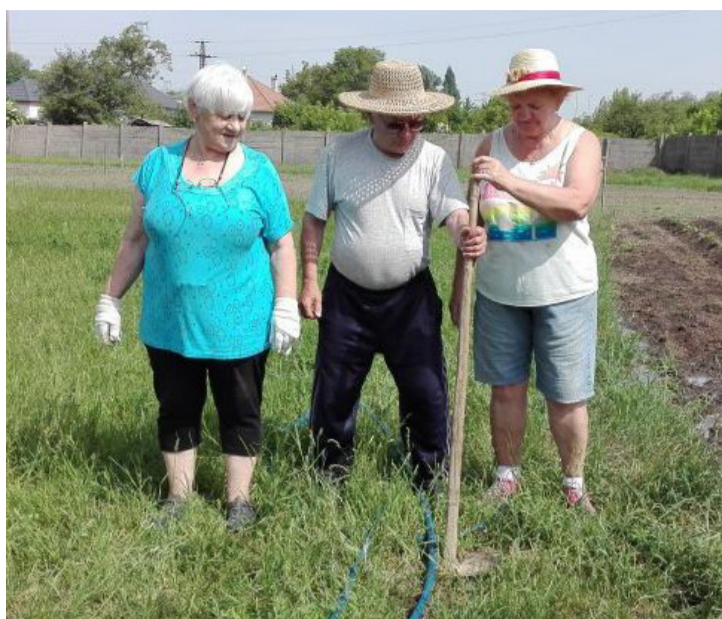
Néha még a kapanyél is elsül, avagy a locsolócső a másik!