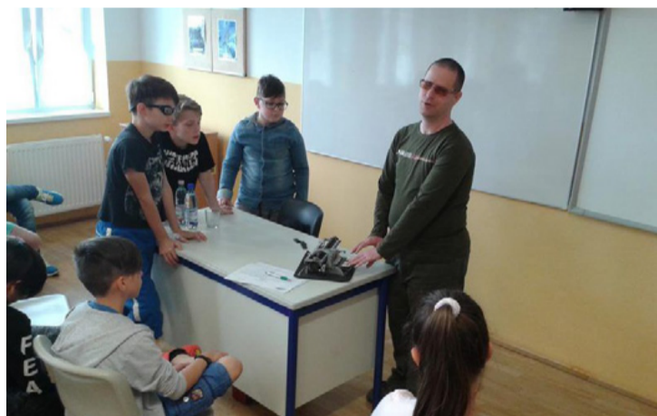
Mindig van még egy esély – a gyengén látók számára is

A tósokberéndi Szent István Király Római Katolikus Általános Iskola osztálytermeiben rendhagyó foglalkozásokat tartottak április végén. A felső tagozatos diákok Esélyegyenlőségi nap keretében ismerhették meg a mozgáskorlátozottak, a hallássérültek, a látássérültek és az autisták életét.