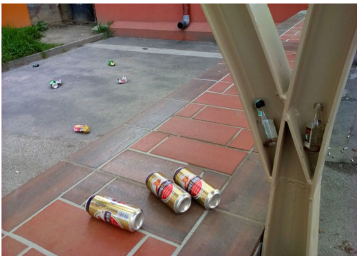
Szerda reggeli „csendélet”