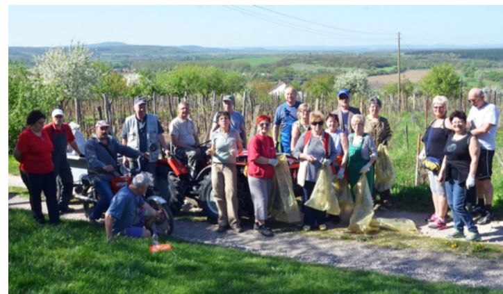
Szinte csodát tett Csékúton a csapat