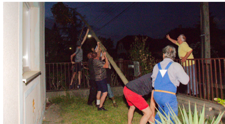
A faállítás kicsit sem veszélytelen pillanatai