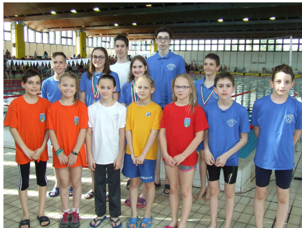
Szombathelyen is helytálltak

A megyei kézilabda bajnokságban a Le Bélier II. a Nemesvárossal játszott utolsó mérkőzését. A találkozó gyakorlatilag döntőnek felelt meg, hiszen a győztes első helyen végzett a pontvadászatban. Ez ezúttal a Nemesvárossal volt, amely nagy tervekkel dédelget, és magasabb osztályban is kipróbálná magát. Minden dicsőret kijár azonban az ajkai fiúknak is, akik második évükben ezüstéremig jutottak a