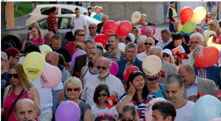
Felvonulók jó hangulatban

mindkettőből egyet-egyét. Az édesanya elmondta, örül, hogy a városban sok az olyan ingyenes és színvonalas rendezvény, ahol a gyerekek is jól szórakoznak. A lehetőségekről az interneten tájékozódik. Ők nem engedhetik meg maguknak a sokszor több ezer forintos belépőjegyek megfizetését, de így az ő gyermekeik sem maradnak ki az élményből.