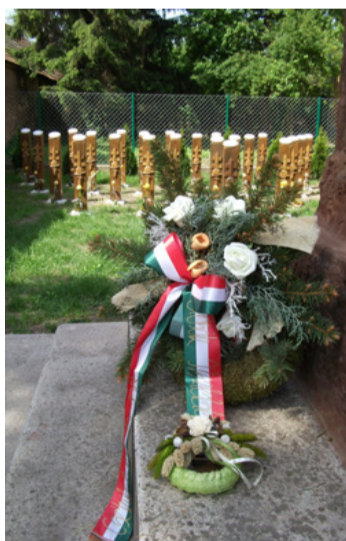
Minikopjafák erdeje az emlékmű mögött