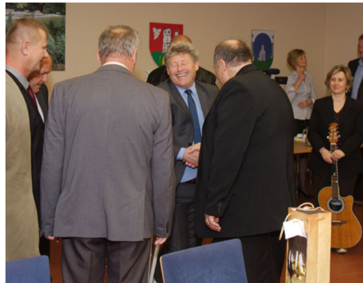
Vidám hangulat az ünnepi ülésen