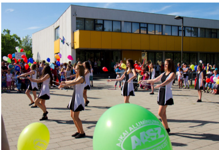
Minden az Agórán kezdődött