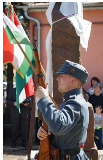
Az egyenruha is a kort idézte