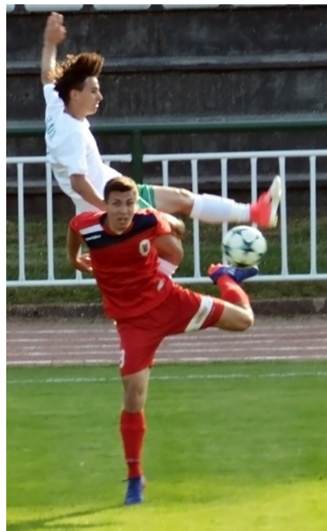
Légibalett a focimeccsen

A kitűnő tavaszi menetelésének köszönhetően az FC Ajka két pontra megközelítette a listavezetőt az NB III-as labdarúgó bajnokságban. A legnagyobb feladat viszont még hátra volt, hiszen Kis Károly tanítványainak Kaposváron, az első helyezett otthonában kellett volna nyerniük, hogy előzhessenek a tabellán. Ez sajnos nem jött össze. Kis Károly csapata a kaposvári vereség után