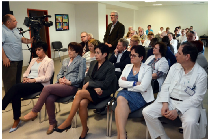
A jelenlévők csak dicsérni tudták a kórházat