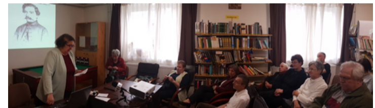
Ez Arany órája volt