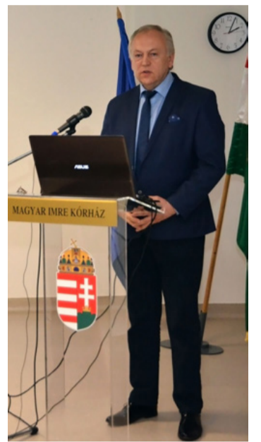
A főigazgató szakmai véleményre hivatkozva állította, a MIK igazi ékszerdoboz