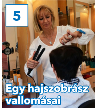
5 Egy hajszobrász vallomásai