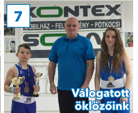
7 Válogatott öklözőink