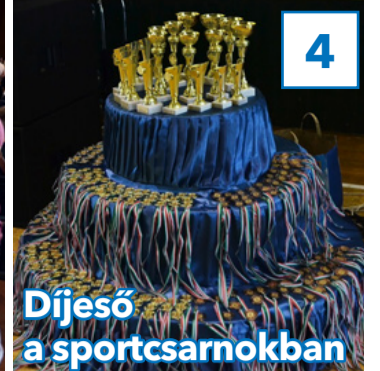
4 Díjeső a sportszarnokban