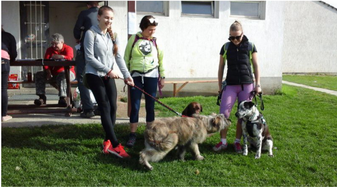
Itt a tavasz!