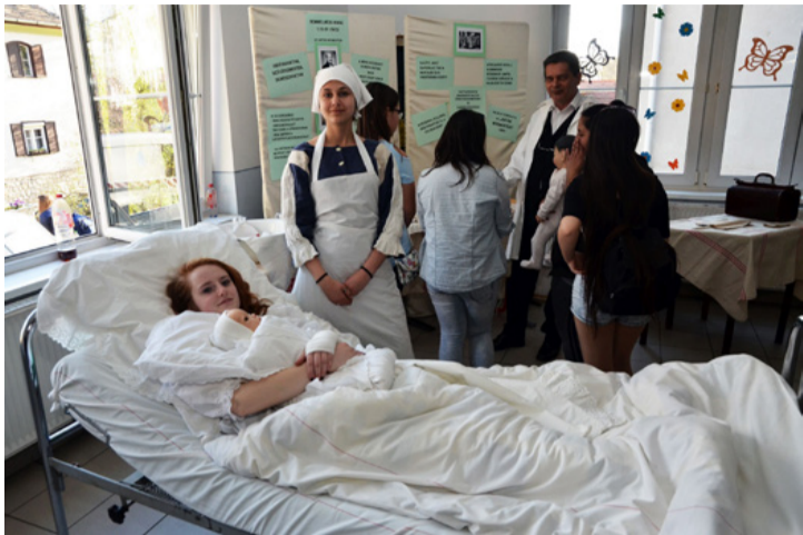
Jól teszi, ha valaki hiányszakmát választ