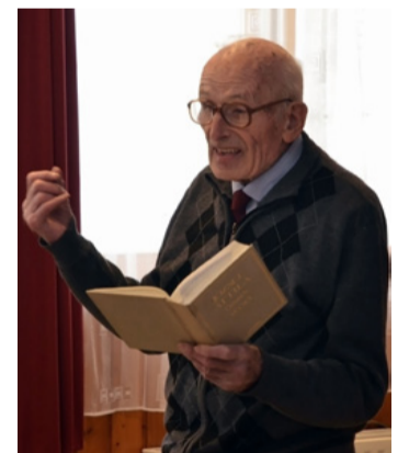
A költőt életén keresztül érthetjük meg

– Ahhoz, hogy érthessük József Attila költészetét, meg kell ismerni hányatott gyermekkorát és fiatalságát. A 32 évet élt