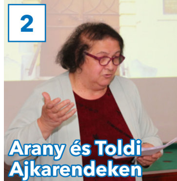
2 Arany és Toldi Ajkarendeken

31. évfolyam, 14. szám, 2018. április 20., péntek