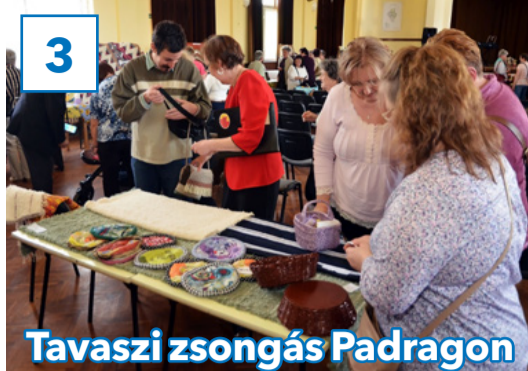
3 Tavaszi zsongás Padragonon