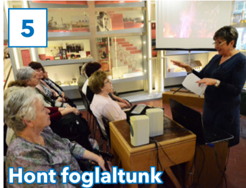
5 Hont foglaltunk