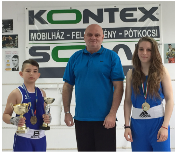
Két szélén a válogatott öklövívők