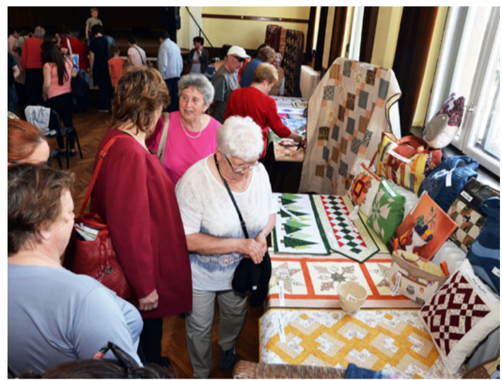
Igazi tavaszi forgató volt

Nem maradt el a hagyományos tombolasorsolás sem, ahol az öltögetők munkái találta gazdára. Ez a délután a tavaszról, a színekről, a harmóniáról szólt, bár talán a kiállítás túl nagyra nőtt.