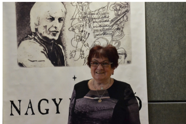
Verseiben köztünk él a költő