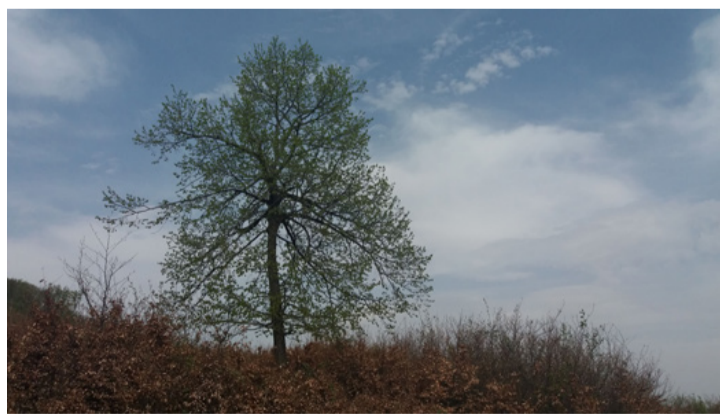
Újjáéled a természet

Nem messze onnan az erdei iskola hívogatja a kirándulókat, a környékén többek között a László-forrás, a Bujólik-barlang, a Sárcsi-kút, valamint a Molnár Gábor kilátó talál-