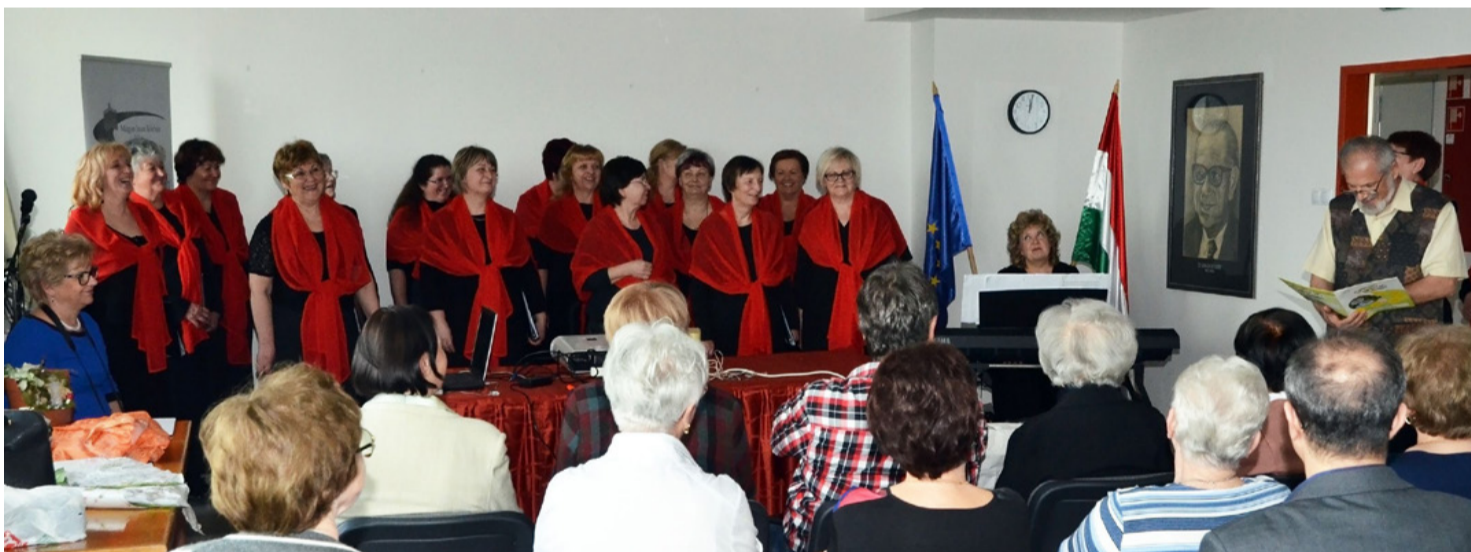
A találkozó meghitt pillanatai