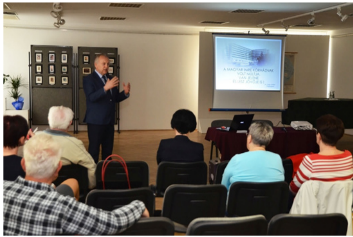
A kórház „karmestere” irányítja a folyamatokat