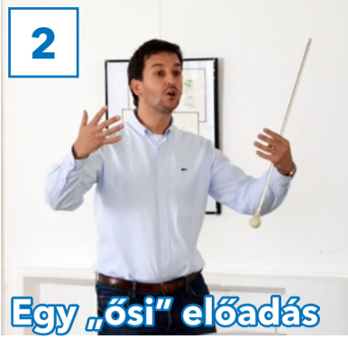
2 Egy „ősi” előadás

31. évfolyam, 13. szám, 2018. április 13., péntek