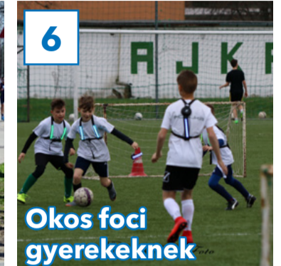
6 Okos foci gyerekeknek