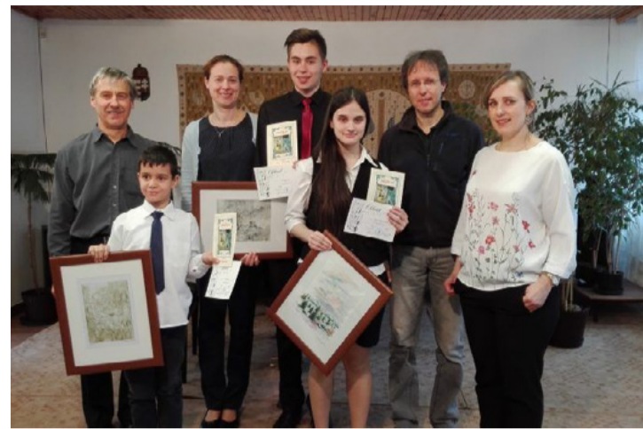
A furulyaverseny győztesei és felkészítő tanáraik