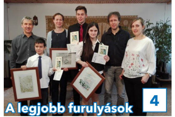
4 A legjobb furulyások