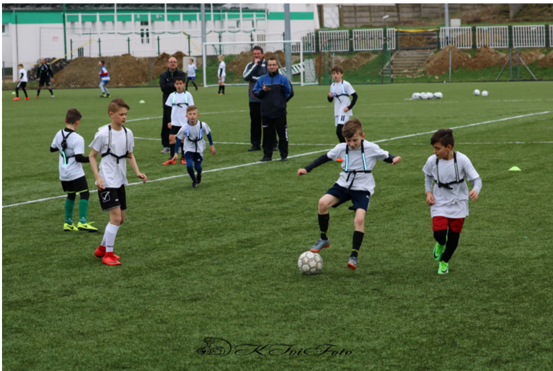
„Okos” mellényekkel izgalmasabb a játék. A mozdulat már „profi”

Az utánpótlás labdarúgást összefogó Bozsik Program keretében minden alközpont, így Ajka is kap Exerlights készletet.