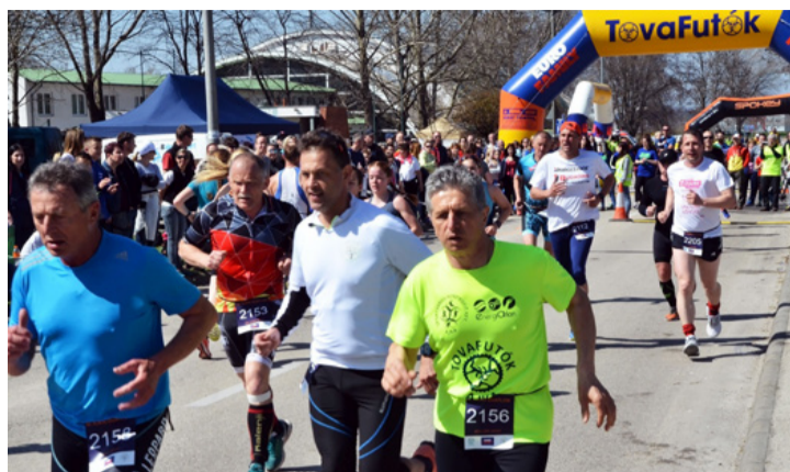
Elszántan, a győzelemre törve