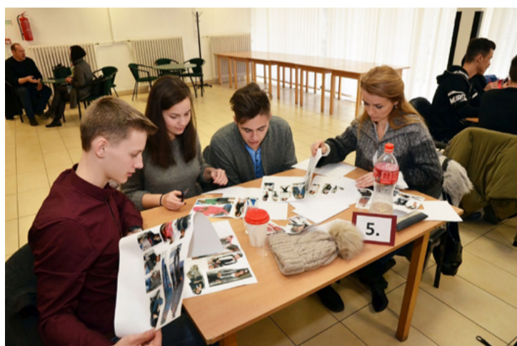
Az első helyezett csapat

Az illemtan-totótól, a tini-felnőtt szótáron át a szituá-