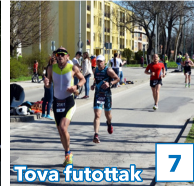
7 Tova futottak