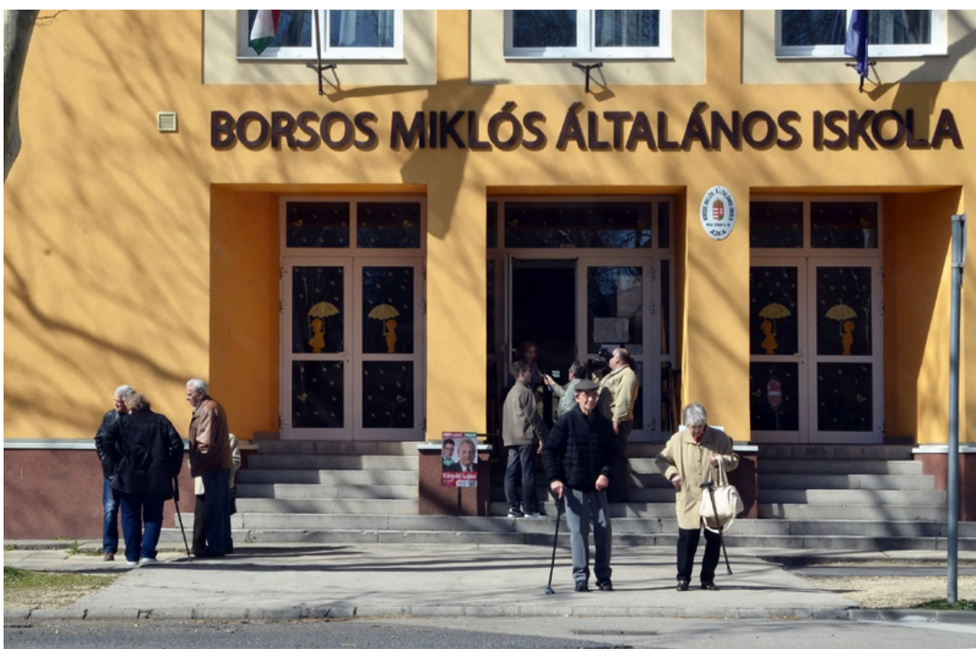
Napfény, virágillat, választás...