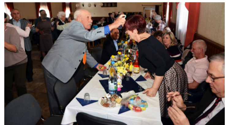
Egy spricc a szépasszonyra!