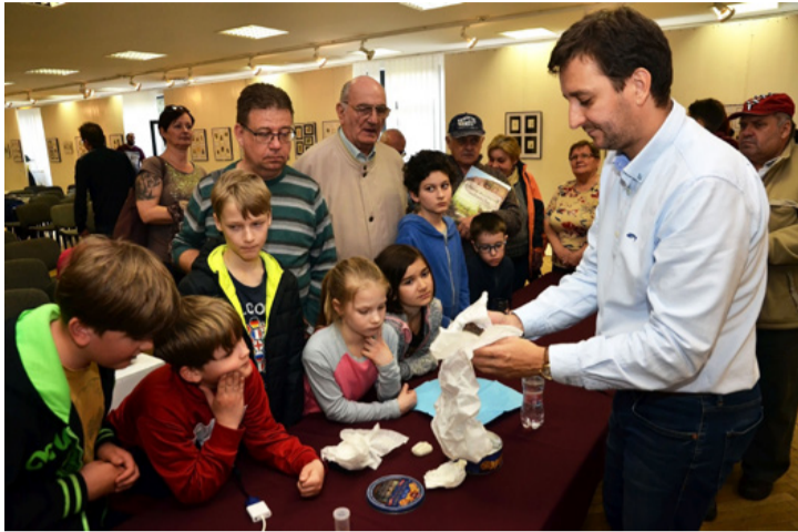
Az őslénykutatáshoz és a gyerekekhez nagy türelem kell