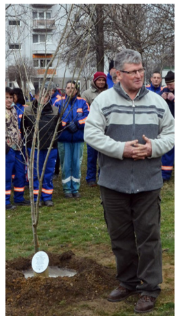
Stílszerűbb ajándék nem is lehetne

Mátyas a könnyeivel küszködve, meghatódottan állt kollégái gyűrűjében és többször elmondta, hogy szavakat sem talál, hiszen ilyen gesztust csak a nála nagyobb emberek kapnak. Sz.R. ■