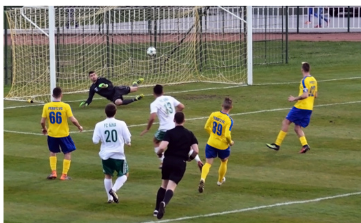
A kapus már verve van (a kép még a Perutz FC elleni győztes meccsen készült)