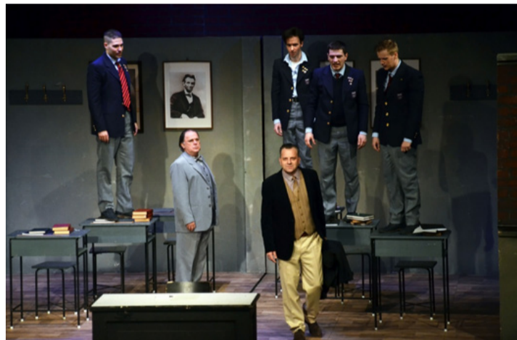
A nyílt lázadás pillanatai

Érdemes lenne elgondolkodni azon, hogy vajon változott-e valamit az eltelt időszakban oktatási rendszerünk. Ma is meg akarják mondani a tankönyvek, hogy mit gondoljanak a diákok többet között a költészetéről? Jó lenne hinni