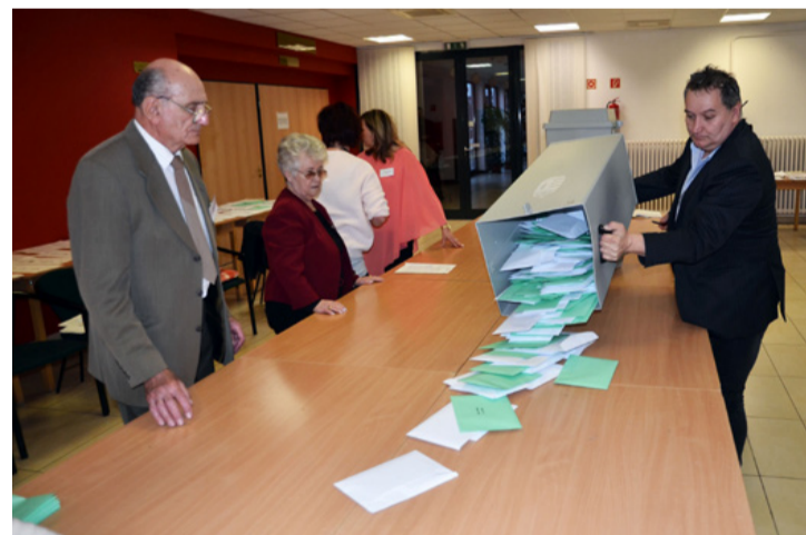
Kezdődik a szavazatszámolás

tudja megfizetni. Hiába tudja, három hónapig tart, vagy addig sem. Amikor megszűnt a munkám, optimista voltam, otthon nyitottam varrodát, majd három hónap múlva rájöttem, nem megy. Nem volt már energiám, hogy naponta ötször elmagyarázzam, hiába ezer forint volt a nadrág, akkor sem tudom száz forintért átalakítani. Nemrég volt osztálytalálkozó, sajnos, lehangolóra sikerült. A 28 fős osztályból ketten dolgoznak a szakmában, a többi valahol szerel valamit vagy közmunkás. Ez is a szellemi értékek elpocsékolása szerintem.