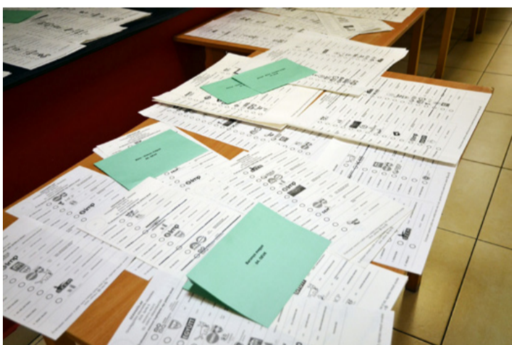
Az átjelentkezők elkészített szavazólapjai