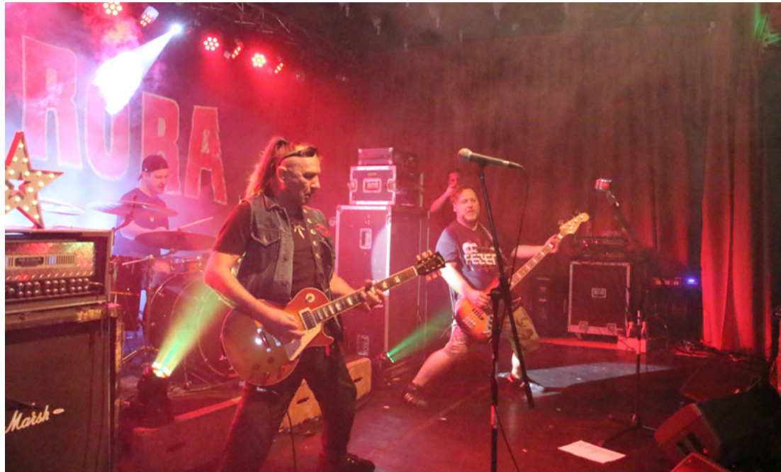
Néha minden vörös fényben úszott