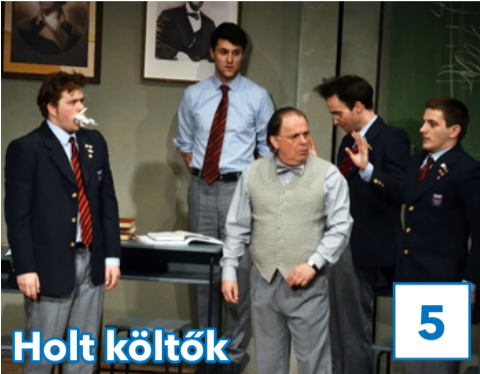
5 Holt költők