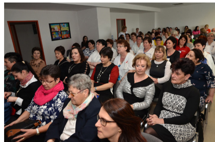
Ők gondozzák a legelesettebbeket