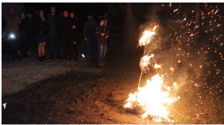
A kiszébbal a tél is (majdnem) elégett