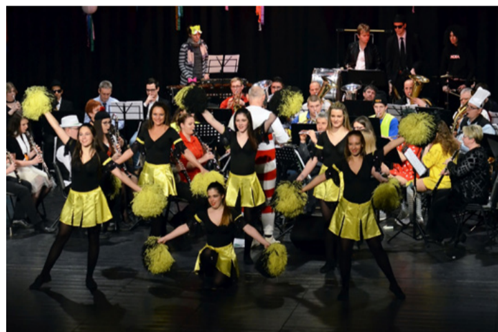
A mazsorett csoportnak is nagy sikere volt

Az Ajka Városi Bányász Fúvószenekar és Mazsorett Csoport Tavaszköszöntő jóteknység koncertjét telt ház előtt tartották a vmk színháztermében február 24-én. A rendezvény teljes bevételét az Ajkai Zeneiskoláért Alapítvány részére ajánlották fel.