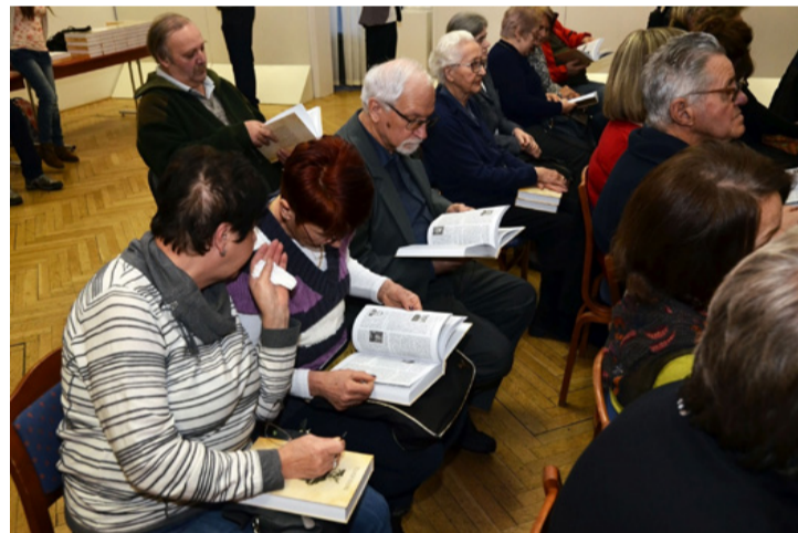
Sokak könyvespolcán ott lesz a kötet