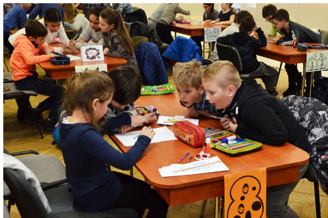
A mesevetélkedő megmozgatta a gyerekek fantáziáját

A versenyzőkre többek között igaz-hamis, totó és keresztretjérvény várt, de gondolatolvasással, közmondásokkal és villámkérdésekkel