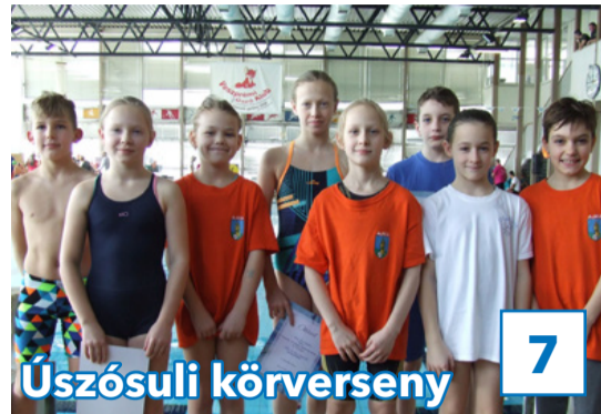
7 Úszósuli körverseny