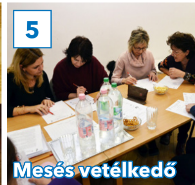
5 Mesés vetélkedő