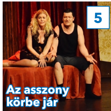
5 Az asszony körbe jár