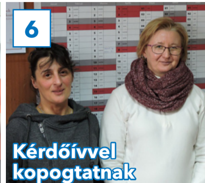
6 Kérdőívet kopogtatnak