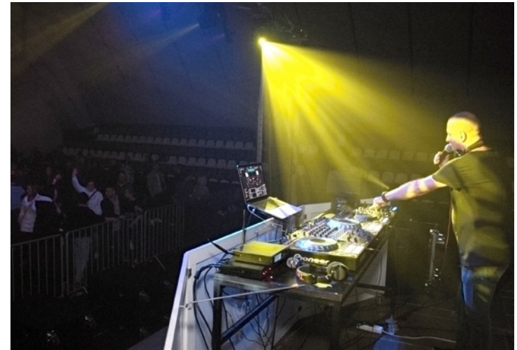
Az éjjel soha nem érhet véget