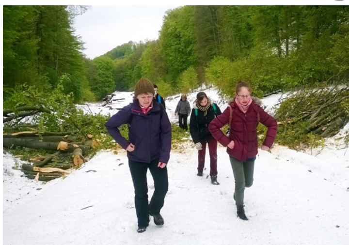
Kidőlt fák közt, havas tájon vezetett az út