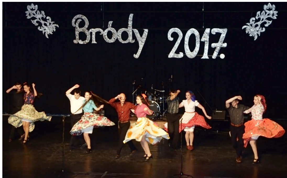
Az Ajka-Padragkút Néptáncgyűttes rendhagyó koreográfiákkal mutatkozott be

Kifinomult, intelligens, kissé lázadó, mégis rendkívül tartalmas kulturális bemutatóval készültek a Bródy Imre Gimnázium diákjai az iskola hagyományos gálájára, ahol a tehetség minden formája teret kapott. A prózától, a hangszerjátékon át a táncokig számos műfajban bizonyítottak a fiatalok, érzékelte az intézményben központosuló sokszínűség.