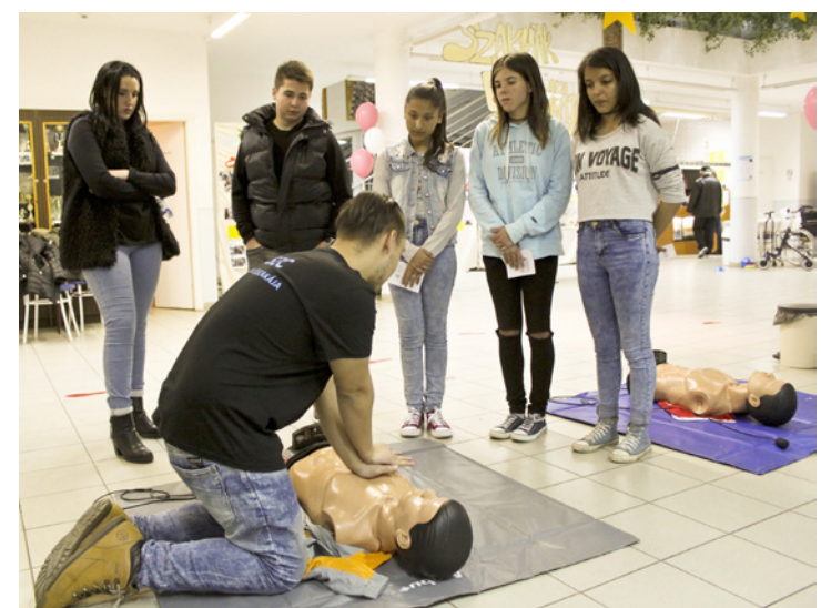
Az egészségügyi-szociális szakmák iránti érdeklődés felkeltését szolgálta az újraélesztés-elsősegélynyújtás technikáinak bemutatása

A rendezésnél részt vehettek ujjlenyomat-készítésben, megismerkedtek a rendvédelmi szervek felszerelésével, védőruházatával, ki is próbálták azokat. Tanulhattak önvédelmi fogásokat, láttak mentőkutyás bemutatót, és megtudhatták, hogy néz ki egy tüzoltó autó kívül-belül.