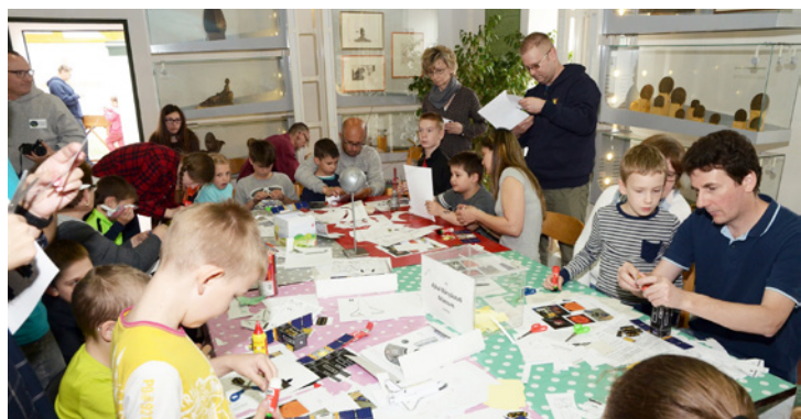
Be se fért egyszerre a terembe a rengeteg érdeklődő

bálásával, amit Veisz András állított össze a szabadban. Az üdítő palackból készült rakétákat magasnyomással reptethették az ég felé 30-60 méter magasságig a gyerekek. Az elszálló flakonok látványosan szemléltették az igazi kilövések működési elvét. Természetesen az ifjúság a visz-