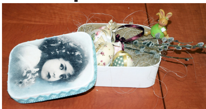
Hangulatos dísz tárgyak készültek

Legutóbbi felnőtt foglalkozásukat április 12-én tartották, amikor több funkció díszdobozt készítettek az aulában. A foglalkozásvezetők ekkor az egyszerű, ám mutatós tárgy elkészítéséhez szükséges hozzávalókat készítették elő. A szép számmal érkező kreatívok izgatottan válogattak a szebbnél szebb minőségi anyagok között. A fő attrakció az iparilag előállított papírmásé doboz dekupázsolása volt ezen a délutánon. Bizonyára kevesen gondolták, hogy ez a technika már nem sokkal Krisztus születése után elterjedt Kínában. Tárgyakat díszítettek kivágott papírmintákkal, majd lakka-