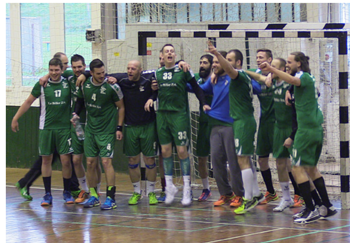
Így ünnepelte győzelmét az ajkai kézilabda csapat