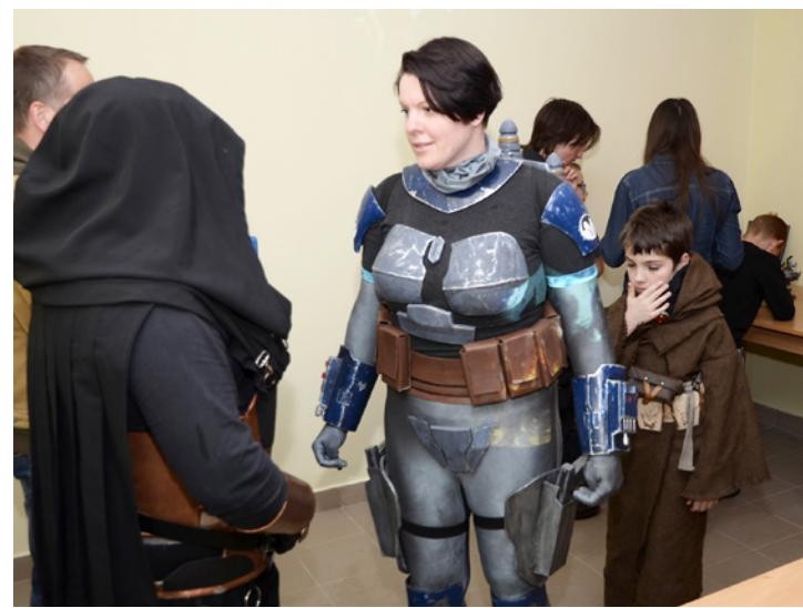
Darth Revan, Bo-Katan és egy kis jawa gyűjtőgető