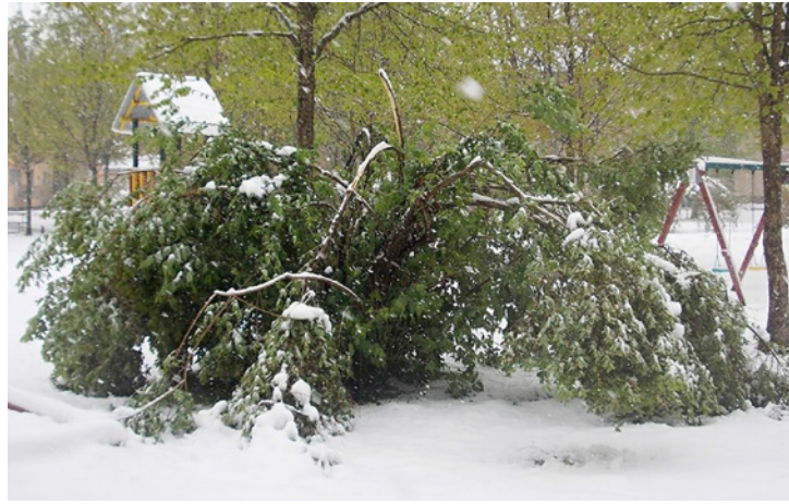
A lombosodó fákat nagyon megviselte a váratlan teher