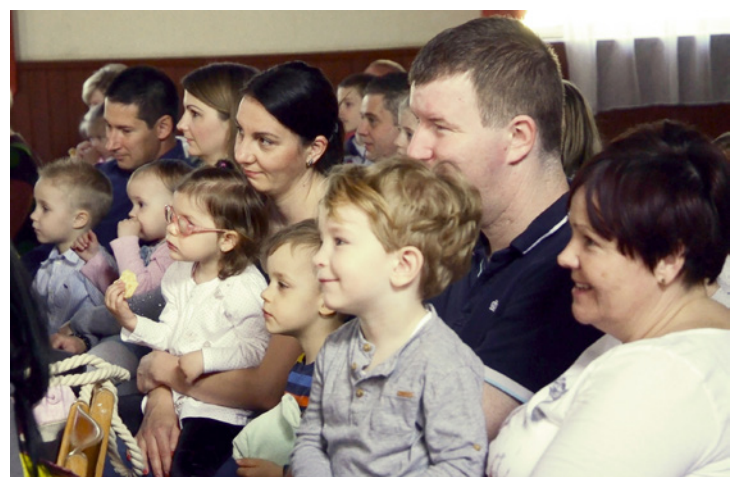
A felnőttek nosztalgizáltak, a gyerekek szurkoltak Mazsolának

A mese főszereplője Mazsola volt, akit elkergetett a gazdája, mert olyan kicsi, mint egy szem mazsola és belőle úgysem lesz soha tisztességes disznó. Elkeseredett, mígnem a Futrinka utcában összetalálkozott Manócskával, akitől nagyon sokat tanult. Kitérült előtte a világ. Azután sorra hozzájuk szegődtek a környék lakói egy-egy kis történet erejéig. Így számos baráttal lett gazdagabb. A bábéledés látványelemei egyszerűek, de megkapóak voltak. A spriccelő víz sugarak és a lefelé szálló szappanbuborékok kilépve a paraván mögül elvarázsolták az apróságokat. Pivarnyik László zenei összeállítása jól ismert, fülbemászó népi gyermekdalokkal, mondókákkal színesítette a bábjátékot. Rendkívüli