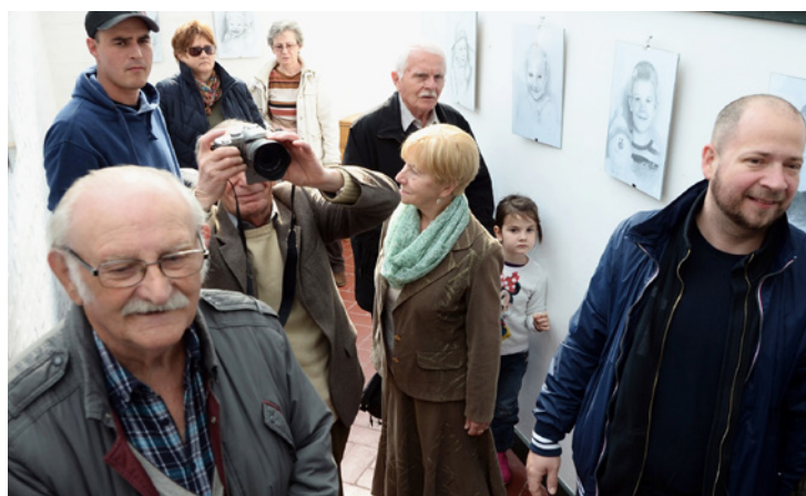
Sok érdeklődő jelent meg a helyi alkotó kiállításán