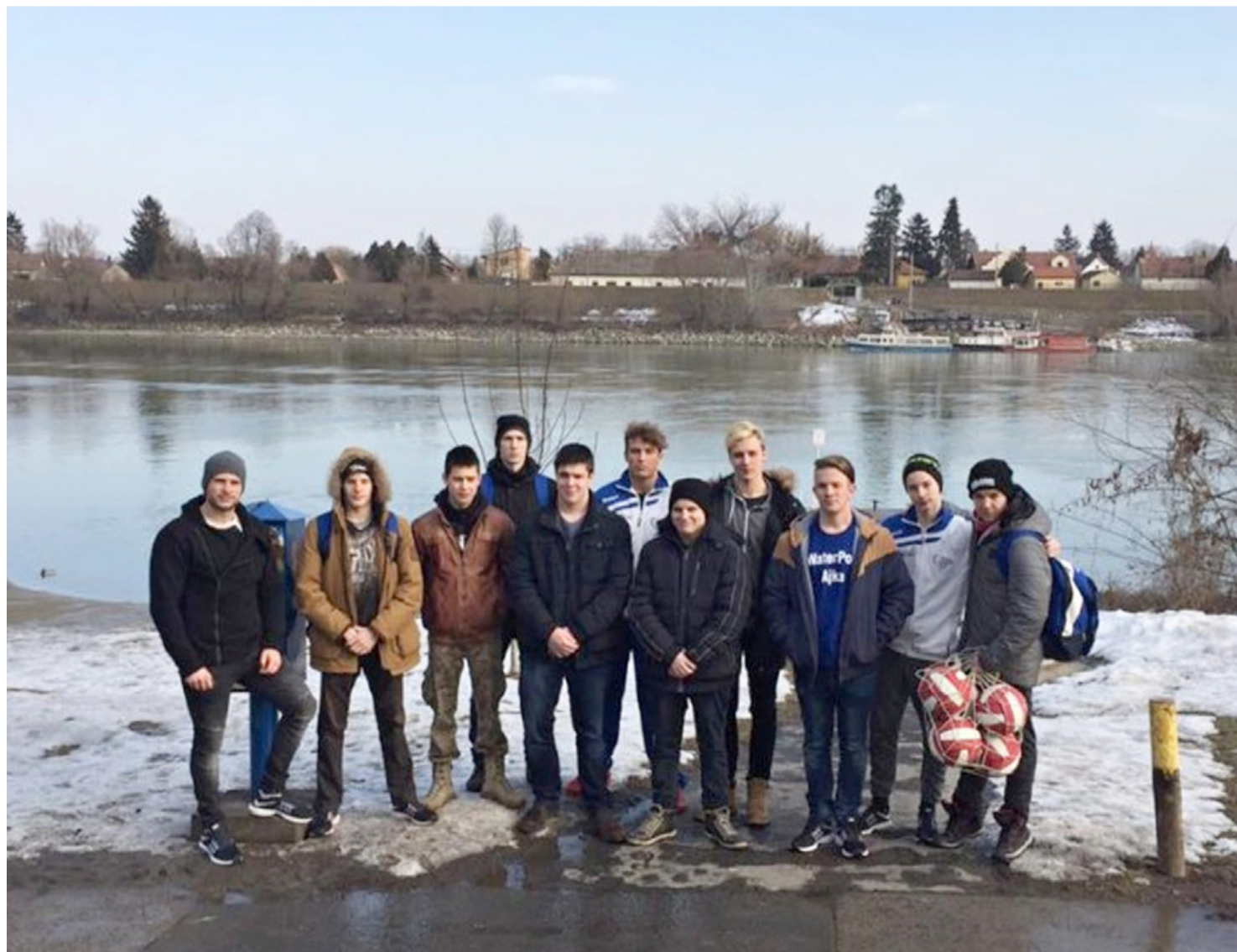
Cápák a parton

Egy időben, de két helyszínen ugrottak medencébe az ajkai vízilabdások a hétvégén, ugyanis a Budapest Bajnokságban és Dunántúli Vízilabda Ligában is összecsapás várt rájuk. Két győzelemmel és egy vereséggel zárták a versenynapot.