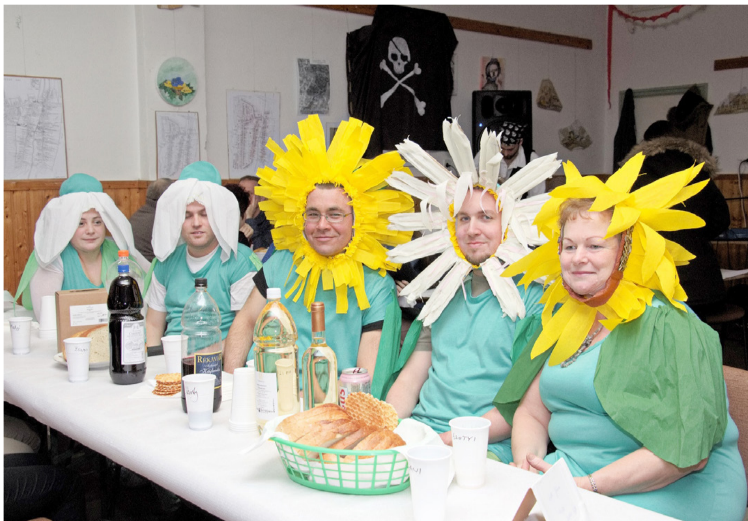
Virágba borult ajkarendekiek