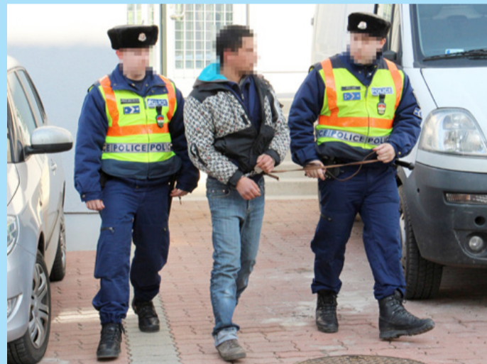
Egy nap alatt kétszer vették őrizetbe a rendőrök

A somlőjenői lakost a rendőrök előállították az Ajkai Rendőrkapitányságra, és kihallgatták. Mivel a férfival szemben több hasonló bűncselekmény elkövetésének megalapozott gyanúja miatt eljárás van folyamatban, ezért a rendőrök őrizetbe vették, és előterjesztést tettek előzetes letartóztatásának indítványozására.