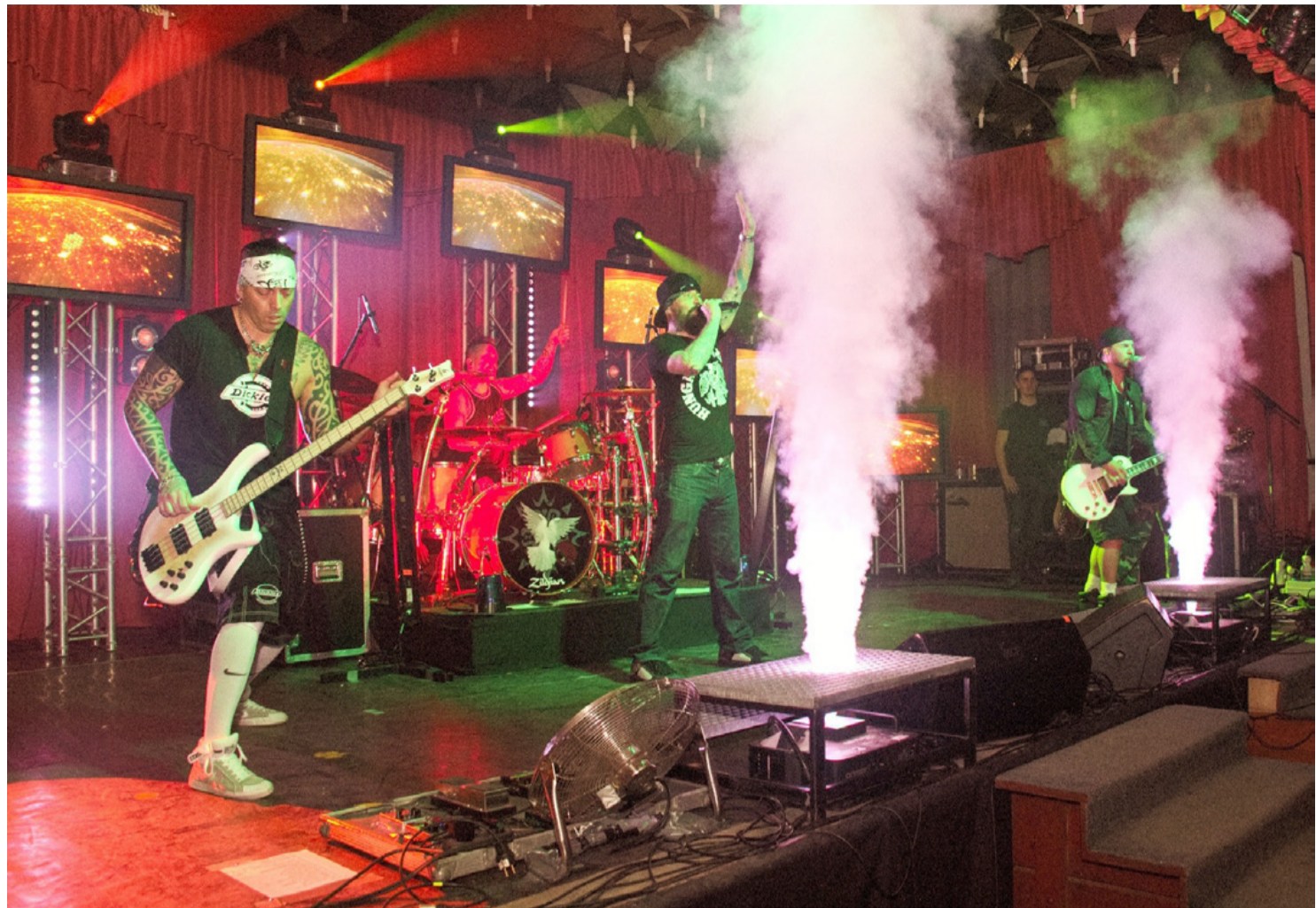
A hangulat megteremtésében pirotechnika és LCD televíziók sokasága is segédkezett