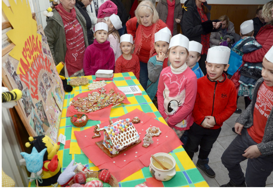
Ajkai kiskukták egy csoportja