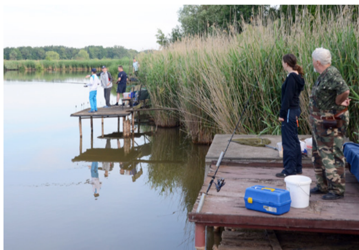
Pecások a Lőrinc-tavon