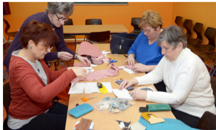
Készül a többfunkciós tok