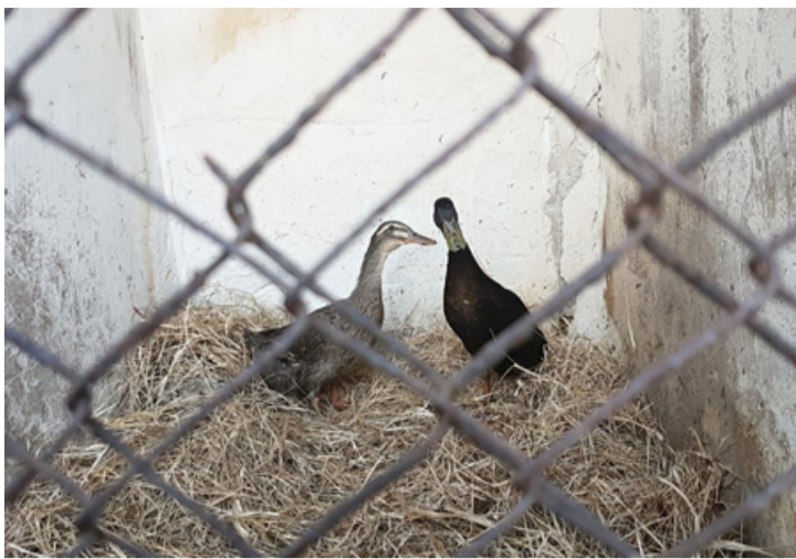
Meg kell akadályozni a baromfi vadmadarakkal történő érintkezését