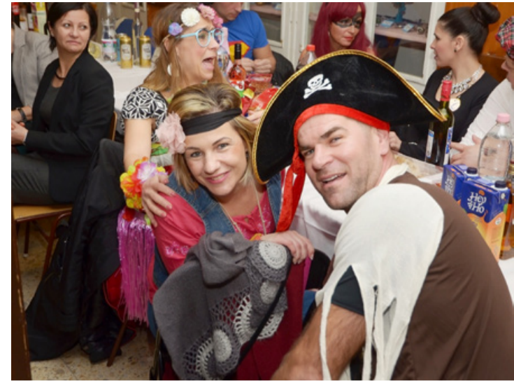
Jelműbe öltözött bálzóok egy csoportja

Elnézve a bálzókat, ebben nem volt hiány. Mind a szülők, mind az óvónők jelműbálszerezőkbe bújva, vidáman,