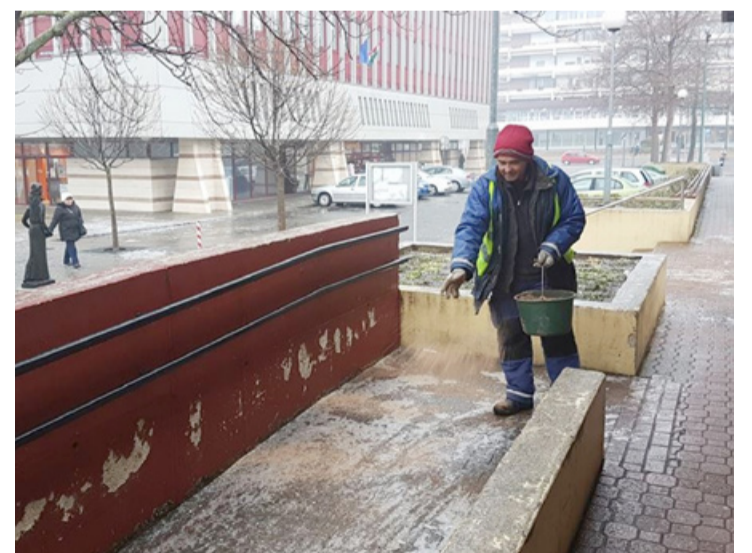
A közmunkások reggel 7 órától folyamatosan síkosságmentesítették a járdákat