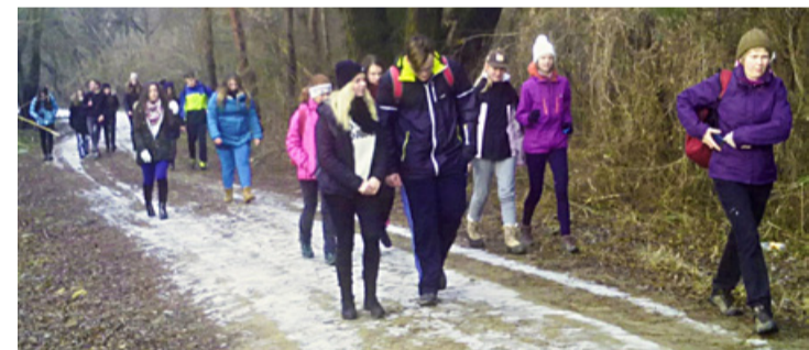
Úton a csapat

ve érkeztek a Köves-patak 4,5 méter magas vízeséséhez. Aki már járt a Csurgón az tudhatja, hogy nagyon meredek lehet lejutni oda ez most télen, a fagyos, sáros földön különösen nehézkes volt. Szinte egy diák sem úszta meg egy-két esés nélkül. Szerencsére senkinek nem lett komoly baja. A nehézségek leküzdése után a befagyott víz-esés különleges és ritka látványa kárpótolt mindenkit a kékzöld foltokért. Rövid pihenő után a túrájuk Borsod-pusztán át Ajkarendekre vezetett, ahol a biciklúton gyalogolva értek vissza a városba. (fd)