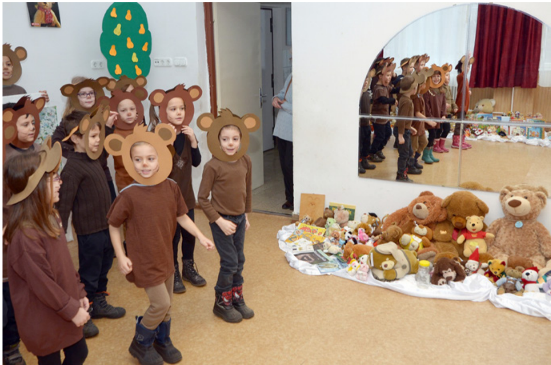
Macinak öltözött kisdíjak hívogatták elő a macit a barlangjából