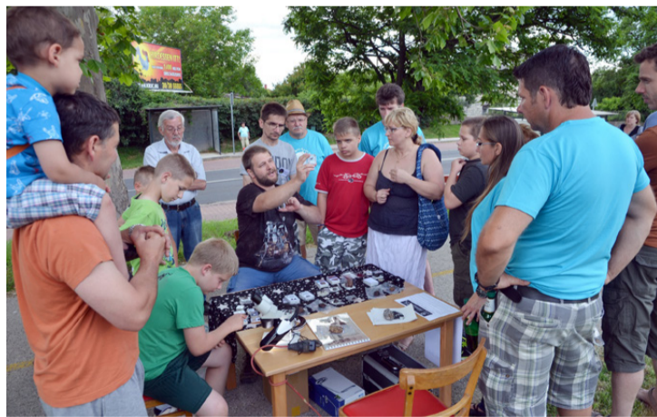
Többeket érdekelt az Úrkúti Csillagászati Klub ismeretterjesztő, interaktív bemutatója

Az arra közlekedők két egyenpólóban sürgő-forgó szervezőkre lettek figyelmesek. Volt, aki elhozta otthonról a hangfalat, a hosszabbított. Többben süteményekkel a kezükben érkeztek. Néhányan a bogrács környékén tüsténkedtek, ahol pásztorbaranya készült. A csillámtetkös nem győzte készíteni a változatos mintákat a gyerekekre. Többeket érdekelt az Úrkúti Csillagászati Klub ismeretterjesztő, interaktív bemutatója. Közben a légvárat is birtokba vették a gyerekek. A rendőrség munkatársa kerékpár KRESZ-tesztlapokat osztott ki. A kitöltést követően izgatottan várták, hogy mennyire kopt meg a tudásuk. Az ügyeskedő kézművesek szelforgót készítettek. Talán a legnagyobb