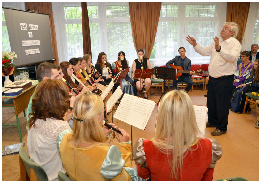
Örömmuzsikálás a jubileumi koncerten