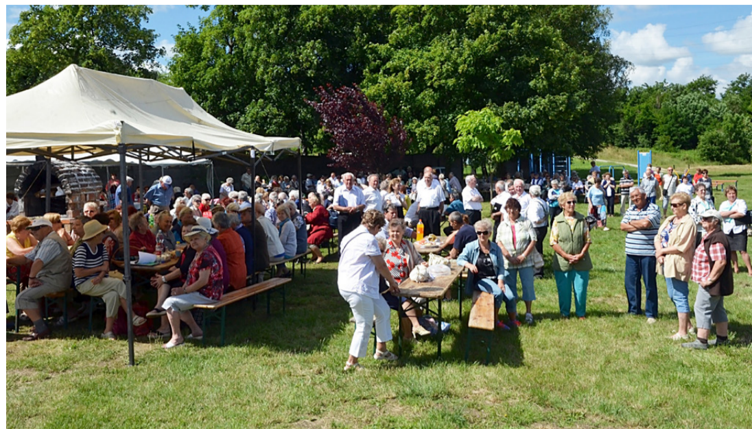
Sokan vettek részt a júniusi majálison