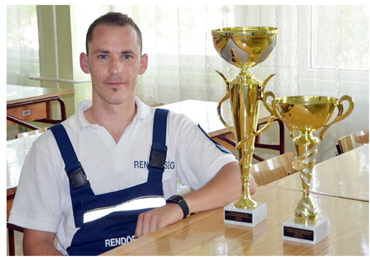
Dupla tróféát nyert az ajkai rendőr