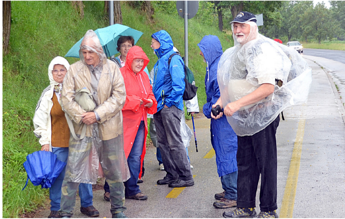
A zápor kétszer is megzavarta az utat