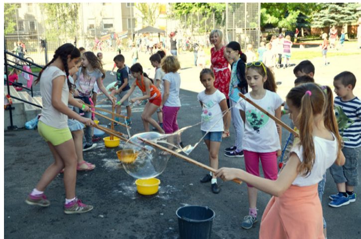
Összemérték ügyességüket többek között óriásbuborékfújásban is