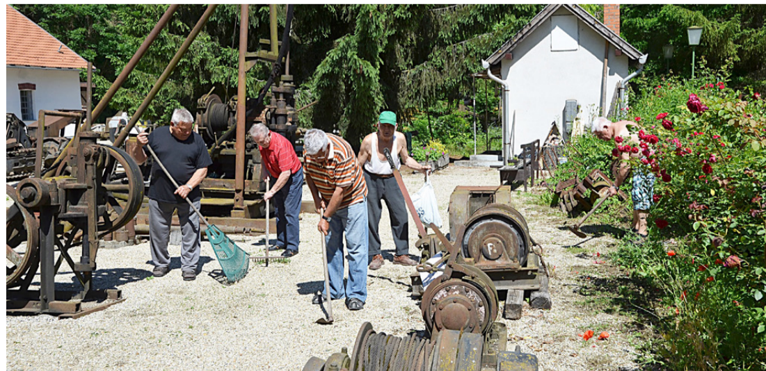
15 pár szorgos kéz takarított a múzeumban