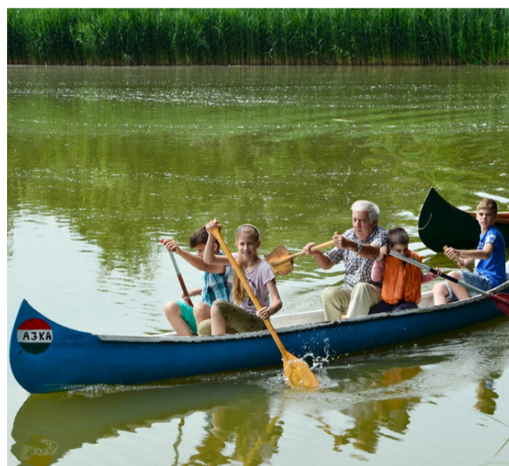
Nagypapával együtt eveztek az unokák a családok versenyében