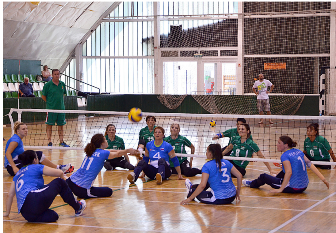
A szlovén-magyar ülőröplabda mérkőzés egyik izgalmas pillanata