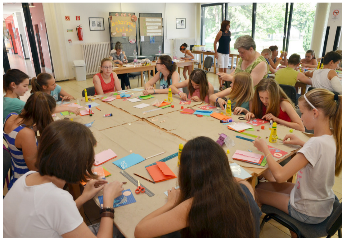
A kézműves napköziben minden résztvevő jól érezte magát