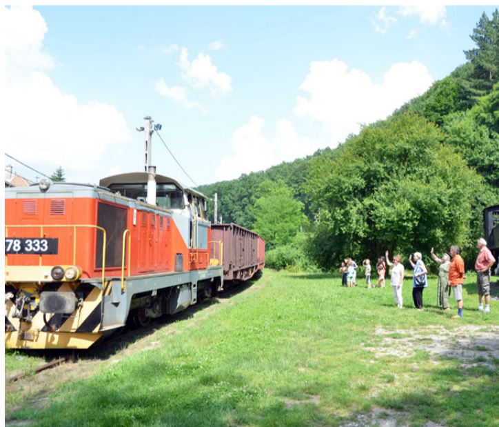
A Csingervölgy mozdonyánál is megállt az utolsó vonat