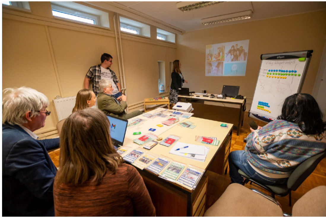
A játék közös problémamegoldásra sarkall