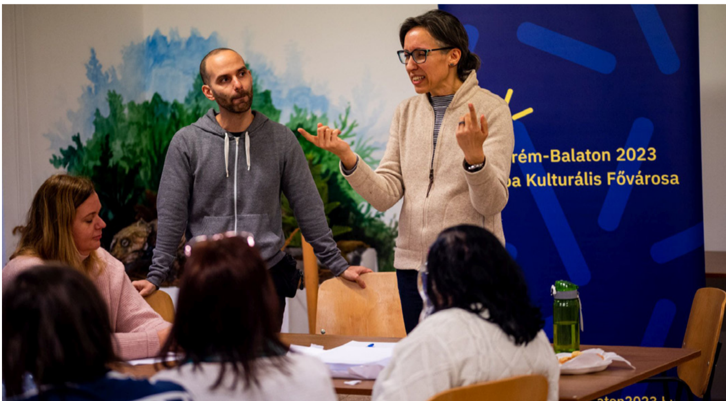
Az író színdélezen avatta be a workshop résztvevőit az íróvá válás koránt sem könnyű folyamataiba