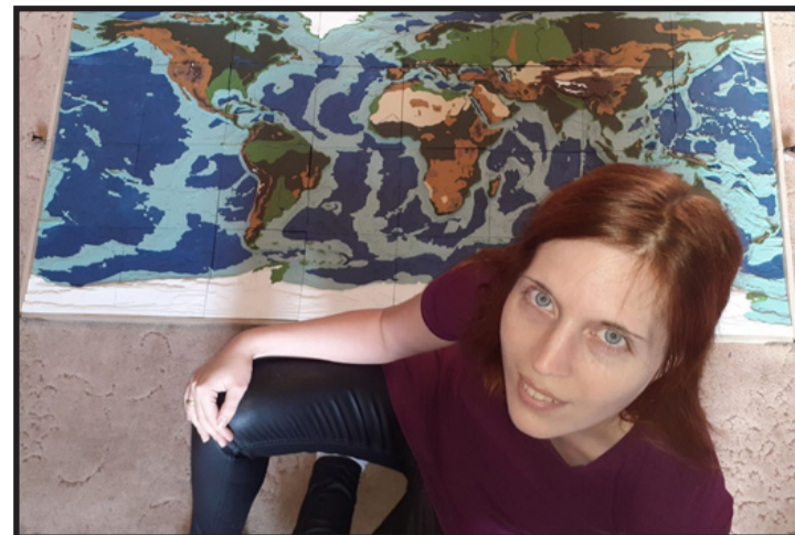
Az nem lehet...