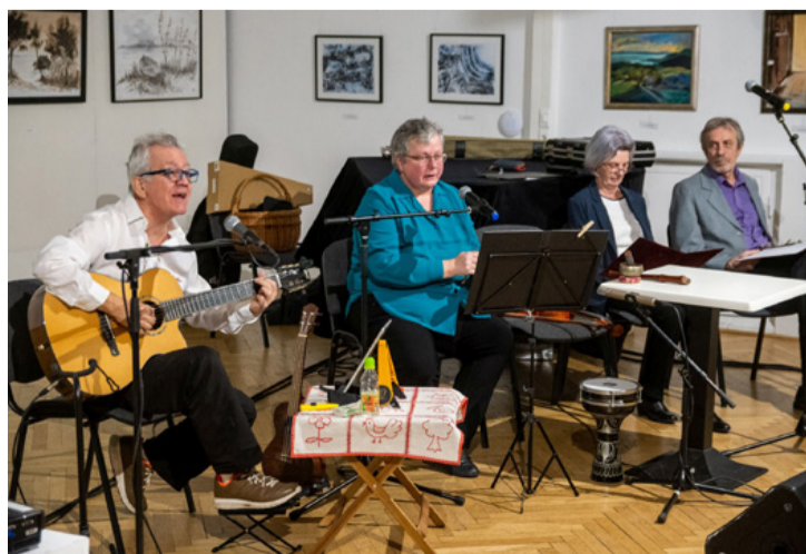
Akik elvarázsolták a közönséget

■ Megzenésített verseivel emlékeztek az irodalomkedvelők Fekete István íróra, költőre, gazdatisztra, aki életének egy jelentős szakaszát, egy jó évtizedet Ajkán töltött. A Nagy László Városi Művelődési Központban január 26-án tartott rendezvényen a nagyterem is kicsinek bizonyult, de a szervezők a méretes helyiséget teleakták pótszékekkel. Így is voltak azonban, akik állva hallgatták végig a csaknem egy órás műsort, amiben a művészet több ága, ének, zene, vers és rajz is szerepet kapott.