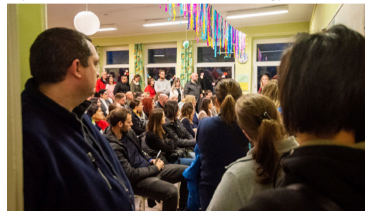
A Csodavár tájékoztatóját szinte előzönlötték az érdeklődők

A tanítónők tájékoztatójukban elmondták, hogy csak akkor tudnak eredményt elérni, ha az iskola, a gyerek és a szülők együttműködnek. Az oktatásnál figyelembe veszik