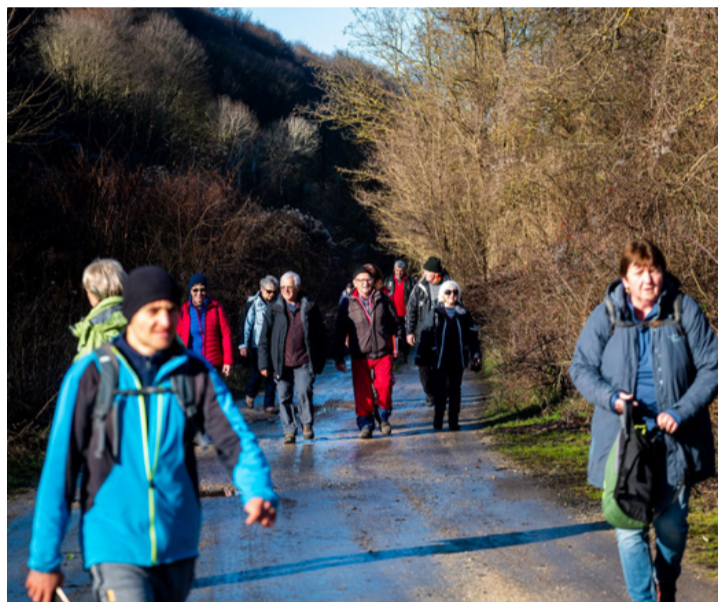
Érdeemes velük tartani, testet-lelket karbantart egy jó erdei túra