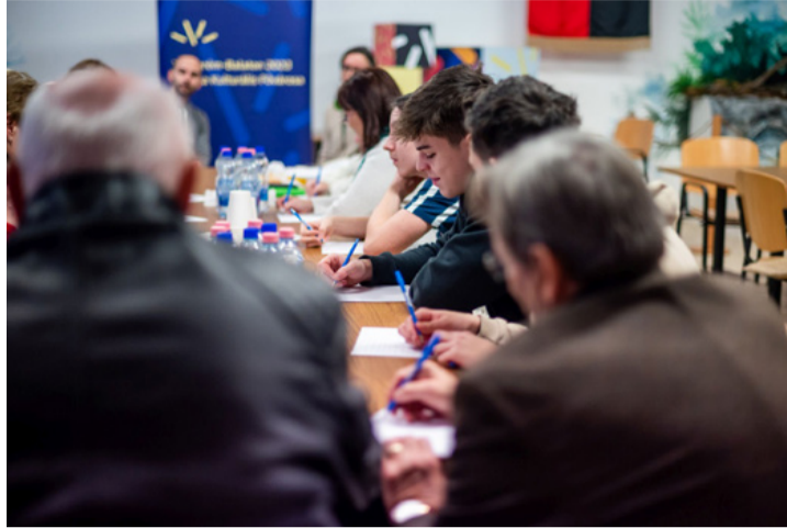
A feladatok megoldása nem kis élvezetet okozott az „írótanoncoknak”