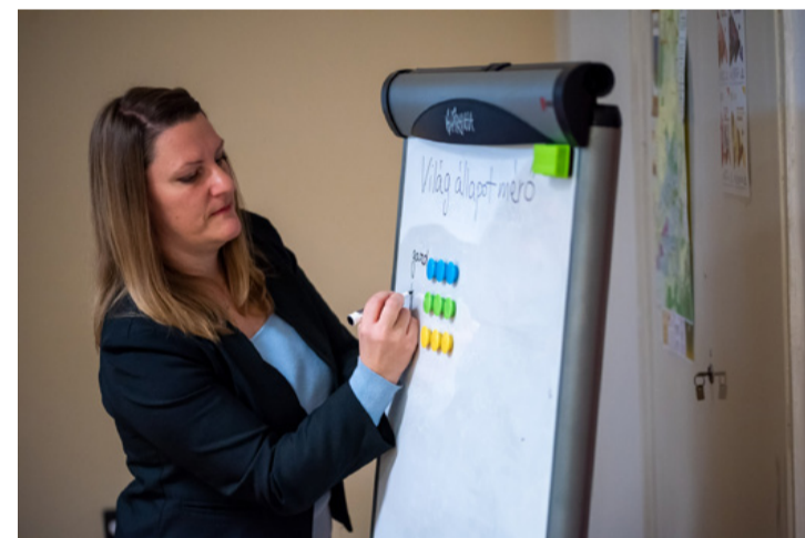
A módszer ez idő szerint egyetlen hazai trénerének a kisujjában vannak a játék elemei, bár sok kifejezés még csak japánul, vagy angolul jut eszébe

Keretbe: Az úgynevezett Fenntartható Fejlődési Célok (Sustainable Development Goals – SDGs) az ENSZ országai által 2015-ben elfogadott 17 cél, amelyek a világ környe-