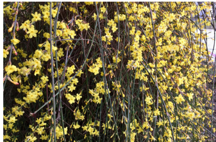
A téli jázmin teljes pompájában