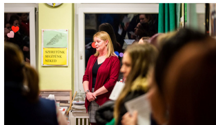
Az osztályzatokkal nem mérhető dolgokat, például a segítő-készséget, a közösségi munkát, a kreativitást, a szervező-készséget is fontosnak tartják elismerni

az egyéni képességeket, a fejlődés ütemét. Mindenki fejlődését saját magához mérjük, nem hasonlítjuk össze a gyerekeket egymással. A tehetséggondozás és a felzárkóztatás egyaránt fontos. Az osztályzatokkal nem mérhető dolgokat,