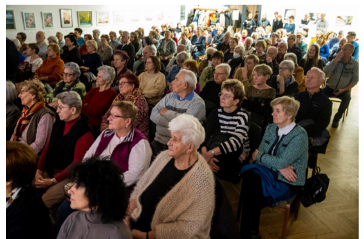
Az ajkaiak szívében tovább él Fekete István emlékezete

Verseit Aranymalinkó címen adták ki, utoljára Gáspár János szerkesztésében, Csabai Tibor illusztrációival. Ez a kis kötet hatvan verset tartalmaz. Közülük zenésített meg néhányat Dezső Lajos kántor-tanító, a kották pedig a múzeum polcára kerültek. Angermayer Judit ajánlotta Papp Ferenc figyelmébe, aki addig dúdolta a dallamokat, amíg a tanító és a saját zenéjéből összeállt a mai varázslat. A hegedű, a gitár, a furulya és az ütősök megidéznek a természet hangjait, a madárcsicsergést, levélsuttogást, a nádas zúgását, de az emberi lélek zendüléseit is.