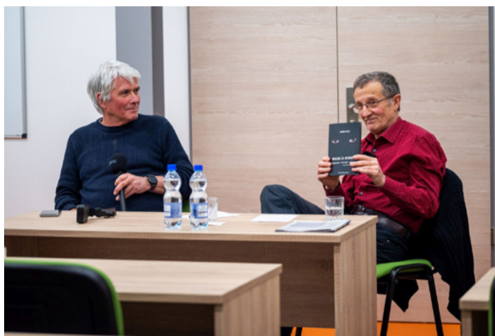
Az előadó „szakirodalmat” is ajánlott a téma iránt érdeklődőknek

Természetesen érthető az „új módi” is, mármint, hogy a nyomozás érdekeit esetlegesen sértő információkat igyekszik a végsőkig visszatartani a rendőrség. Ehhez hozzá kell szokni. Utólag