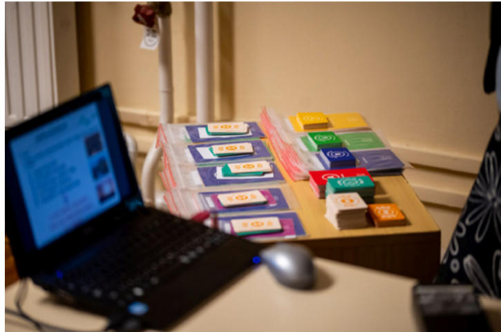
A kártyajáték kellékei