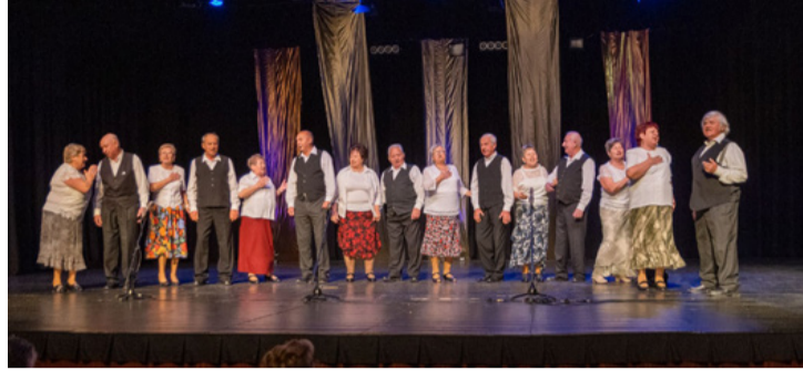
A Gyepesi Örökségünk Egyesület kórusa operettslágereket adott elő