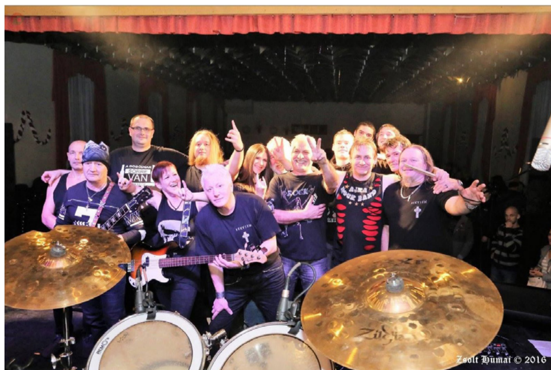
Egy hat évvel ezelőtt készült koncertfotó