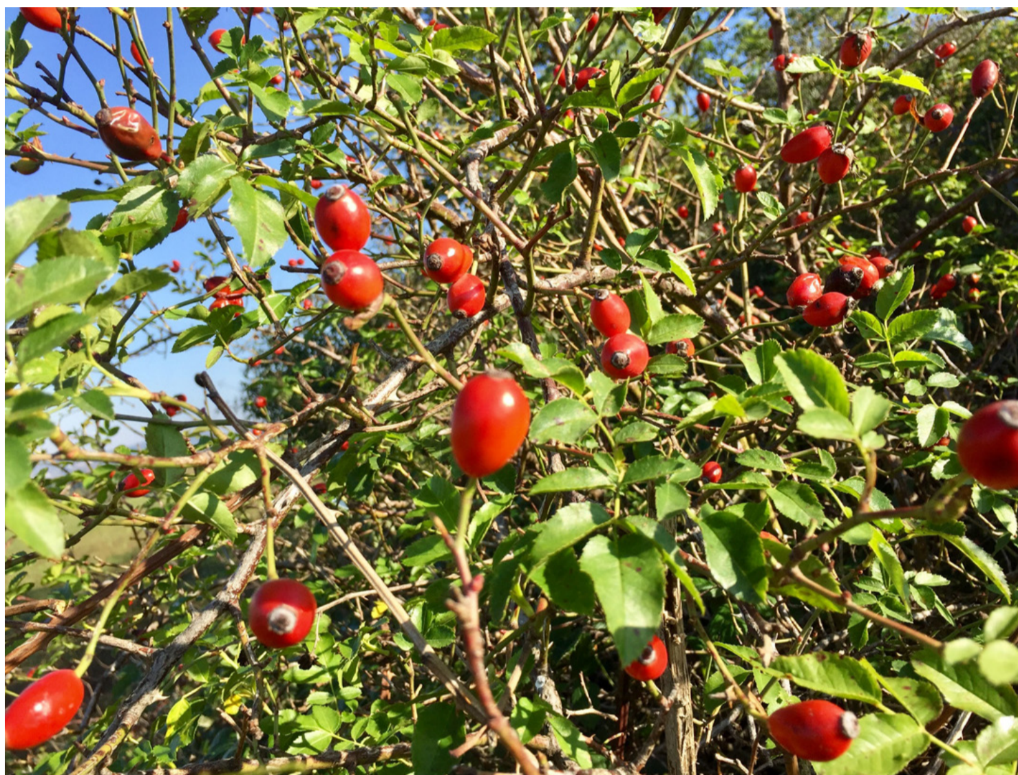
A csipkebogyót akkor szüreteljük, ha már megcsípte a fagy