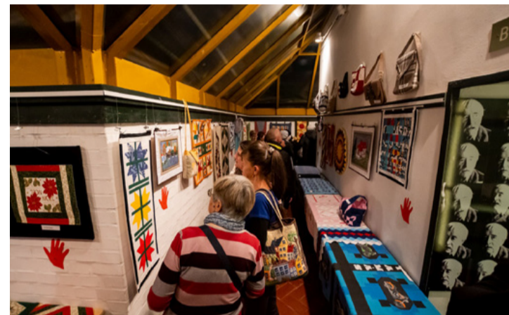
A kiállítás nem csak szemét gyönyörködtető, de otthonra is adhat ötleteket a látogatóknak