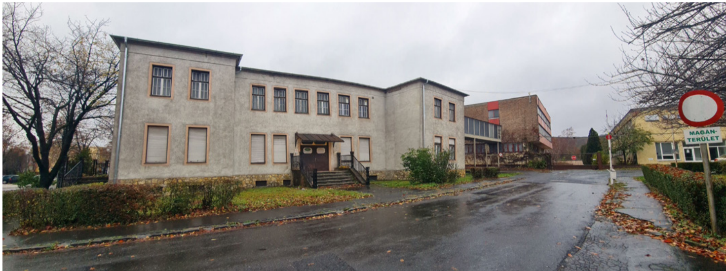
Az Ajka Kristály Múzeum előzetes bejelentkezéssel látogatható. Az önkormányzat megegyezett a megvásárlásáról a tulajdonossal