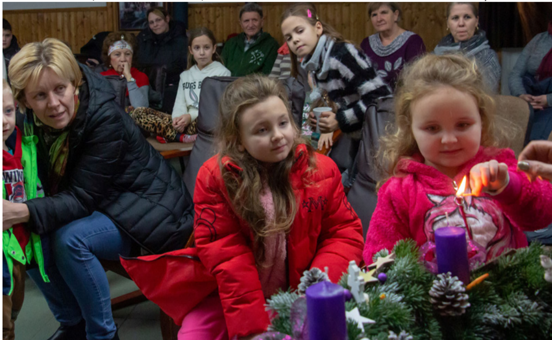
A gyertyagyújtás áhítatos pillanata

Kérjük, hogy ollót, ragasztót hozzatok magatokkal!