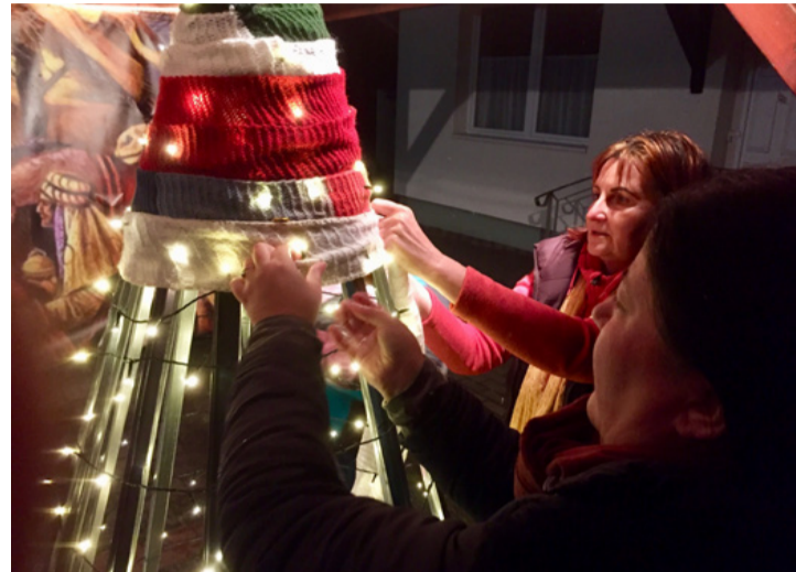
A rendekiek sálba öltöztetik a szeretet karácsonyfáját