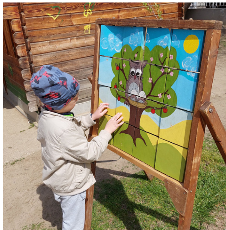
Szemben egy új játékkal – a megfejtés izgalmaival

kal, tanulhattak, szórakozhattak a Katica óvoda kicsinyei április 21-én.