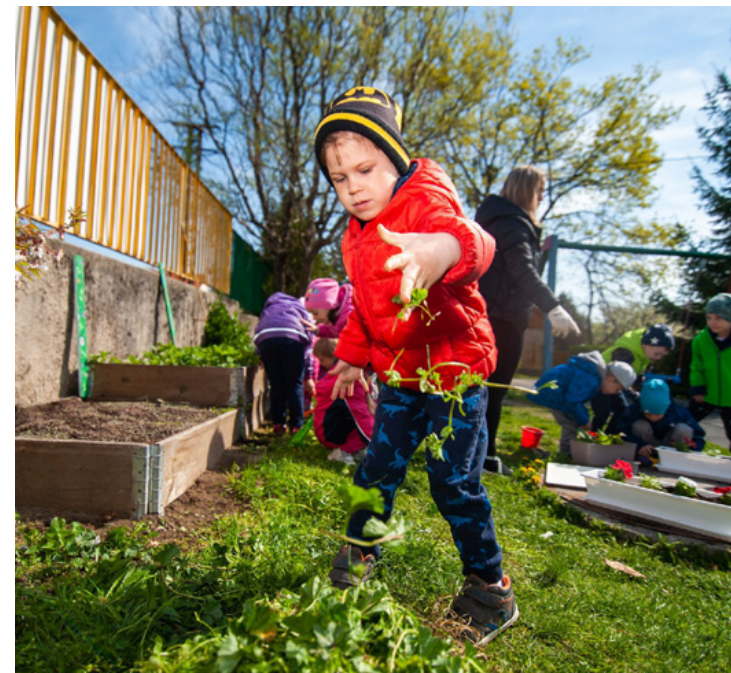
A kertápolás nehézségei