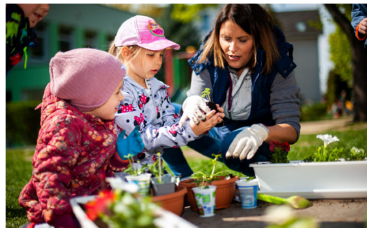
Közösen óvjuk a természetet