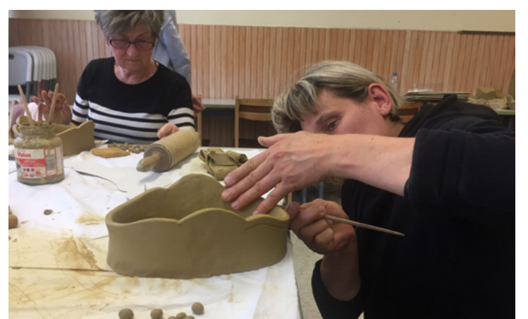
Minden részletükben gondosan kidolgozott tálak készültek