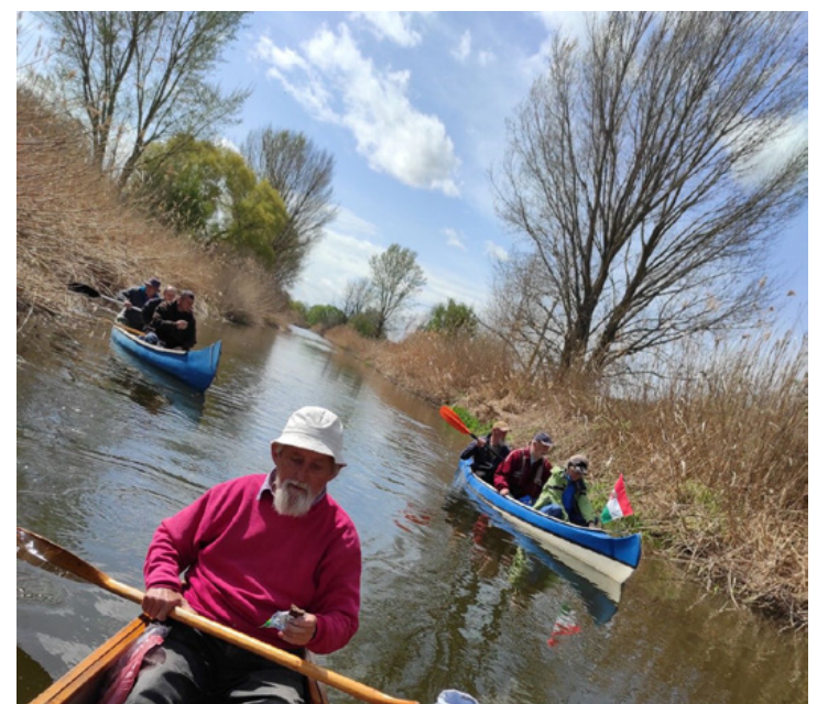
Csordogálás a Marcalon egy kis kalória bevittel