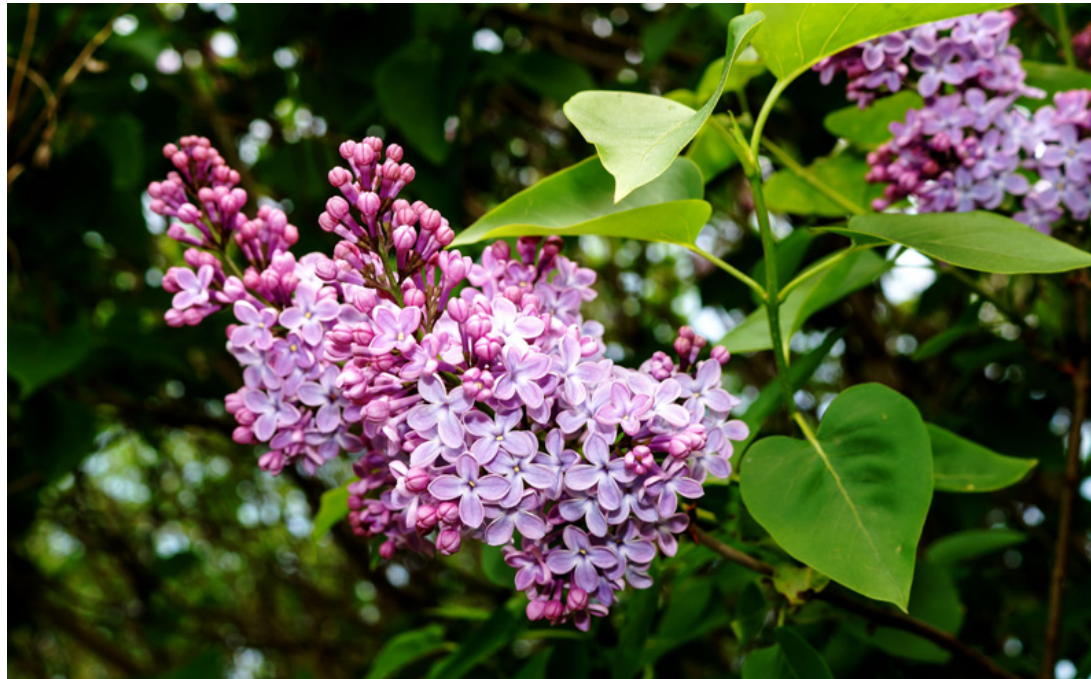
Az „orgonaszín” erről kapta az elnevezését