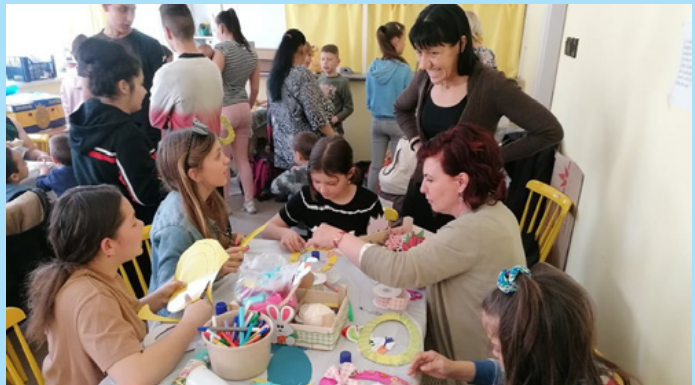
Végre újra együtt ünnepelhetek