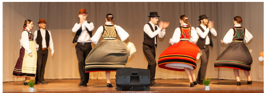
„Padragkútért” táncolt az Ajka-Padragkút Táncegyüttes mezősegi táncokat

A Civil Fórum „Padragkútért” Egyesület április 23-án szervezte meg a padragkúti civil szervezetek találkozóját a Padragkúti Művelődési Házban. A szereplők, művészeti csoportok kulturális műsorokkal készültek. Elsősorban zene, táncos szórakoztató produkciókkal léptek színpadra.