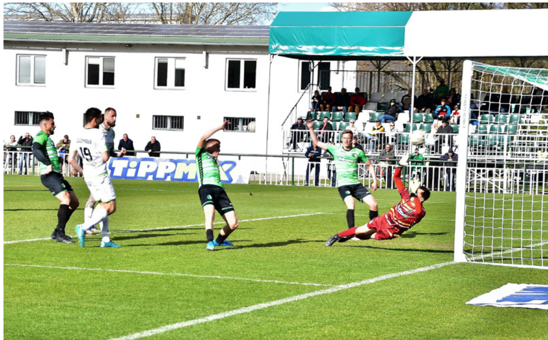
A labda Tóth hálója felé tart. 1:0