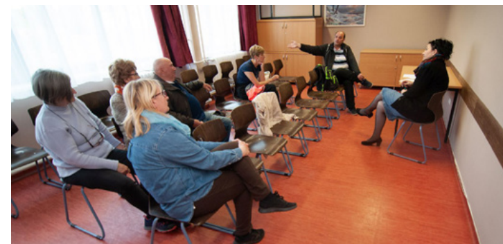
A „finnpártiak” maroknyi csapata. A bővülésben reménykednek